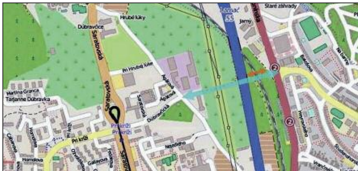
Plánované prepojenie Dúbravka - Lamač cyklocestou a cyklolávkou ponad železnicu.