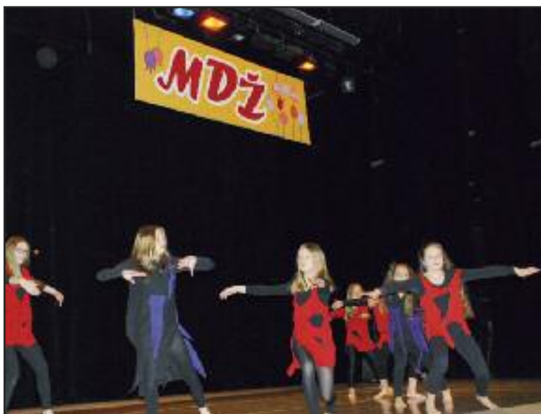
Alkana sa predviedla v rôznych štýloch.