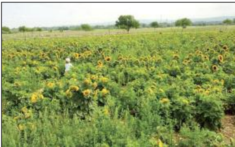
Výlet do Schloss Hofu ponúka rôzne atrakcie, napríklad aj pasúce sa ťavy mimo zoo či schovávačku medzi slnečnicami.

Pre rodiny s deťmi je tu statok so zvieratkami, ihrisko, ale aj dvorček, do ktorého deti môžu vstúpiť a kozy či ovečky si zblízka pozrieť a pohladkať. Krásne zákutia v