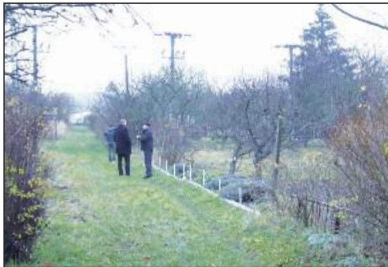
Boli sme sa pozrieť na záhradky a stromy, ktoré majú ustúpiť výstavbe parkoviska.

Dúbravka si vyžiadala aj doručenie vyjadrenia príslušného stavebného úradu o tom, že to je líniová stavba, aby neprišlo ku konfliktu. Potvrdenie, že plánovaný terminál integrovanej dopravy je líniová stavba, už prišlo.