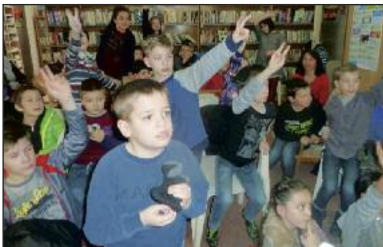
Debata ako vidno deti zaujala, okrem toho sa tvorilo, súťažilo.

Hovorilo sa o prekrásnych detských knižkách J. C. Hronského, o jeho zvieracích hrdinoch a jeho nádherných myšlienkach, ktoré zostanú večné. Úspech nevídaný mal aj „krumpľový“ cukor, ktorý deti ochut-