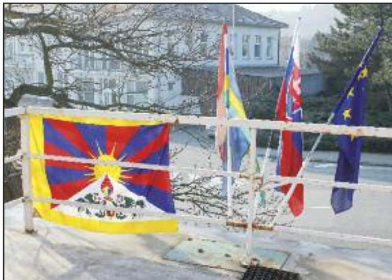
Tibetskú vlajku bolo vidieť na miestnom úrade na Žatevnej 2.