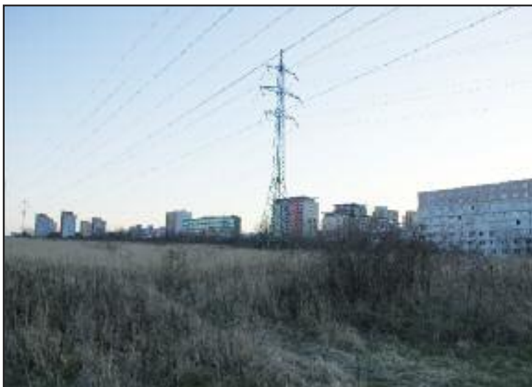
Nehostinná krajina za ubytovňou Fortuna, skultúrniť by ju mala aj plánovaná cyklotrasa a lávka do Lamača.

Nový cyklistický chodník by sa mal podľa Skokanovej vybudovať aj v lokalite Jelačičova - Metodova. Bratislavský magistrát zároveň pripravuje a zabezpečuje dokumentáciu