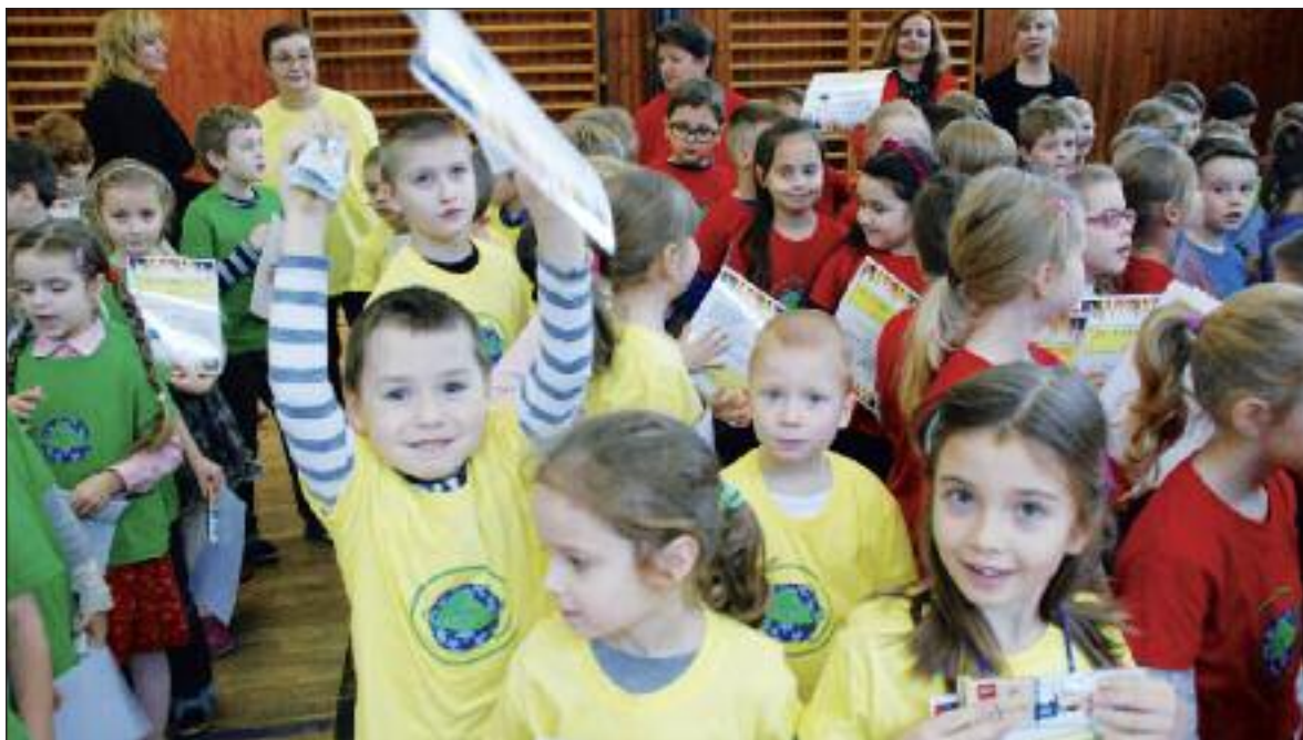
Niektoré školy mávajú aj slávnostné imatrikulácie prváčikov. Takto sa tešili deti na ZŠ Pri kríži.