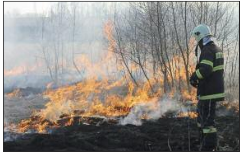
Sucho, teplo, vietor či ohorok a požiar je na svete.

Za mimoriadne suchého počasia však postačí k zapáleniu vyschnu-