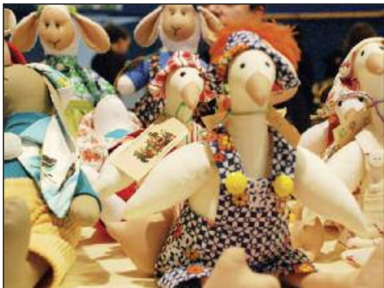
Medzi výrobkami sa usmievali aj tieto zvieratá.