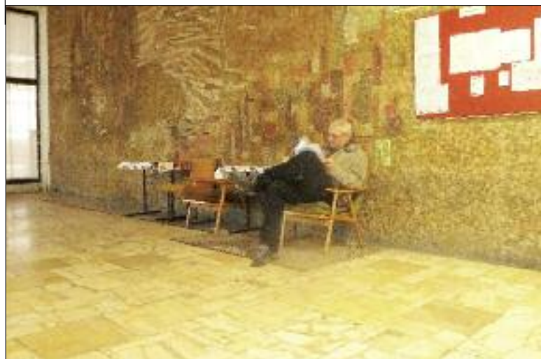
Hľadá sa nový čitateľ knižnice alebo knižné hliadky v teréne.