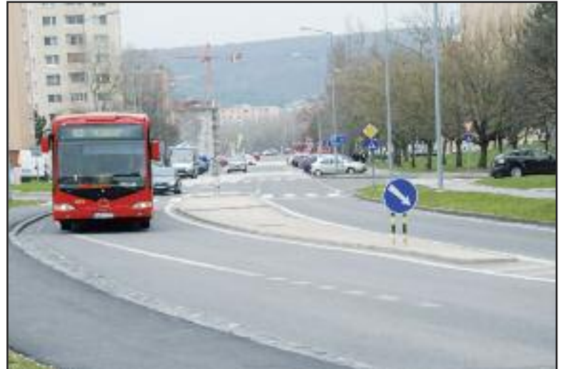
MHD a najmä trasy autobusov, ktoré spájajú Dúbravku s mestom sú častou témou debát i kritiky.