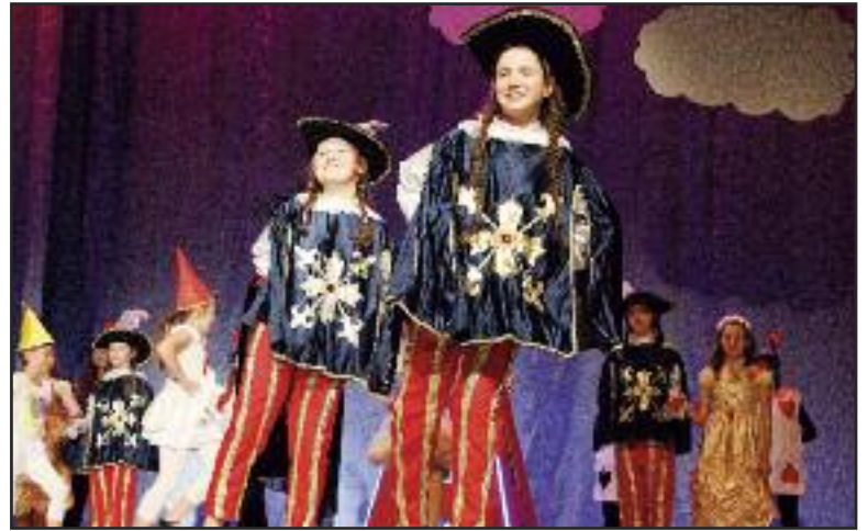
Z vystúpenia pri 25. výročí Alkany v Dúbravke

Alkanu dnes tvoria tri umelecké školy - jedna stredná škola, čiže