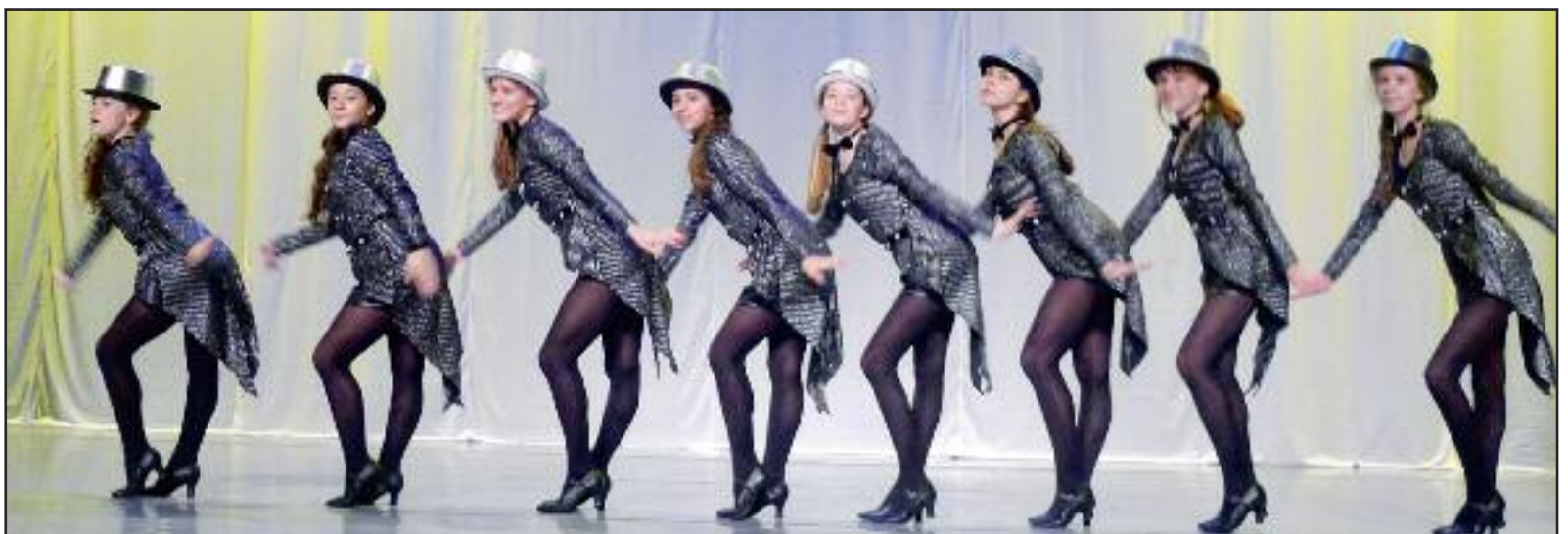
Muzikál Cats v podaní Divadla Alkana.

V divadle Alkana účinkujú všetky deti škôl Alkany vo veku od 4 do 22 rokov. Najmladší žiaci od 4 do 6 rokov chodia do takzvanej