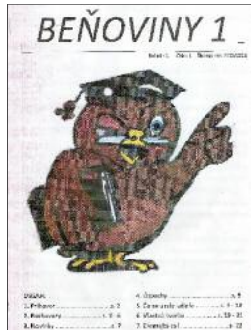
Časopis Základnej školy Beňovského - Beňoviny.

Pravidelne hodnotená vlastná tvorba detí prináša radosť nielen v reprezentácii školy, ale rozširuje ich obzor o nové poznanie, a tak niet divu, že aj v súčasnosti sa pripravujú do súťaže Bratislava-Moje mesto s ekologickou témou Ako zachrániť Bratislavu.