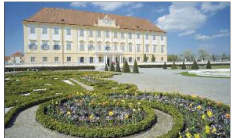
Zámok Schloss Hof bol postavený koncom roku 1720.

Zámok Schloss Hof bol postavený koncom roku 1720 ako vidiecke a lovecké sídlo princa Eugena Savoyského, na základe návrhu ar-