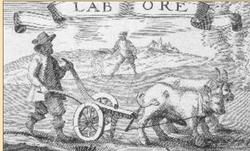
Oráč na dobovej medirytine.

Pozrime sa bližšie na príčiny tohto blahobytu v Dúbravke. Podnebie je zdravé, lebo tu fúka svieži vietor. Na pasienkoch a v lesoch je zabezpečené pohodlné a bez nákladných studní napájanie dobytká zdravou a vždy čerstvou vodou.