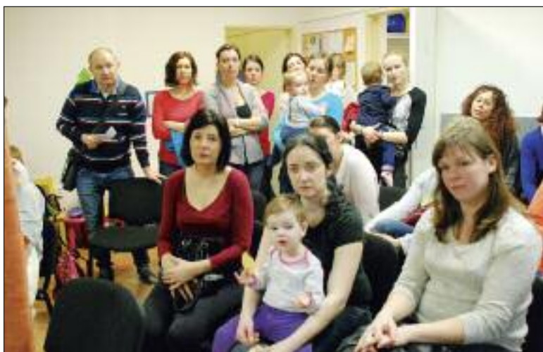
Na diskusii boli aj poslucháči v plienkach.

Potvrdenie o zdravotnom stave dieťaťa by malo byť aktuálne, čiže nie niekoľko mesiacov staré a lekári si za neho zvyknú účtovať 20 eur. Toto potvrdenie nie je potvrdením o akútnom zdravotnom stave dieťaťa, ale je potvrdením toho, že dieťa netrpí žiad-