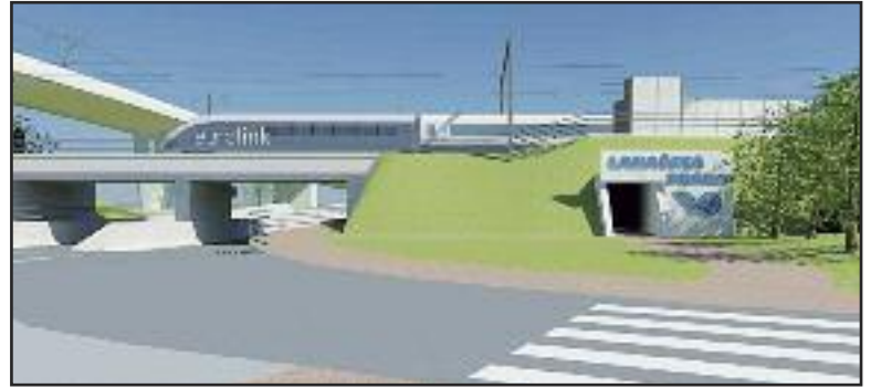
Vizualizácie plánovanej zastávky vlaku a terminálu pre Bratislavskú integrovanú dopravu tzv. Lamačská brána, neďaleko Agátovej

Nová zastávka vlaku má uľahčiť cestovanie Dúbravčanom, pre zámer však musia ustúpiť záhradky.