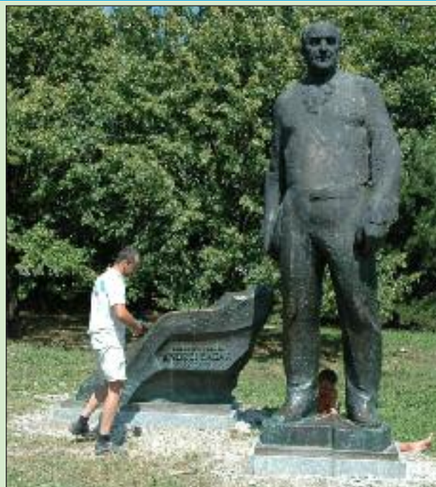
Do roku 2004 stála bronzová socha Andreja Bagara v nadživotnej veľkosti na Hviezdoslavovom námestí, po dohode s vtedajším primátorom bola prevezená do dúbravského parku Družba neďaleko Bagarovej ulice.