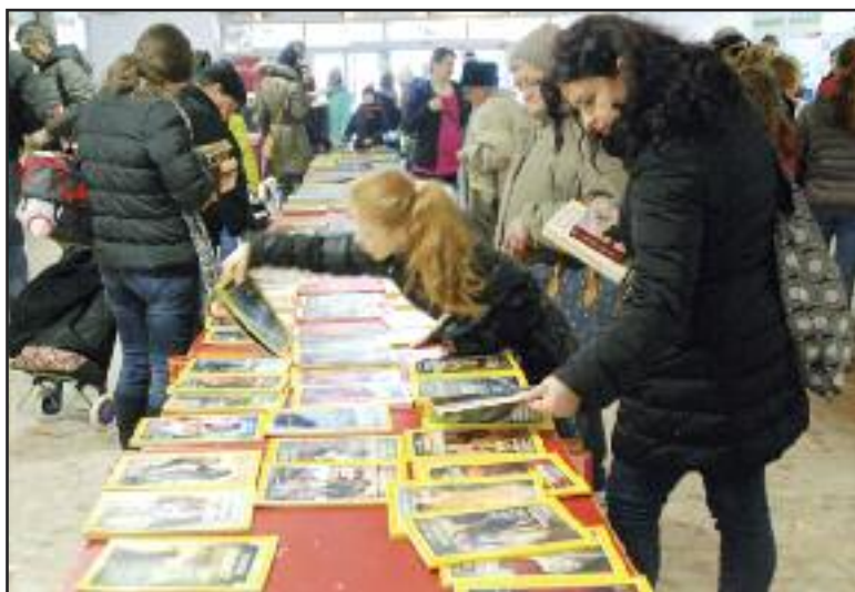
Darcov a najmä záujemcov o knihy bolo veľa.