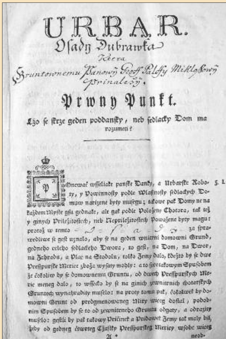
Titulná strana „Urbaru osady Dubravka, ktera gruntovnemu panovy Groff Palfy Miklošovy prináležy“ z 10. júna 1768.