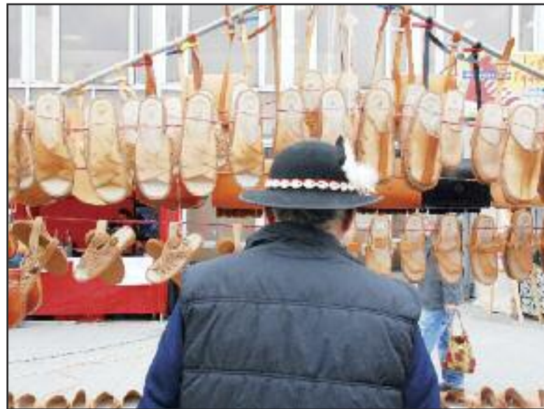
Stánky stáli aj pred kultúrnym domom.