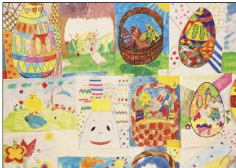
Do súťaže prišla stovka prác zo štyroch základných škôl.