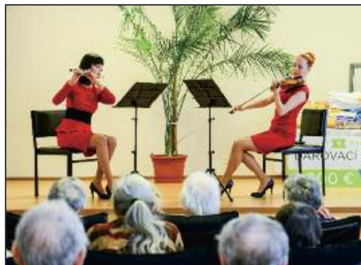
Kultúrny program zabezpečilo Trio Impression.

Divákov si umelci získali živelným prejavom a širokým repertoárom, do ktorého sa zmestil Mozart a Malá nočná hudba, ale aj známe beatlesovky či hity skupiny ABBA. Každý si teda prišiel na svoje. (red)