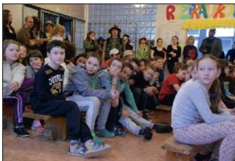
Pokyny na úvod dobrodružnej hry.