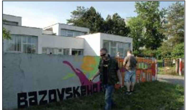
Trest povinnej práce funguje v komunitnom Centre rodiny na Bazovského.