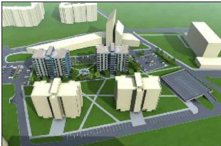
Plánovaný projekt náhradných bytov na ulici Na vrátkach. Stáť má na lúke, kde sa dnes chodí najmä venčiť.

Dobrou správou v súvislosti s výstavbou náhradných bytov je úprava verejného priestoru v okolí výstavby. Pri nových bytoch na ulici Pri kríži má tak vzniknúť detské ihrisko, pribudne aj upravená zeleň, aspoň