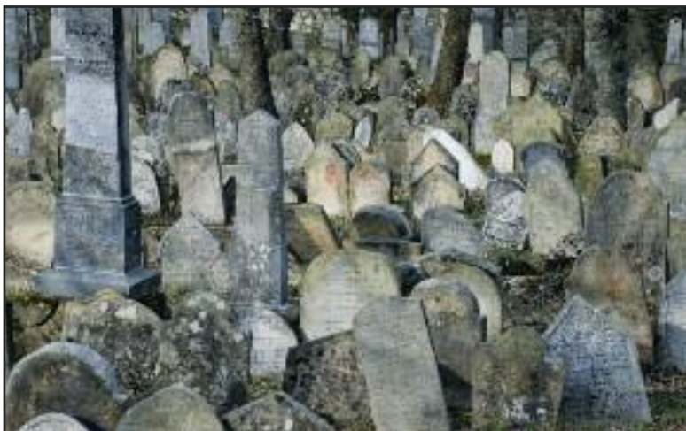
Židovský cintorín v Mikulove, patrí k najväčším v Českej republike.

Pešo aj bicyklom - Pri teplejšom počasí je oblasť Mikulov vhodná na turistiku po Chránenej krajinskej oblasti Pálava či cykloturistiku. Je tu dobre vybudovaná sieť cyklotrás, myslí sa aj na požičovne, stojany, opravovne. Bicyklom sa môžete vydať napríklad do neďalekých Valčíc. My sme nevynechali ani návštevu tohto barokového zámku, ktorý bol postavený v 18. storočí z pôvodného stredovekého hradu i tunajšieho zámockého sklepu s klenbovými chodbami so sudmi, starými lisami, potrubiami pre víno i sprievodcom, ktorý o víne na Morave rozprával tak, že ste museli ochutnať. Veď ako hovoril, na Južnej Morave sa kedysi pil silván miesto vody, ročne tu vraj človek vypil asi 140 litrov tohto bieleho vína.