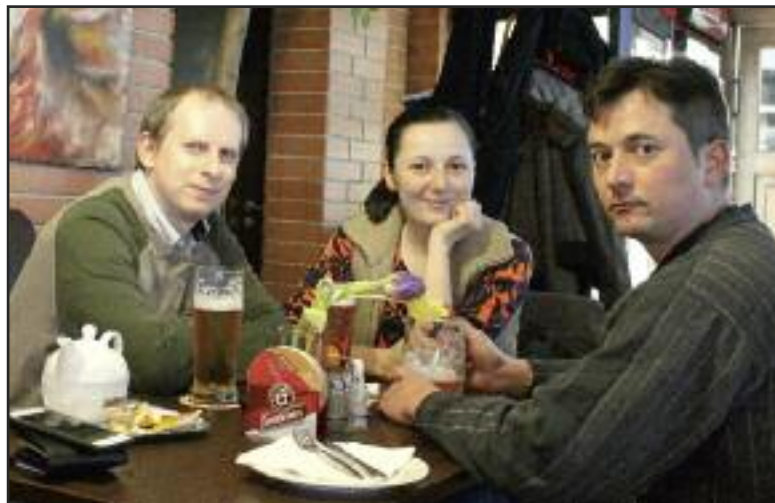
Súťažiaci museli prejavíť všestranné znalosti.

Kvízy budú pokračovať s mesačnou pravidelnosťou a o ich termínoch budú organizátori informovať na facebookových stránkach.