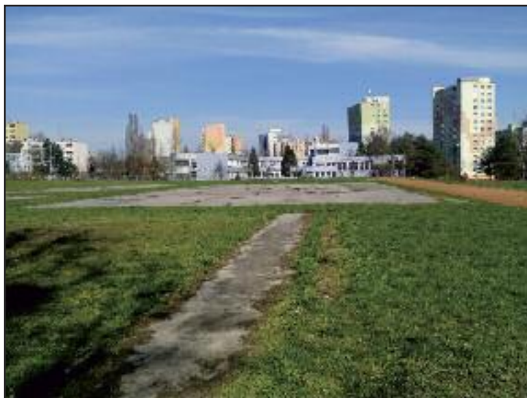
Bežecká dráha a ihrisko dnes. O obnove sa hovorí už roky.

Náklady na rekonštrukčné práce dosiahli výšku 166-tisíc eur s DPH z plánovaných 200-tisíc eur. Bratislavský samosprávny kraj uvažuje v budúcnosti aj o zateplení objektu.