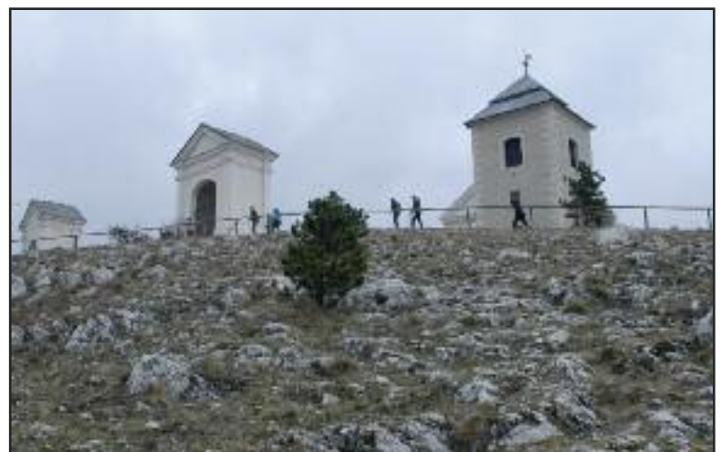
Pohľad na historický Mikulov (hore). Výstup na svatý kopeček (dole).