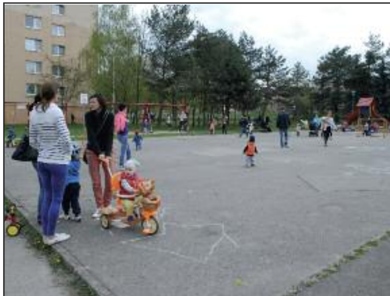
Ihrisko na Ožvoldíkovej by malo prejsť kompletnou rekonštrukciou. Mestská časť má pripraviť projekt.

„Viac nám rozpočet bohužiaľ nedovoľuje. V roku 2017 chceme presadiť, aby sa zrekonštruovali ďalšie dve a pripravili sa projekty na ďalšie, aby sme mohli čím skôr začať s rekon-