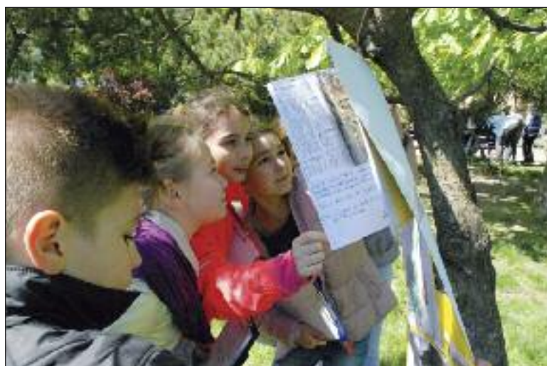
Náučný chodník v parku pri Základnej škole Beňovského v praxi, čiže s malými riešiteľmi úloh.