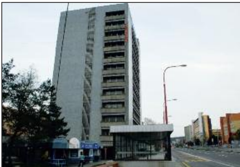
Ubytovňu chcelo ministerstvo opravovať ešte v roku 2008. Okolie kazia aj predajné stánky s alkoholom.