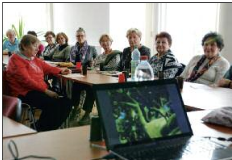
Tréning mozgu mal teoretickú aj praktickú časť. Trénovalo sa napríklad ako si zapamätať dlhý nákupný zoznam.