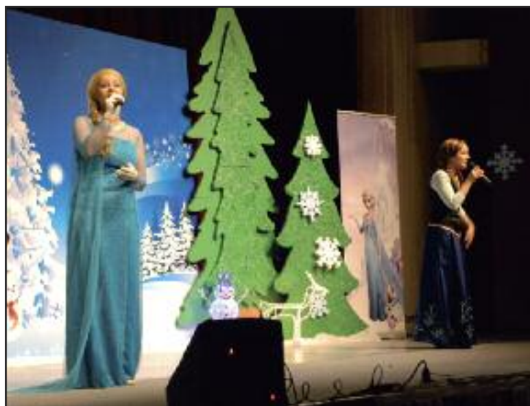
Na 22. mája o 17tej chystá reprízu.