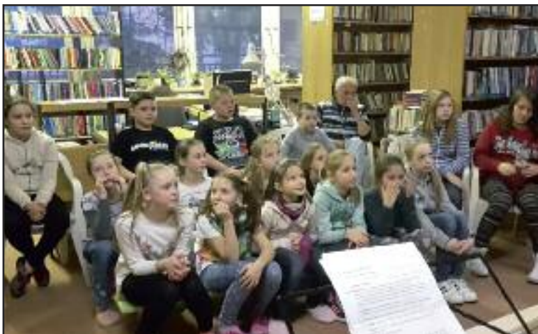
Program sa začal divadielkom.