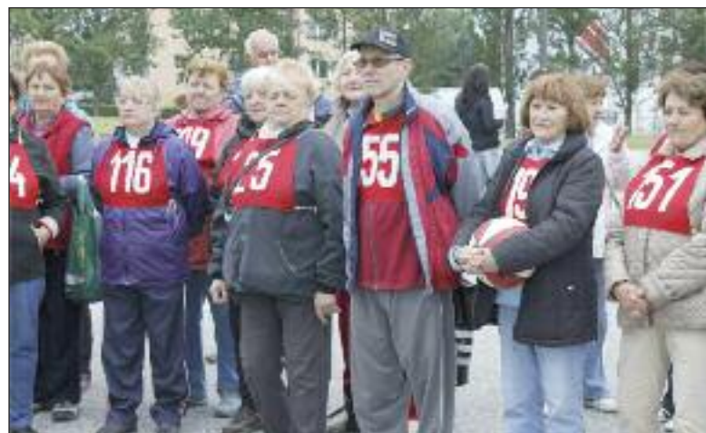
Pohľad na úšatníkov vlnajšieho ročníka Športových hier seniorov