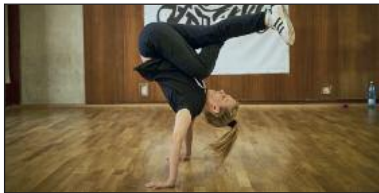
Tanečná Škola Breaku organizovala tábor v Dome kultúry Dúbravka.

Tradičný Letný tábor umeleckých remesiel, ktorý organizuje mestská časť v spolupráci s Bratislavským samoprávnym krajom prebiehal počas celého leta v ôsmich turnu-