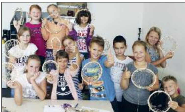
V letnom tábore umeleckých remesiel sa počas ôsmich turnusov vystriedalo takmer sto detí

a výtvarné techniky. Taktiež sa zoznámili s dejinami Dúbravky a jej samosprávou. (lum, luna)