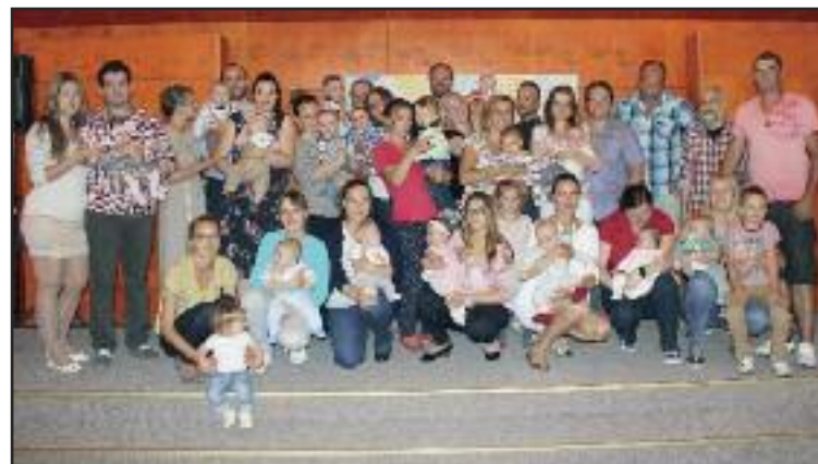
Privítaní najmenší s rodičmi.

Mestská časť organizuje pravidelne niekoľkokrát do roka takzvané Vívanie detí do života, venované je najmenším do jedného roka. Rodičia musia podať žiadosť na oddelenie sociálnych vecí a