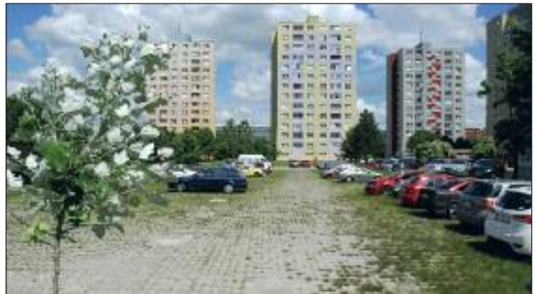
Objekt s bytmi má stáť na súčasnom neoficiálnom parkovisku.

Proti tomu sa odvolali obyvatelia z okolia, stavebný úrad v Dúbravke odvolanie postúpil na Okresný úrad, odbor výstavby a bytovej politiky. Ten