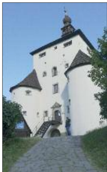
Nový zámok v Štiavnici je dnes múzeum.

Centrálna cesta ťahajúca sa centrom Štiavnice, ktorá po celej svojej dĺžke reprezentuje ulice Dolnú, ďalej Kammerhofskú, Andreja Kmeťa aj Antona Pécha, je obklopená reštauráciami, kaviarňami a klasickými kamennými obchodíkmi. Poskytnite