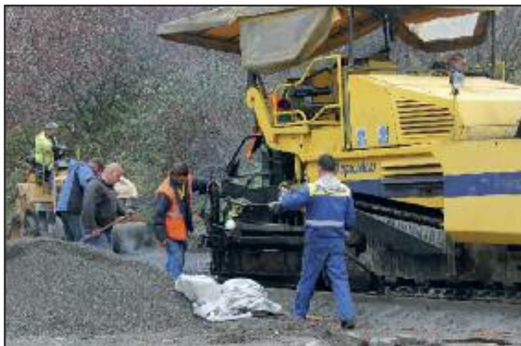
Mestská časť do obnovy ciest, chodníkov a parkovísk investovala viac než 100-tisíc eur.