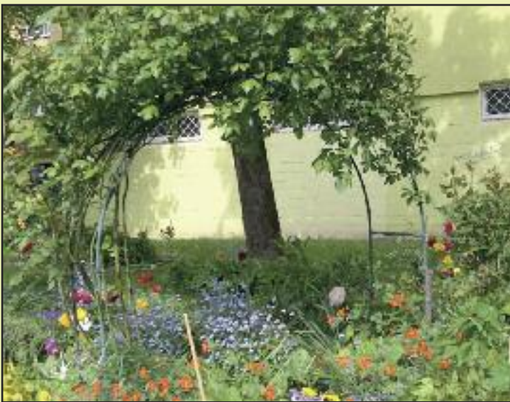
Upútala predzáhradka na Fedákovej.

Niektoré predzáhradky, ktoré nám brnkli do nosa alebo do očí, vám predstavíme aj v našich novinách. Ak ste videli aj vy nejakú zaujímavú, alebo sami predzáhradku tvoríte, nenechajte si to pre seba, fotky a informácie posielajte na: tlacove@dubravka.sk