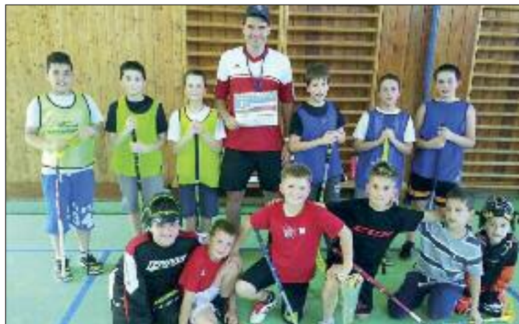
Tréningy prebiehajú v školských telocvičniach.

Organizátorom bolo mesto Košice, florbalový klub Florko Košice. Majstrovstiev sa zúčastnilo 12 družstiev z celého Slovenska. Boli sme vylosovaní do dvoch skupín po šesť tímov, hralo sa každý s každým, bol to dvojdňový víkendový turnaj. Vyhrali sme všetky zápasy v skupine, potom semifinále so Skalicom 8:6 a vo finále sme zdolali Dolný Kubín, naozaj kvalitné družstvo, ktoré nás zaskočilo, prehrávali sme po prvej tretine 4:0.