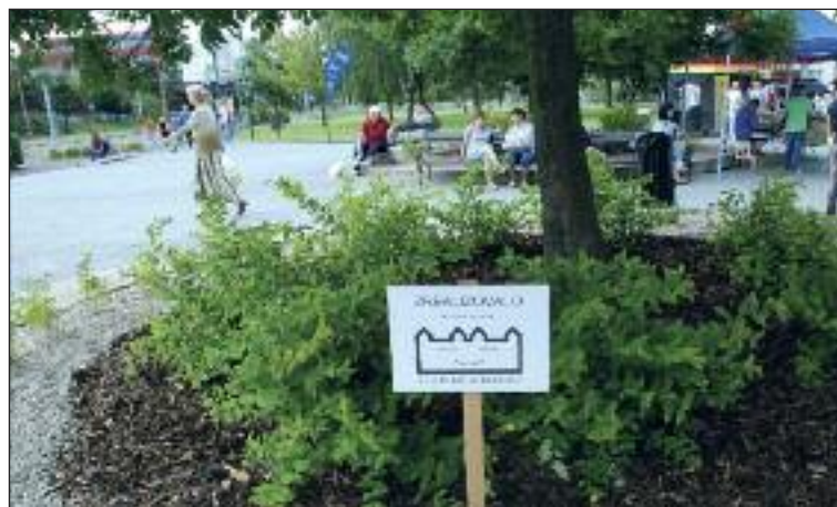
Upravená zeleň pred kultúrnym domom.

zovalo Občianske združenie Človek a mesto prezrádza, že ide o dokončený projekt združenia. Vysadili nové rastlinky v dvoch kruhoch pred domom kultúry.