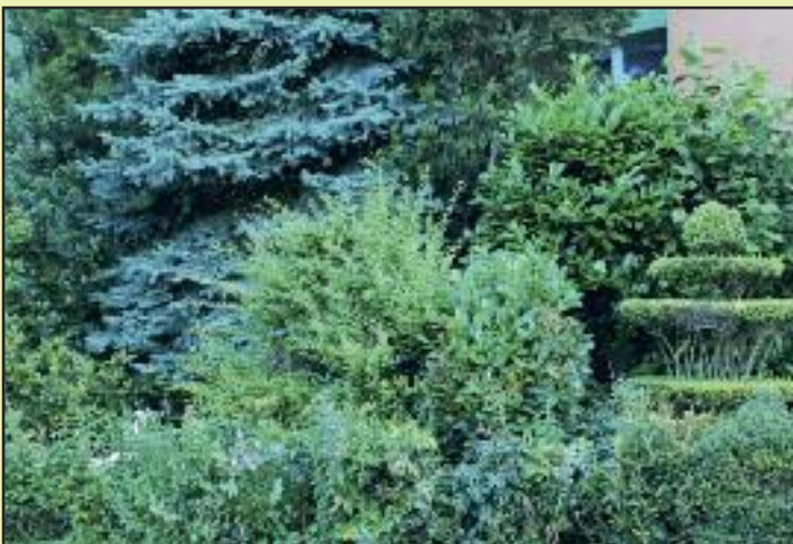
Upravená predzáhradka pána Minaříka na Pekníkovej, okrem úprav lákajú najmä kvety a ruže.