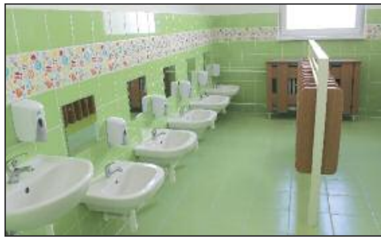
Zrekonštruované kúpeľne v Materskej škole Ušiakova už slúžia deťom.