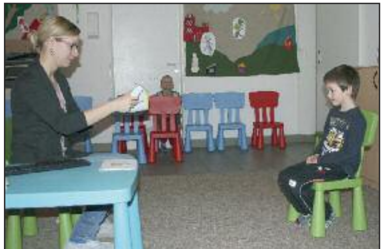
Prehliadka zraku u detí v Materskej škole Bazovského.

Prehľadli sme deti, ktorých rodičia podpísali informovaný súhlas o prebiehajúcom preventívnom meraní. Výsledky 35 detí dosahovali hodnoty, ktoré si už vyžadujú odbornú oftalmologickú starostlivosť, preto im naši vyškolení pracovníci vystavili odporúčanie na podrobnejšie vyšetrenie u detského očného lekára. Podmienky tohto programu v každom smere zohľadňujú vek detí. Aby sme odbúrali stres z nového prostredia a eliminovali syndróm bielych plášťov, tieto merania sme uskutočnili priamo v materských školách, teda pre deti známom prostredí. Ani samotný prístroj nie je strašiakom-meranie je rýchle (trvá pár sekúnd), neinvazívne, bezdotykové, bezbolestné a bez akýchkoľvek vedľajších účinkov či