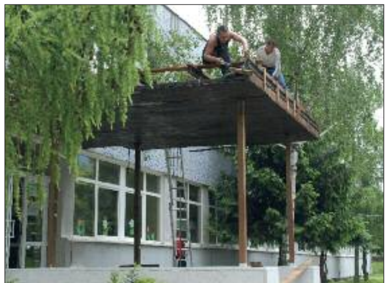
Oprava vstupu do Základnej školy Pri kríži.