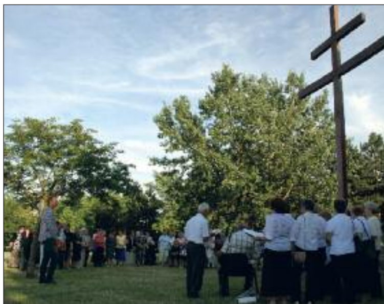
Letný podvečer pri dvojkríži.