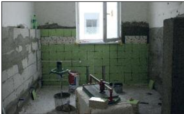
Počas júla prebiehala rekonštrukcia kúpeľní v Materskej škole Ušiakova.