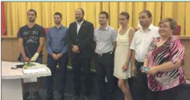
Medzi ocenenými boli aj Dúbravčania.