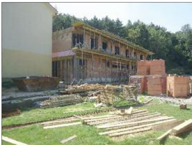
Nová administratívna budova so šatňami utešene rastie. Snímka je z polovice augusta.