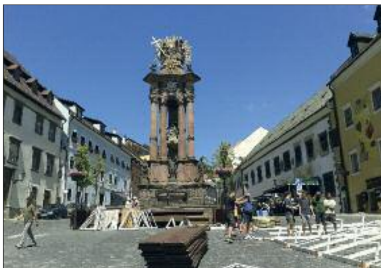
Námestie sv. Trojice v srdci Banskej Štiavnice.

rôznych metódach, ktoré sa v minulosti používali na získavanie zlata a striebra, ale tiež pikošky zo života baníkov.