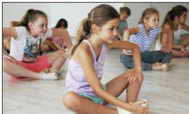
Tábor Tanečnej školy La Portella bol samozrejme o pohybe, cvičení a tanci.