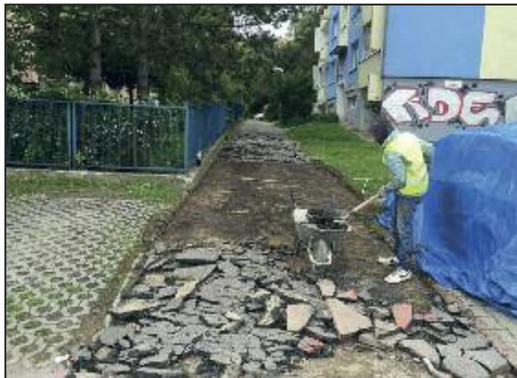
Oprava zničeného chodníka pri Materskej škole Pri križi.

Rozpočet zaťažujú aj krádeže kanalizačných a šachtových poklopov, ktoré musí mestská časť ako správca ciest 3. a 4. triedy po zmiznutí zabezpečiť, aby sa predišlo úrazom. Dúbravka ich v súčasnosti už nahrádza