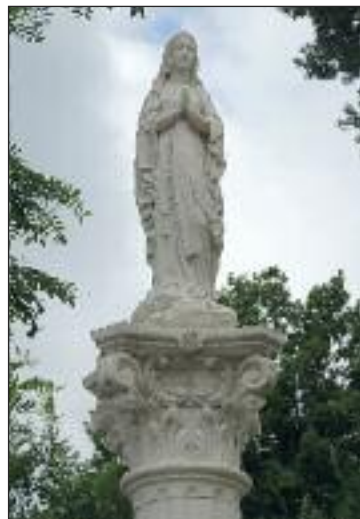
Zreštaurovaná socha Panny Márie.

Reštaurovanie sochy prebehlo na katedre reštaurovania Vysokiej školy