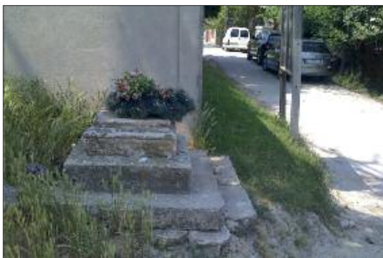
Od roku 2013 bol na Tavarikovej osade len prázdny podstavec.

Takmer po troch rokoch sa podarilo vrátiť na svoje miesto sochu Panny Márie.