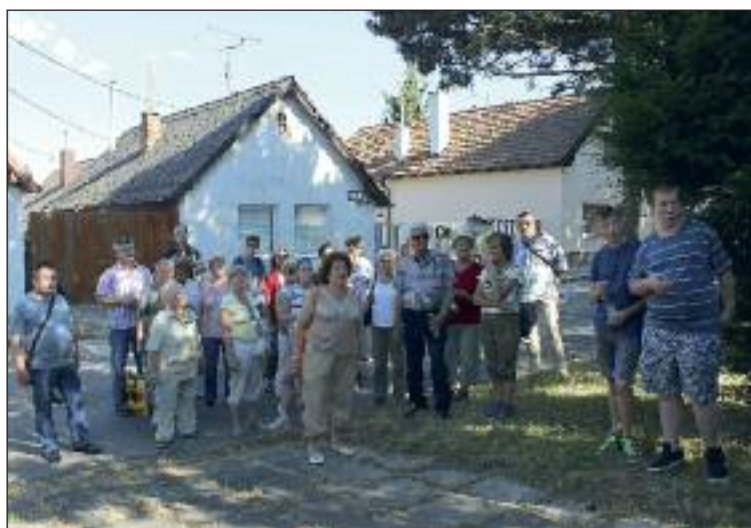
Na poznávačke v starej časti Dúbravky.

Prínosom tejto letnej exkurzie, z ktorej sa stáva už pomaly tradícia je, že Dúbravku prichádzajú spoznávať aj obyvatelia iných častí mesta. (ks)