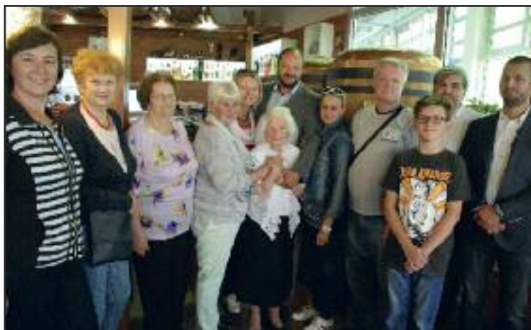
Spoločná fotografia s oslávenkyňou (v strede v bielom) a gratulantmi.