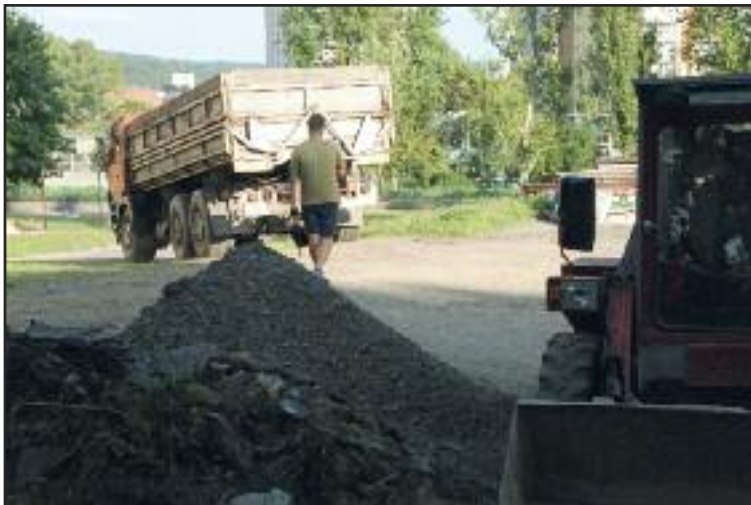
Obnova schátraného ihriska na Valachovej.