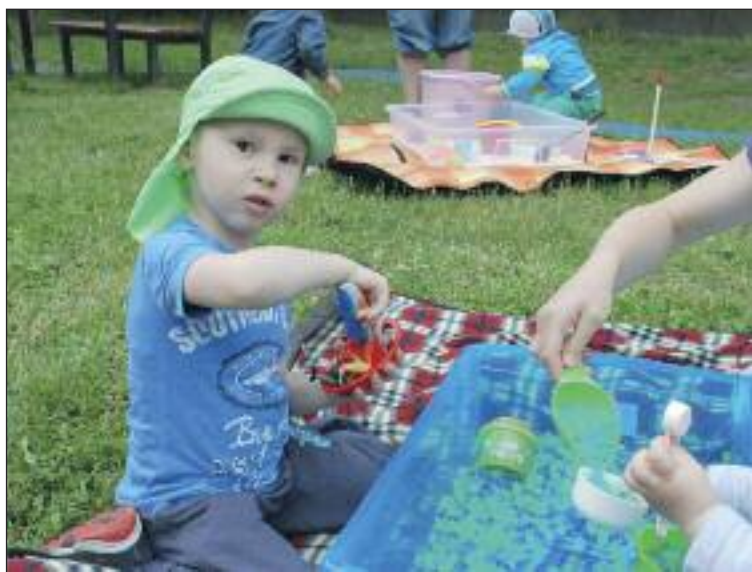
Uhádnete z čoho je more slizkých guličiek? Dá sa jednoducho vyrobiť z pomôcok pre kvety.

Rodinné centrum Macko spestruje leto deťom programami v Macko záhrade. Program v priestoroch centra sa začína od septembra.