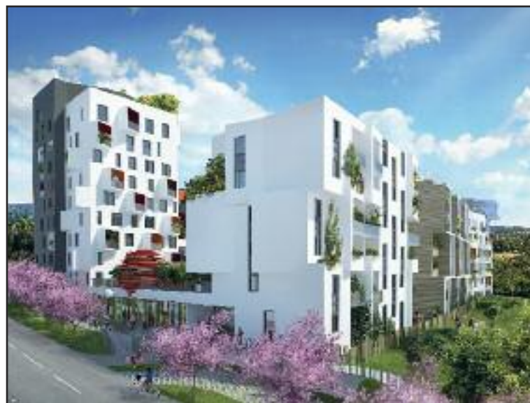
Vznikajúci projekt Čerešne na Poliankach.

vnútroblok, a v ňom spoločný dvor. Kde budú situované detské ihriská a komunitné záhrady, ale aj exteriérový pavilón, ktorý budú môcť využívať obyvatelia komplexu na oddych a aktívne trávenie voľného času. Jednotlivé domy sú zámerne individualizované, takže vlastníci si okrem polohy v bloku vyberajú aj vonkajší vzhľad nového domova. Čerešne sú zasadené do vhodnej lokality, ktorá profituje z umiestnenia v tichom a zelenom prostredí, ale s dobrým dopravným napojením na diaľnicu. V jeho pešej dostupnosti sa nachádzajú komplexné služby - od škôl, škôlok cez supermarkety až po plaváreň či zimný štadión. Developerom projektu je ITB Development a.s., ktorá stojí za viacerými inovatívnymi a oceňovanými projektmi v Bratislave. (PR reklama)