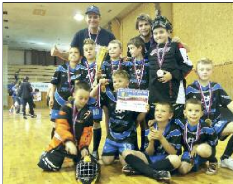
Malí Majstri Slovenska po víťazstve nad Dolným Kubínom.

Na vašej stránke hovoríte o rozdelení, akýchsi modeloch tréningov. Platí stále rozdelenie Galaktikos