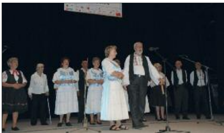
Naša Dúbravanka prišla s vlastnou piesňou.