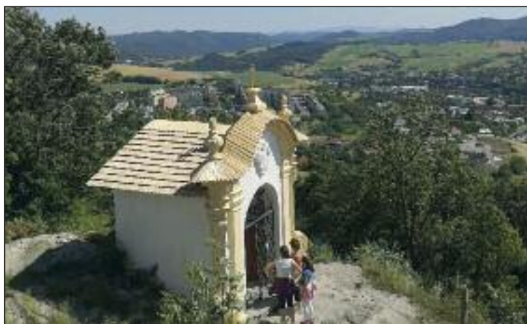
Kalvária nad mestom - zastavenie. Dokopy je ich 25.

Povrchové expozície banského skanzenu je možné si pozrieť kedykoľvek v rámci otváracích hodín, do podzemnej časti sa však odporúča si lístok vopred rezervovať, nakoľko vstup je z bezpečnostných dôvodov len v sprievode lektora a počet účastníkov je limitovaný. Tu sa dozviete zaujímavosti o baníctve,