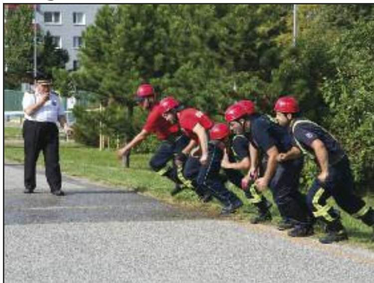
Dúbravskí dobrovoľní hasiči v akcii. Nie pri zásahu, ale pri súťažení.