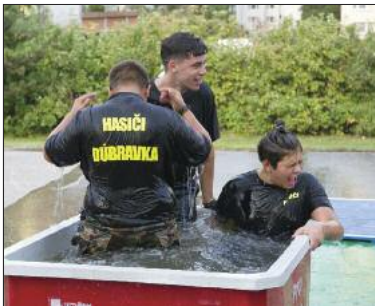
Takto sa dúbravskí hasiči chladili počas horúceho dňa.