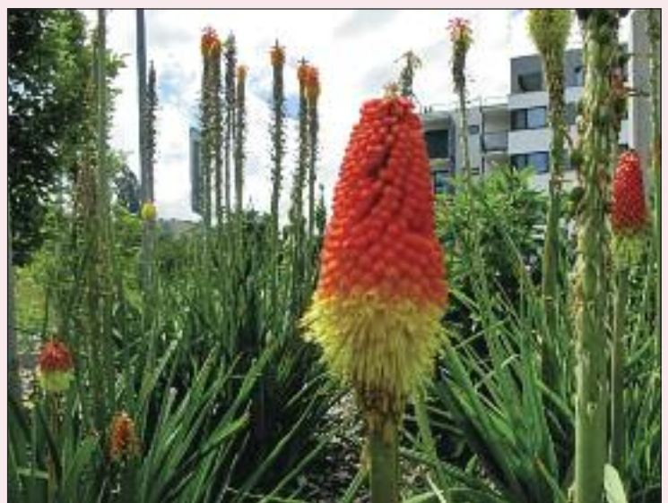
Trošku exotiky na ulici Martina Granca.