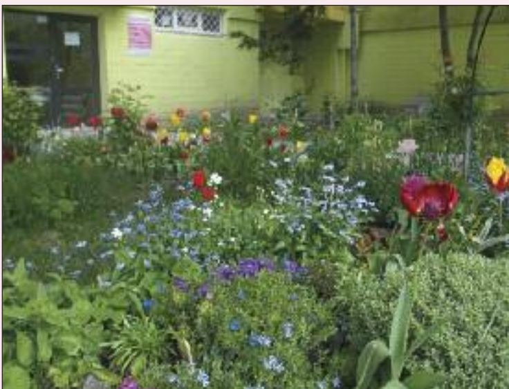
Farebná predzáhradka na Fedákovej.

ktoré vám v našej Dúbravke padli do oka. Dakujem vám a samozrejme tvorcom týchto záhradiek. Ak ste videli vy nejakú zaujímavú, alebo sami predzáhradku tvoríte, nenechajte si to pre seba, fotky a informácie posielajte na tlacove@dubravka.sk