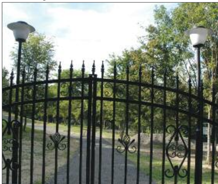
Brána ešte nefungujúceho cintorínu pre zvieratá.