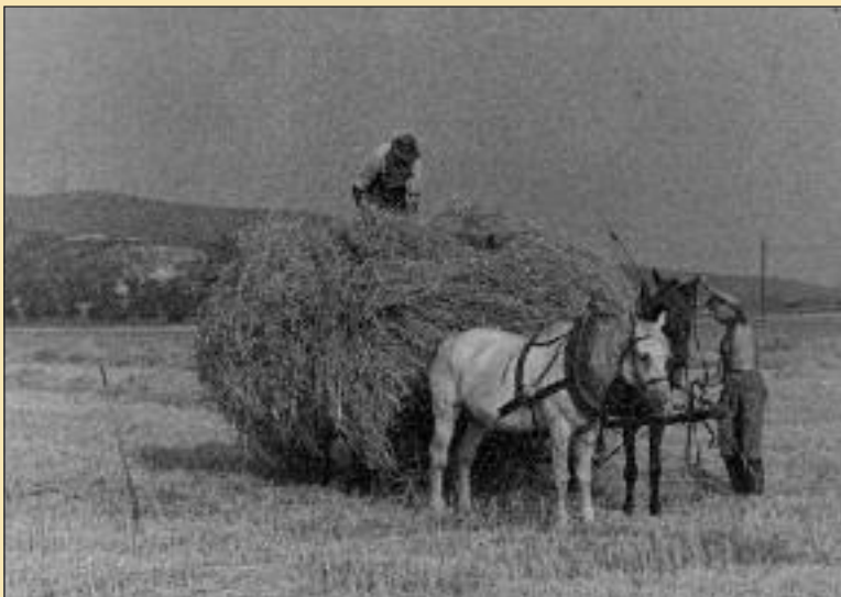
Zväžanie obilia k mláťačke.

dzalo veľa mladých i starých zo susedných obcí, Lamača, Devína, Novej Vsi, Záhorskej Bystrice a Karlovej Vsi. Hody vraj bývali veselé a neraz sa počas nich strhli aj bitky. Podľa pamätníkov raz dokonca jedného „prespolného“ chceli spustiť aj do Horanskej studne, lebo prejavoval príliš okatý záujem o miestne dievčence. Ino-