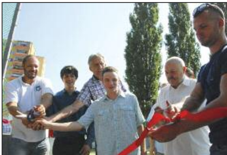
Ihrisko slávnostne otváralo vedenie mestskej časti a známi športovci Dúbravky.