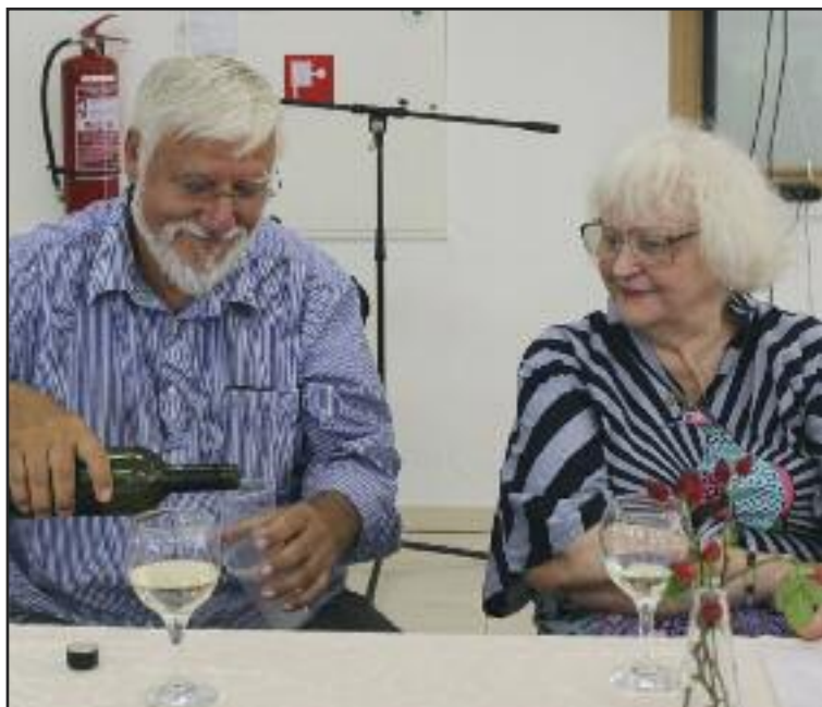
Pohár vína na zdravie a hudbu na dobrú náladu. Na podujatí v Domove Pri kríži.

zorganizovalo zariadenie. Už názov napovedal, že akcia bola o víne, okrem neho však ochutnávali aj lokše a iné dobroty. O zábavu sa postarala aj ľudová hudba Kuštárovci. Poobedie sa nieslo v príjemnom duchu, seniori spievali, smiali sa a zabávali. (zm)