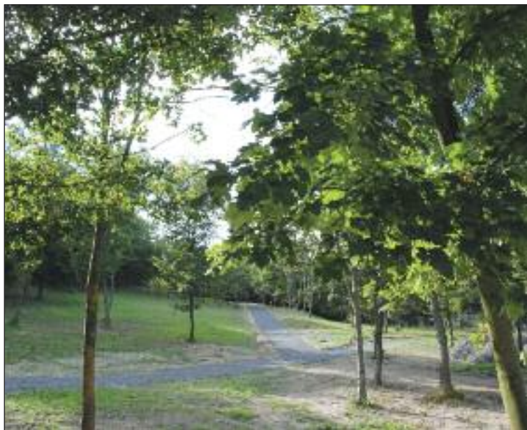
Cintorín Borievka dnes, vyzerá ako upravený lesopark.

Cintorín Borievka by mal mať kapacitu asi 6-tisíc hrobových miest a miesta by sa mali prenajímať na päť rokov. Cena nie je presne daná, za prvých päť rokov by sa mala pohybovať okolo 250 eur, potom v prípade záujmu sa dá prenájom miesta predĺžiť a suma bude nižšia. Závisieť bude podľa Vlkoviča od veľkosti pochovaného zvieratka a služieb,