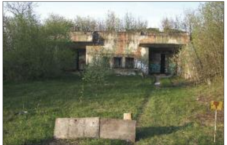
Raketová základňa medzi Devínom a Dúbravkou postupne chátra.

Pri vstupe nás dnes víta otvorená brána a trojposchodové kasárne. Na tejto budove sa už stihol podpísať zub času ako aj vandali. Okrem porozbíjaných okien či povytřha-