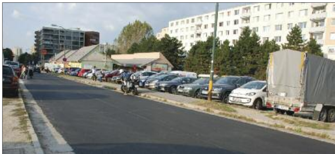
Trhová ulica už má nový povrch.