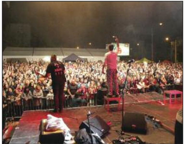
Polemic roztancoval v sobotu večer Dúbravku.