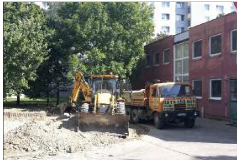
Ako prvé začali vznikať nové parkovacie miesta na Ožvoldíkovej.