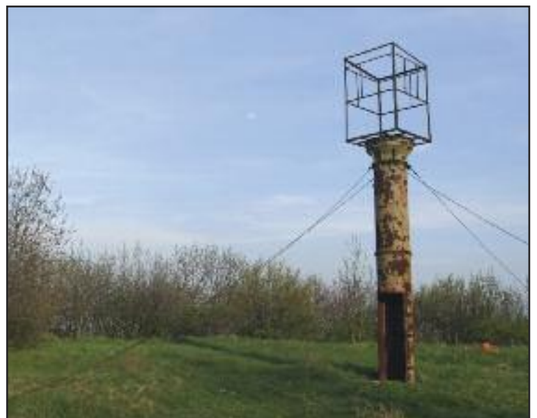
Vyhliadková veža základne.