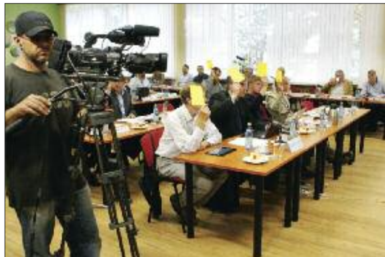
Kompletný záznam z 10. zasadnutia miestneho zastupiteľstva nájdete na stránke Dúbravskej televízie.

Karola Adlera Športovému klubu PKO Jagermajster Dúbravka. Tanečníci tu pôsobia už roky, končila im však nájomná zmluva. Poslanci schválili predĺženie nájmu na 10