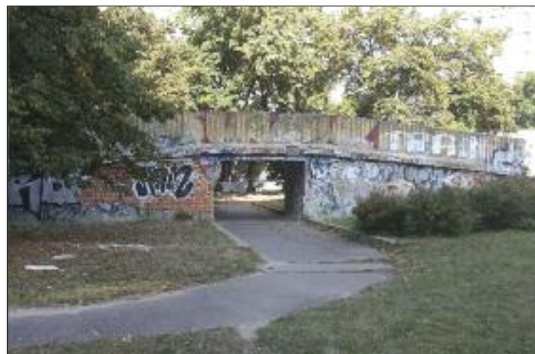
Chátrajúca dráha na Ul. Karola Adlera sa bude búrať.

Dúbravskí poslanci rokovali aj o nájmoch pozemkov, garáží či priestorov. Bez pripomienok schválili nájom nebytových priestorov na ulici