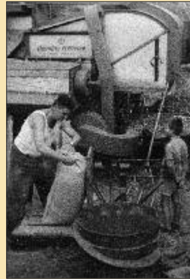
Komisár váži obilie, aby bolo možné určiť povinné odvody štátu - kontingent

Niekedy si pozývali dychovku z Devínskej Novej Vsi. Na svadbách hral najčastejšie harmonikár s bubnom.