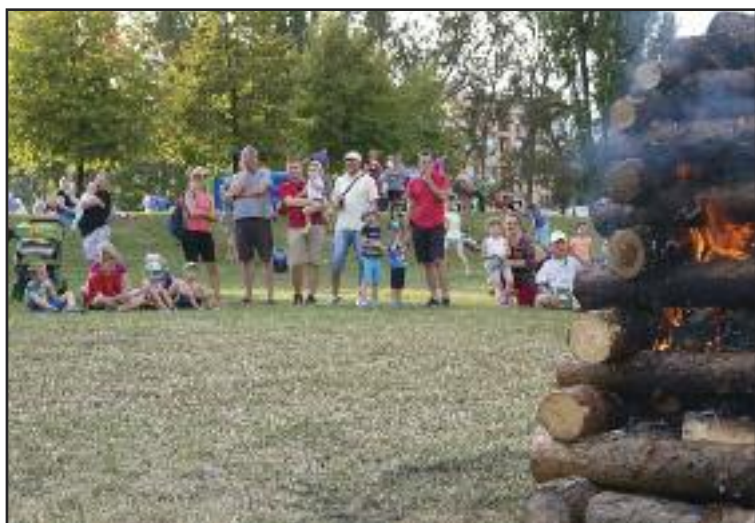
Symbolické zapálenie vaty bolo súčasťou pripomienky výročia SNP.