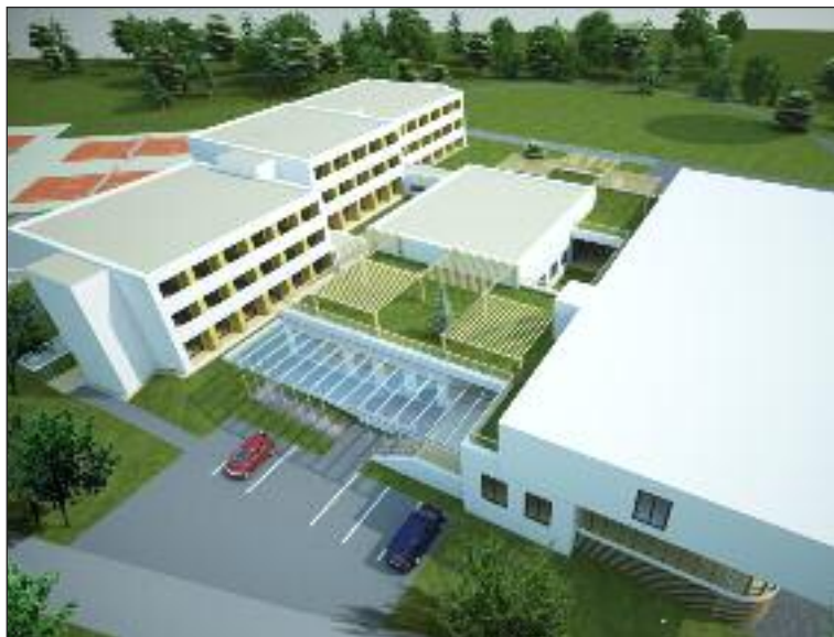
Plány na premenu komplexu pod Devínskou Kobylou.