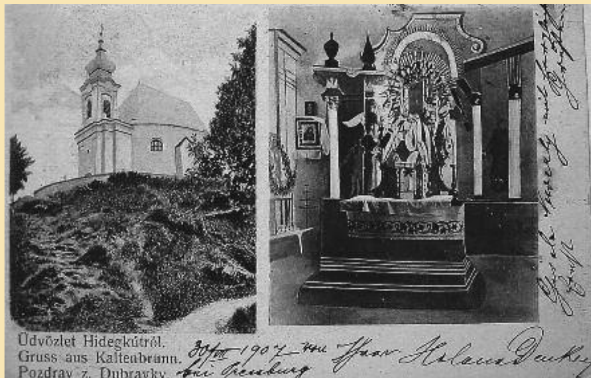
Údvôzlet Hidegkútrál. Gruss aus Kaltenbrunn. Pozdrav z. Dúbravky.

Záznam vznikol 18. októbra 1810, čiže v čase, keď už v Dúbravke pôsobil vôbec prvý farár Ignacius Navrátil (parochus 1807 - 1825).