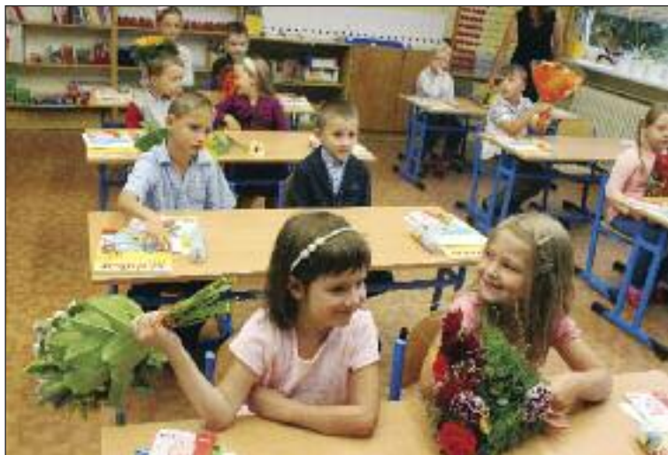
Dúbravka tento rok dokopy privítala 297 prváčikov v štyroch základných školách.