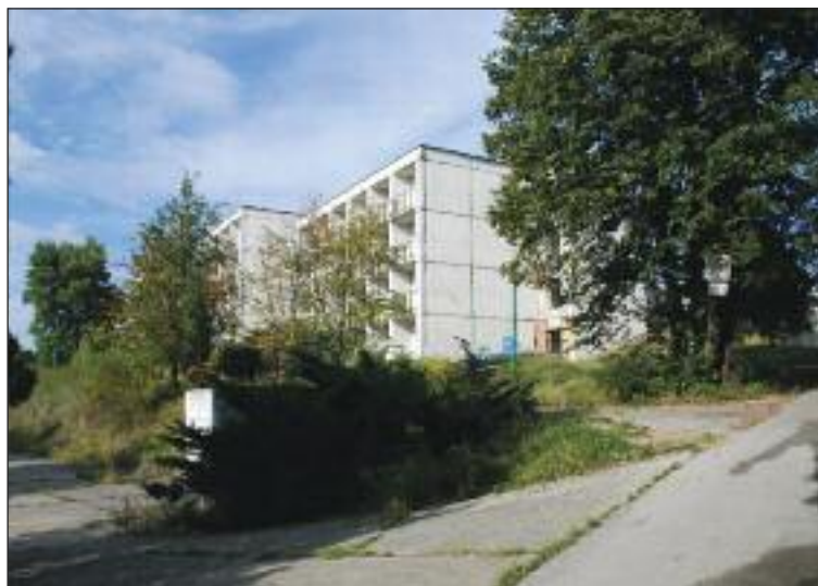
Bývalý hotel Alfonz nefunguje už roky, postupne chátral.

V tejto časti plánuje investor vyčleniť časť jedálne ako bufet na drobné občerstvenie pre návštevníkov, okoloidúcich, turistov. Pre širšie spektrum ľudí, firmy, záujemcov, by