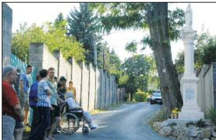
Socha Panny Márie po rekonštrukcii opäť tvorí symbol Tavarikovej osady.

Poodhalil a pripomenul Tavarikovu osadu bez áut, kde v dúbravských