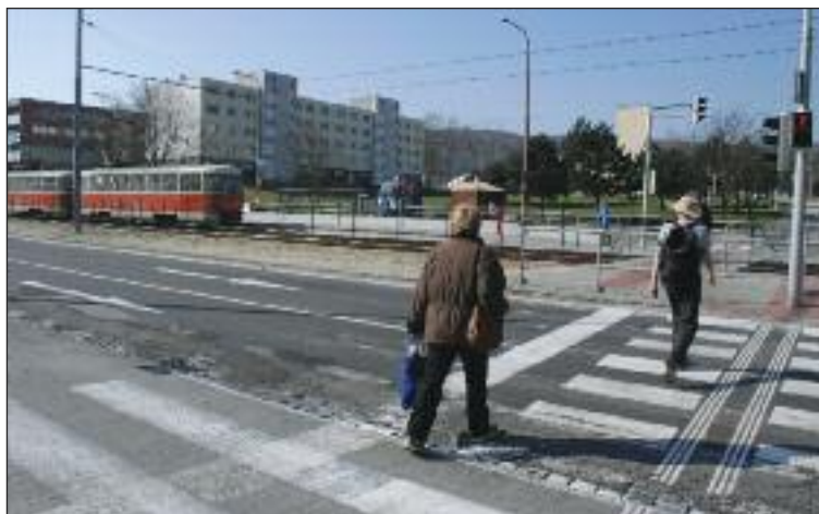
Na trati pribudli po modernizácii semaforey.

2. Literárno-mediálna súťaž pod názvom Vylepšíme verejnú dopravu v Dúbravke pre druhý stupeň základných škôl. Navrhnuť riešenie verejnej dopravy v Dúbravke.