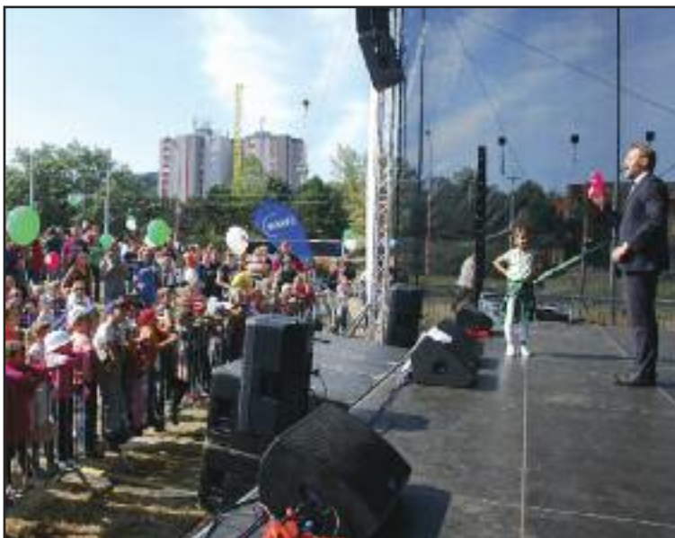
Sobotné dopoludnie patrilo deťom - tancu aj kúzelníkovi.