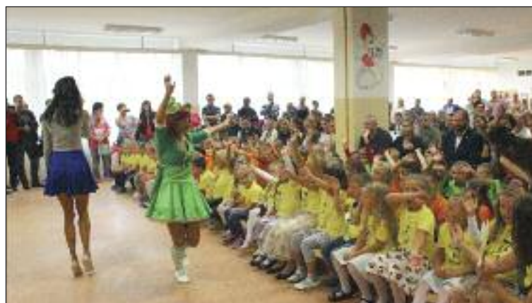
Prvý školský deň bolo na ZŠ Nejedlého veselo.