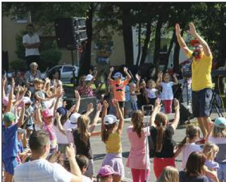
Spevák Miro Jaroš prilákal davy, hity ako "Rúčky" či "Zúbky" spievali deti aj ich rodičia.