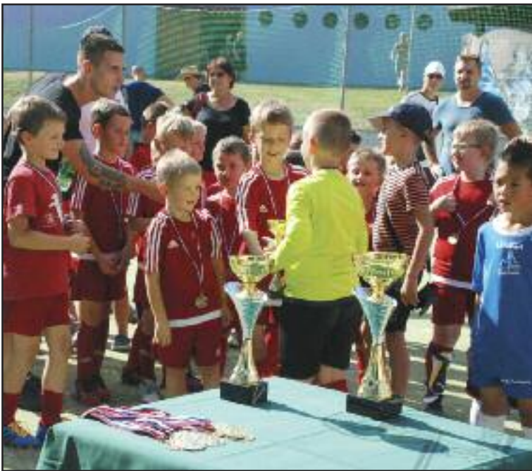
Prvý turnaj na novom ihrisku si zahráli chlapi z Dúbravky i okolia. Vyhrál Fkp Dúbravka.