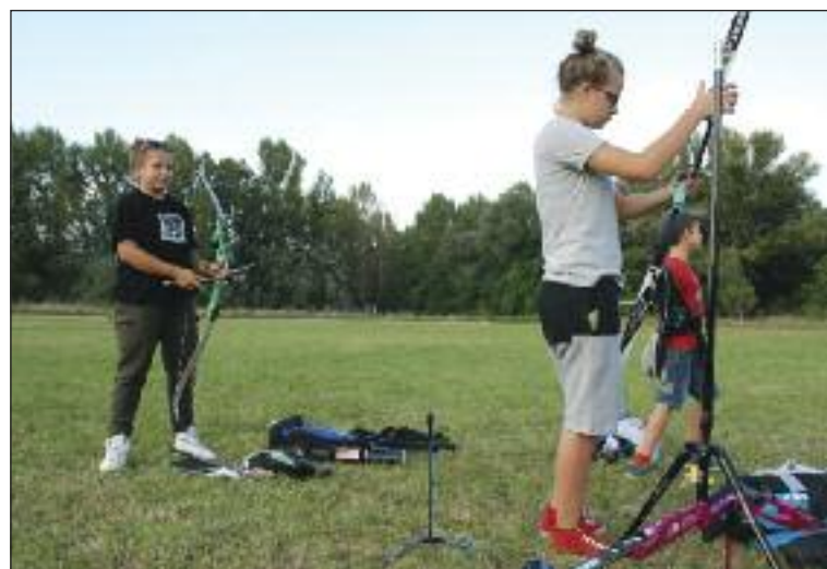
Príprava pred tréningom na trávnom ihrisku pri štadióne.

Je Dúbravka jediné miesto, kde sa dá v Bratislave trénovať lukostreľba?