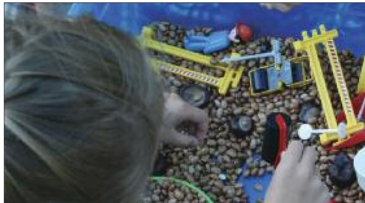
Aktivity v RC Macko v Monte štýle.