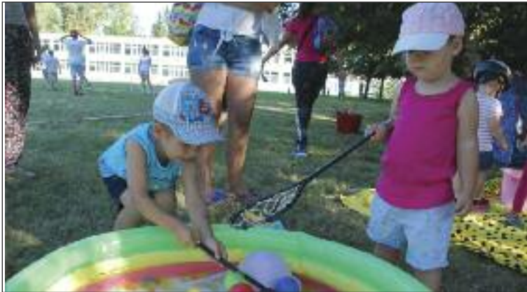
Veget KC Christiana trval tri dni, aktivity odštartovali novú sezónu.