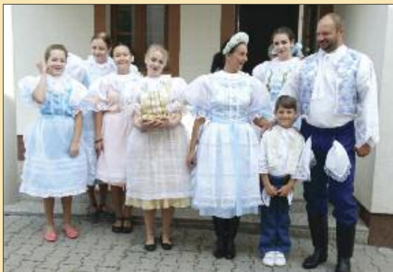
Krojovaní Dúbravčania pripravení do hodového sprievodu na nádvorí múzea.