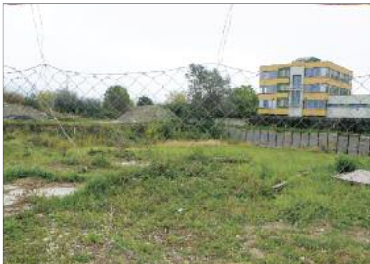
Prázdny pozemok stavebnej jamy na križovatke ulíc Na vrátkach a Nejedlého.

Projekt Mamapapa vyrastie v severovýchodnej časti Dúbravky na križovatke ulíc Na Vrátkach a Nejedlého. Pozostáva zo 115 bytov, 5 apartmánov a rodinného centra o