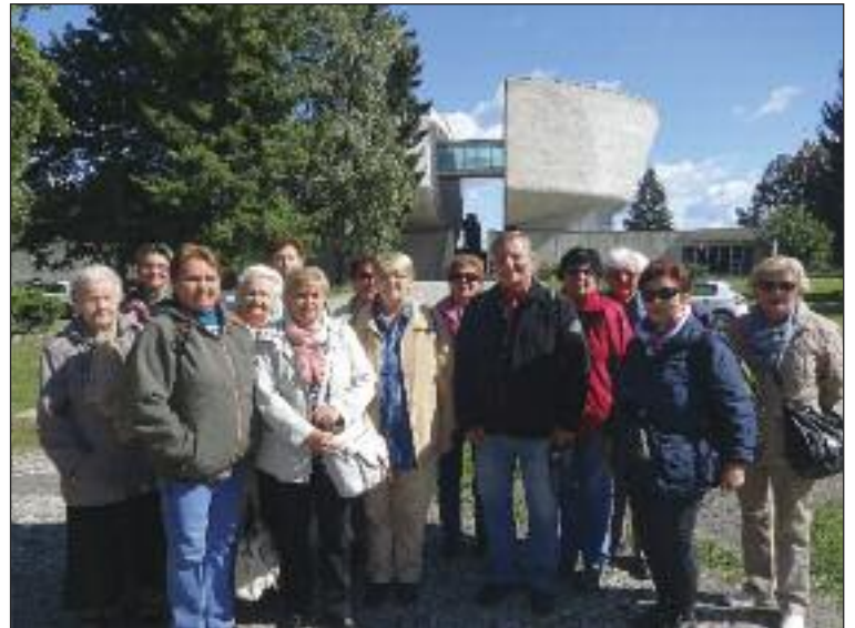
Dúbravskí seniori pri pamätníku SNP.