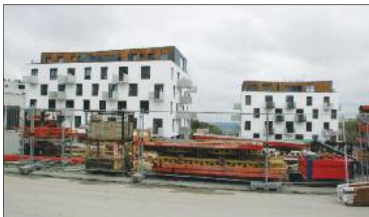
Výstavba Záhradných vil na konci Dúbravky.