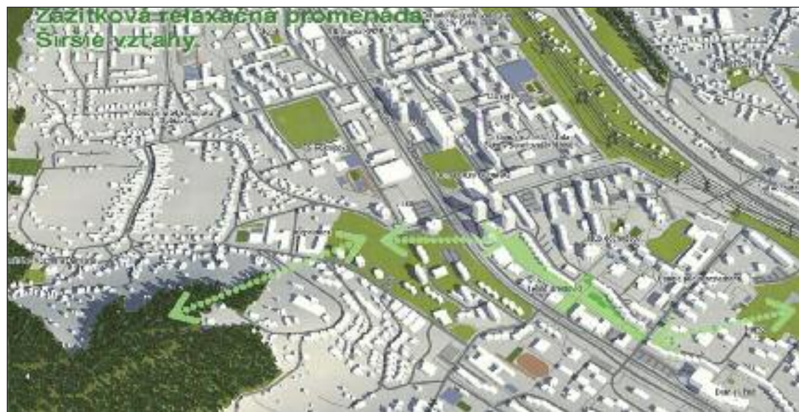
Naznačenie pešej zóny v priestore Dúbravky. Architekt naznačuje prepojenie zelene.