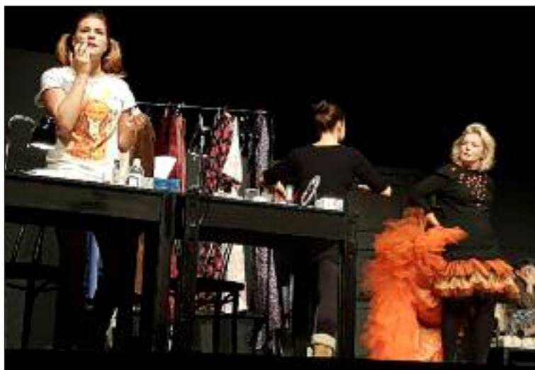
Dámska šatňa na javisku kultúrneho domu.