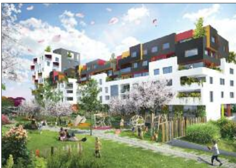
Vizualizácia projektu Čerešne.