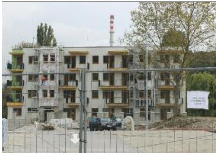
Pri kúpalisku Rosnička vyrastá Bytový dom pri Rosničke.

„Tvarovaním objektu vzniklo v úrovni prízemí súkromné átrium s