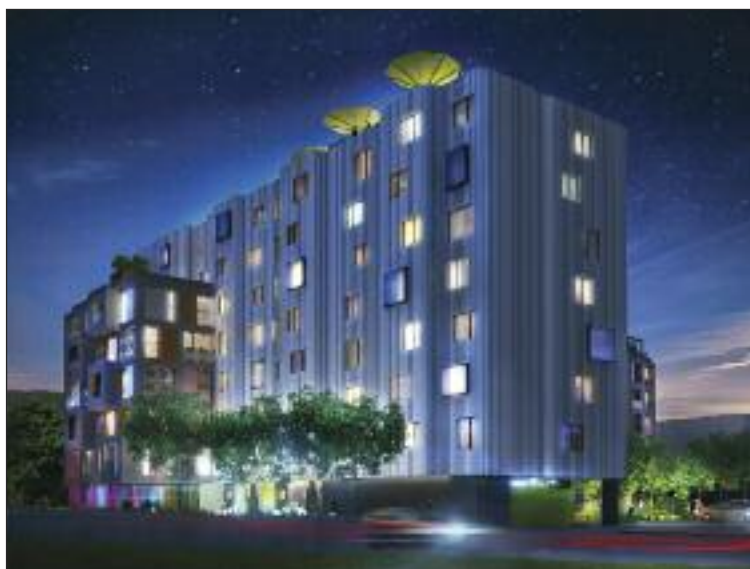
Vizualizácia projektu MAMAPAPA.