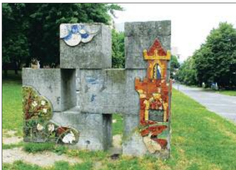
Ján Šicko: Detská preliezka. Dielo pri pešej zóne potrebuje obnovu.