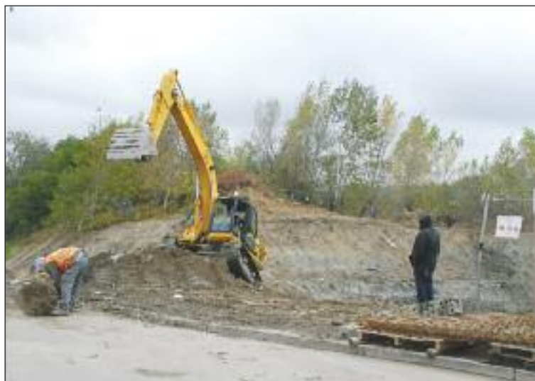
Práce v súvislosti s projektom Pečná vyhlídka.