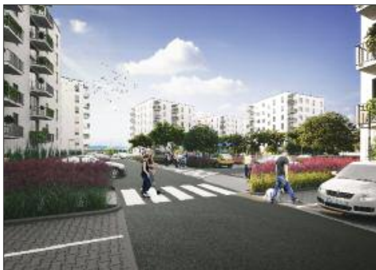
Vizualizácia. Projekt Dubrawy.