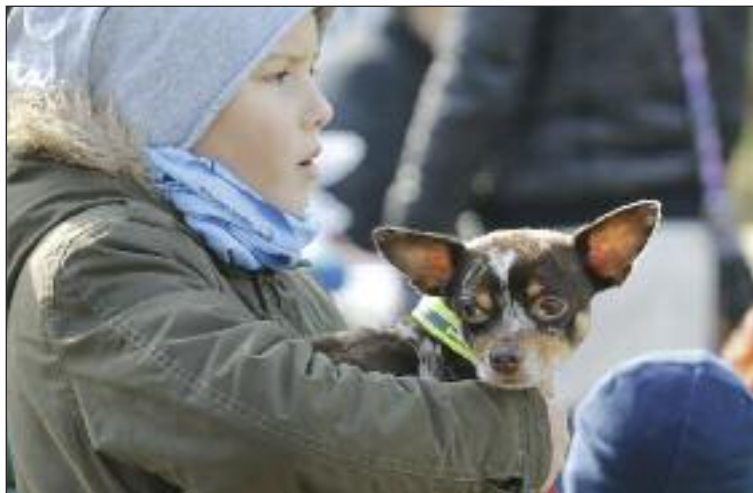
Hľadal sa NAJ pes, pre každého psičkára je ten NAJ pes ten jeho.