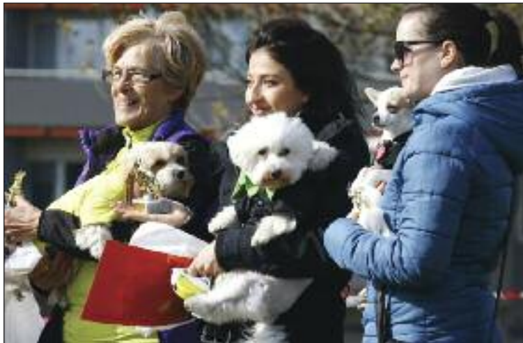
V rámci súťaženia sa hľadal aj najlepší oblečený pes.