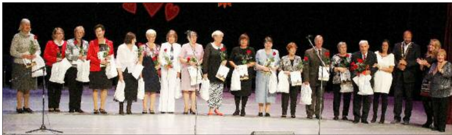
V rámci galavečera bolo ocenených 15 najaktívnejších dúbravských seniorov.