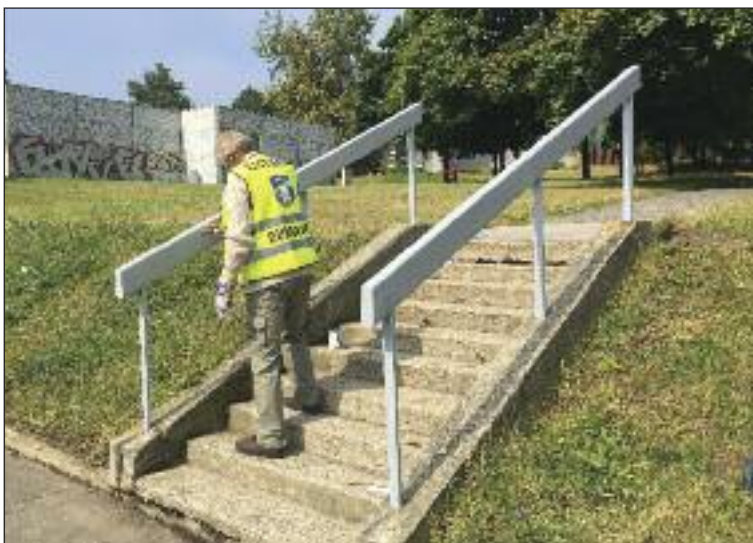
Ľudia bez domova nielen čistili, ale aj natierali.

Benefity za vykonanú prácu pozostávali z príspevkov na zabezpečenie základných potrieb, ako sú nocľah a strava, prípadne prostriedky na vybavenie si dokladov. Za päť mesiacov trvania projektu sa uskutočnilo 21 upratovacích a čistiacich akcií, do ktorých bolo zapojených 67 klientov z Nocľahárne sv. Vincenta de Paul.