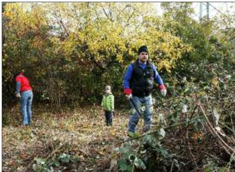
Práce v komunitnej záhrade sa začali v októbri minulého roka.