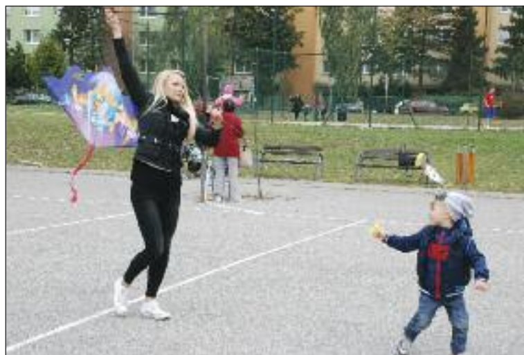
Šarkany zabavili malých aj veľkých.