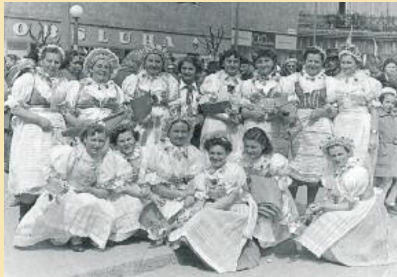
Novšiu formu ľudového kroja zachytáva fotografia skupiny dúbavských žien po druhej svetovej vojne.

premeny už celkom ukončené a kroj sa uplatňuje iba pri špeciálnych slávnostných príležitostiach. Premeny postihli aj domácnosti, v ktorých sa na konci 19. a na za-