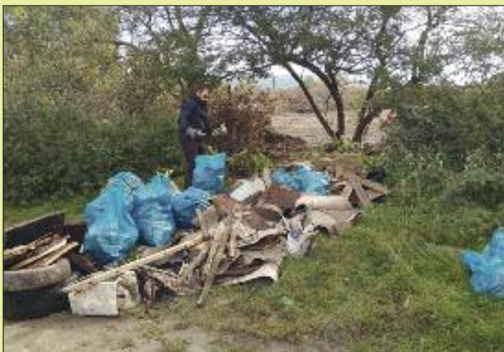
Čistenie na Agátovej, čierne skládky sa sem vracajú.

Text a foto: Tomáš Husár, miestny poslanec, dobrovoľník