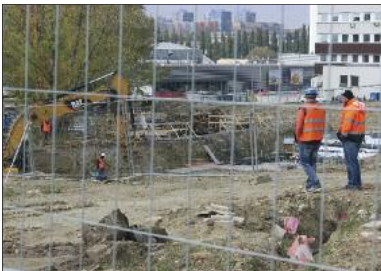
Stavba na Poliankach. Vyrastajú tu Čerešne.