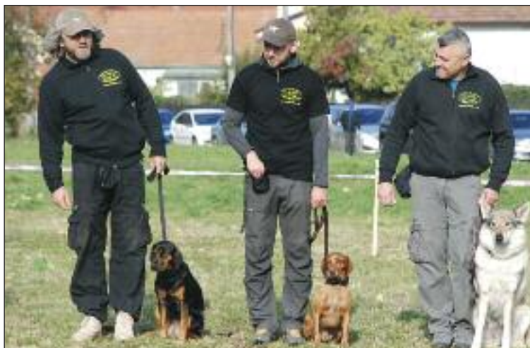
Ukážky výcviku psov od Športového klubu policajnej kynológie.