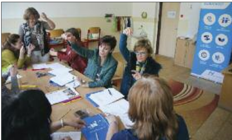
Workshop učiteľov alebo zoznamka s technickým vyučovaním.