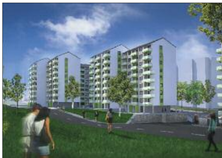
Vizualizácia projektu TUJETOIN.

výsadbou zelene a detským ihriskom pre najmenších.