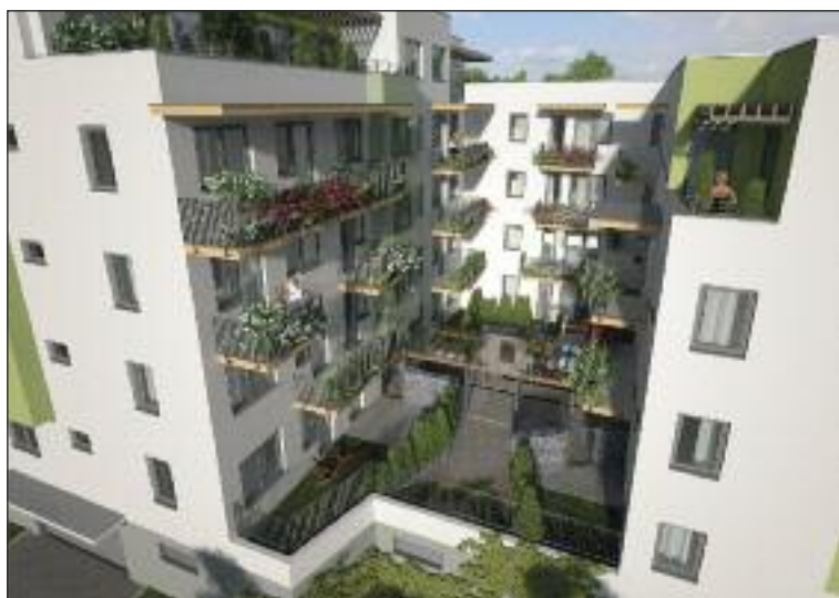
Vizualizácia projektu pri Rosničke. Byty sú už predané.