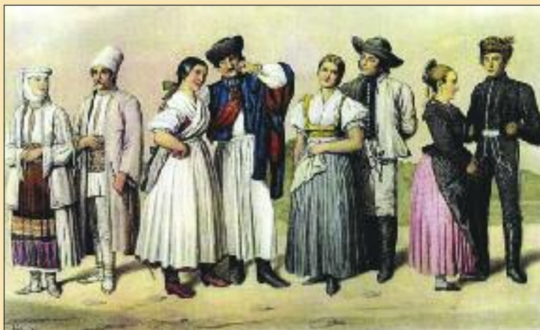
Rumunský, maďarský, slovenský a nemecký krojovaný pár. Kroje dúbravských Chorvátov a Slovákov sa od seba príliš neodlišovali.

Pôvodne sa deti obliekali do ľudového odevu, ktorý bol zmenšenou podobou odievania dospelých.