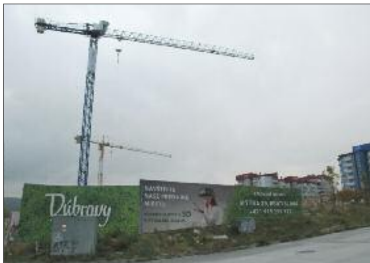
Obytný súbor Dúbravy začal s výstavbou podzemných garáží.

Ďalším stavebným projektom pri OC Dubrawa na Hrubej lúke neďaleko novostavieb Tammi je Obytný súbor Dúbravy. Ide o projekt šesťposchodových domov spoločnosti W Residence, prebieha hĺbenie podzemnej garáže a následne má začať výstavba štyroch