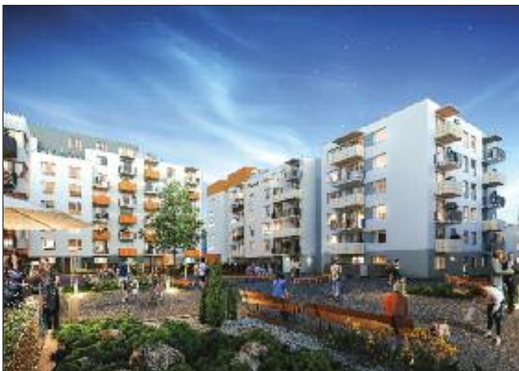
Vizualizácia. Tammi vyrastá na etapy, pokračovať má piatou a šiestou etapou.