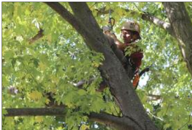
Bezpečnostné orezy na ihrisku materskej školy.

Úrad prioritne zadáva orezy suchých konárov stromov, konáre, ktoré zabraňujú v priechodnosti chodníkov, stromov v blízkosti objektov, podstatná je pritom vzdiale-