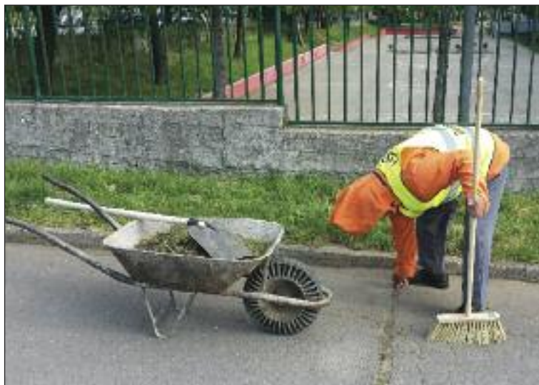
Čistenie pri Základnej škole Pri kríži ako prvá brigáda.