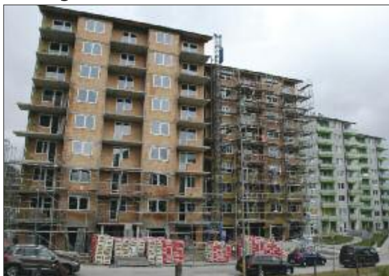
Aktuálna výstavba projektu TUJETOIN pri Dúbravčickej.