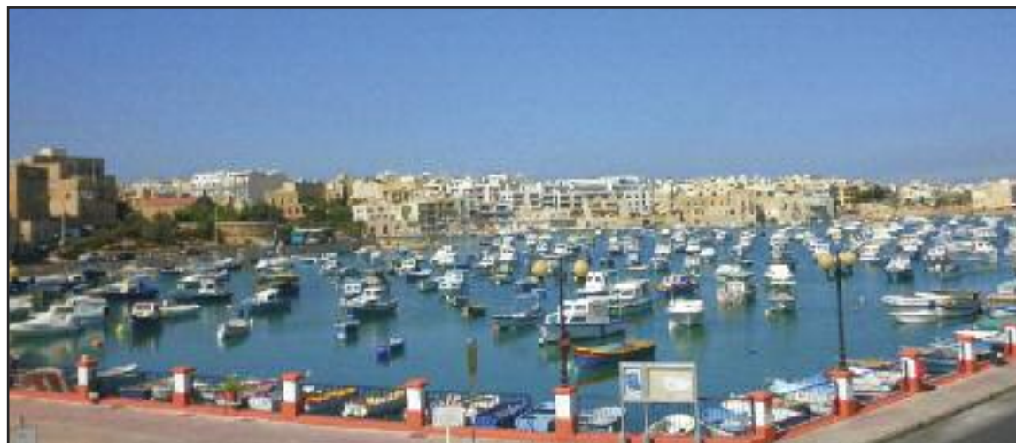
Pohľad na časť Marsaxlokk Bay na juhovýchode Malty.

Malta pozostáva z troch ostrovov, Malta, Gozo a Comino, ktoré majú veľmi bohatú históriu, siahajúcu a dokladovanú až do 6. tisícročia pred našim letopočtom. Cez ostrovy, ktoré zaujímajú strategickú polohu v Stredozemnom mori, prešli mnohé kultúry a zanechali po sebe stopy. Bola a zostáva významným obchodným uzlom počas mnohých stáročí. Ostrovy pre ich priaznivú a strategickú