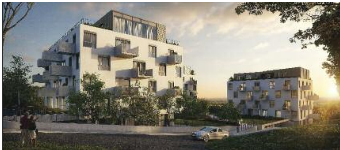
Vizualizácia Záhradné vily. Súbor s 50 bytmi.