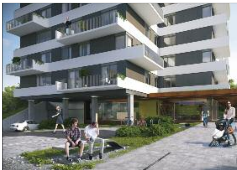
Vizualizácia. Pečná vyhlídka ponúkne 52 bytov.

sme základný koncept, architektonickú štúdiu a ponúkli sme mestskej časti a magistrátu realizáciu týchto verejnoprospešných stavieb na vlastné náklady našej spoločnosti. Pôvodné stromy budú citlivo do-