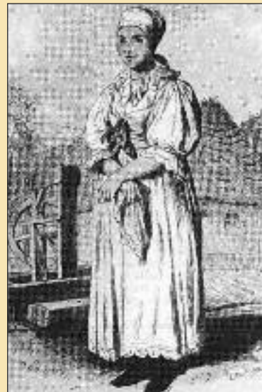
Kresba L. Burgera z druhej polovice 19. storočia znázorňuje ženu zo Záhorskej Bystrice pred sedliackym domom krytým slamenou strechou a pri typickej ľudovej studni.

Mužský kroj bol nepomerne menej reprezentatívny, jeho obligátnou súčasťou býval klobúk a nohavice zdobené šujtášmi, čiže plastickou farebnou šnúrovou výšivkou. Mláďenci mávali klobúky zdobené tzv. perkami z rozmarínov a stužiek, tvoriacimi homolovitú ozdobu. Košeľe bývali biele, lajblíky belaso farebné, z lesklých alebo syto farebných materiálov. Tieto výzdoby sa uplatnili najmä na svadbách, keď dievčatá i družbovia bývali sviatočne vyparadení. A práve tento typ kroja mali na hody oblečený starosta s manželkou.