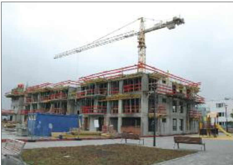
Neďaleko OC Dubrawa vyrastá ďalšia etapa Tammi.