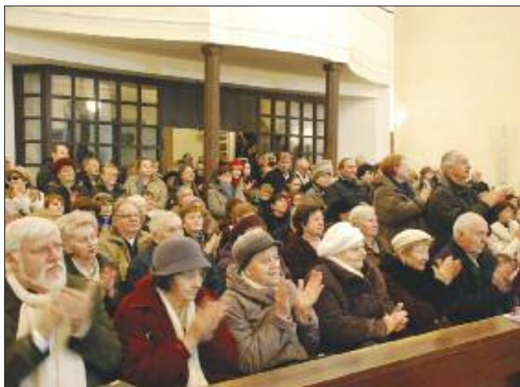
Miesta v Kostole sv. Kozmu a Damiána sa zaplnili do posledného.