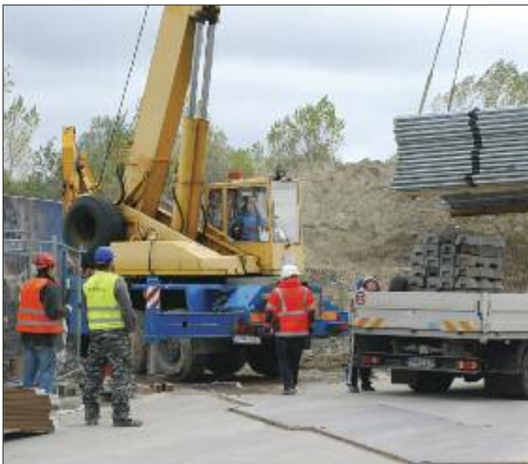
Výstavba mení Dúbravku. Ruch je najmä na konci Dúbravky - Brižite, Dúbravce.