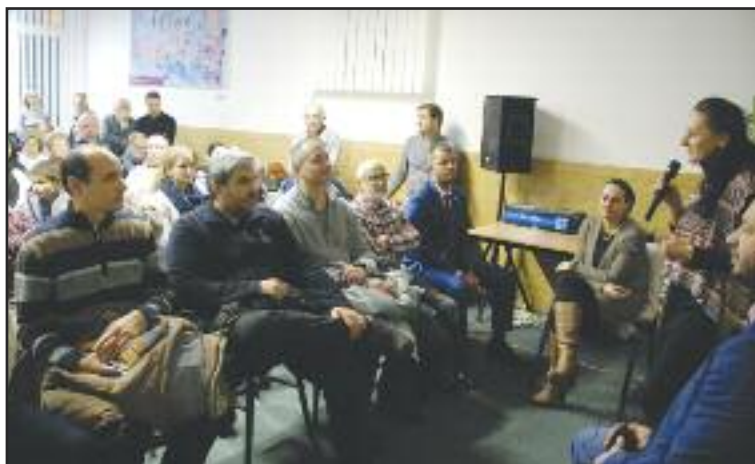
Debata zaplnila Centrum rodiny, prišli aj niekoľkí dúbravskí poslanci.