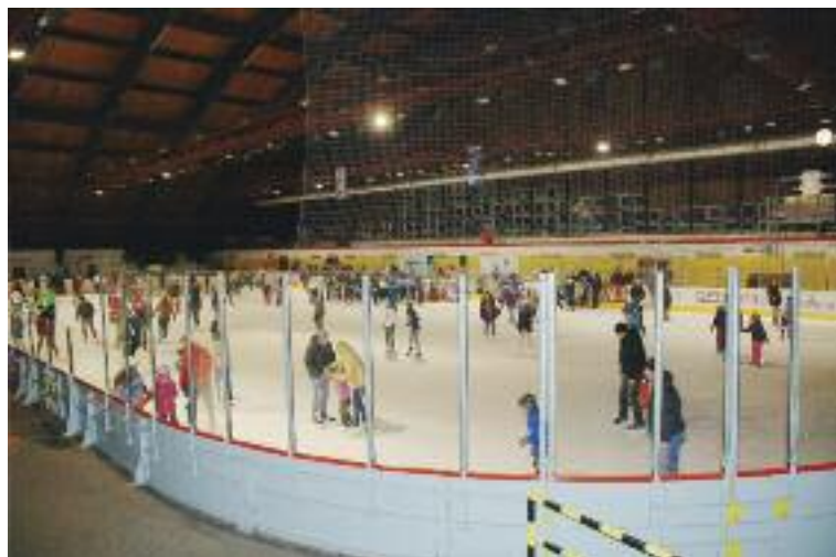
Korčuľovanie na štadióne v Dúbravke.

Klisko pred nákupným centrom Bory Mall má rozmery 30x15 metrov. Situované je pri severnom vchode a funguje počas pracovného týždňa od 10.00 – 21.00, cez víkend od 9.00 – 21.00. Korčule sa tu dajú požičať, detské sú od veľkosti 29.