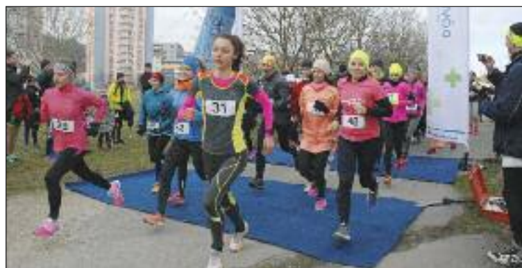
Po vlaňajšom behu sa vytýčila prvá bežecká trať v Dúbravke, je na ulici Pod záhradami.

Cena pre víťaznú dvojicu Valentínska sauna od FYZIOELÁN a relaxačná hodinová masáž od Zdravotnej poisťovne Dôvera – to všetko pre dve osoby, pre prvé 3 miesta hodnotný bežecký tovar od Ready2Run a darčekový balíček od Zdravotnej poisťovne Dôvera.