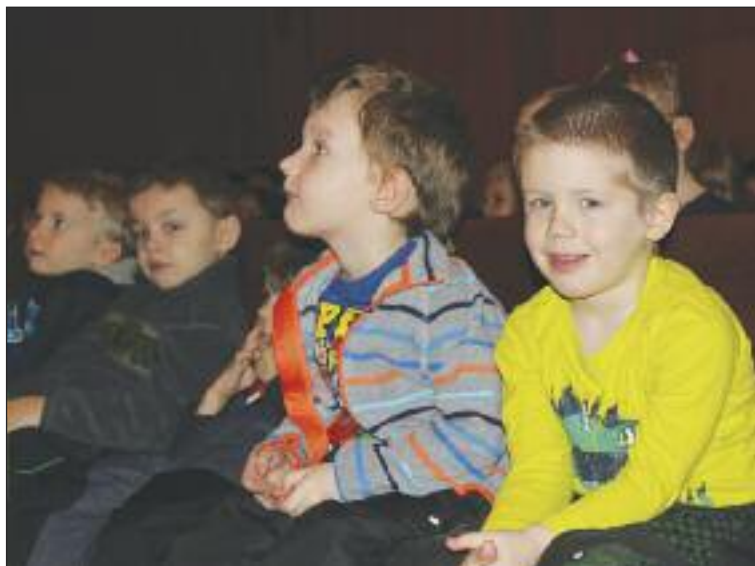
Predškôláci z materských škôl si vyskúšali interaktívne čítanie.