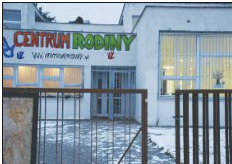
Centrum rodiny funguje dva roky, sídli na Bazovského pri fontáne.

O debatu s vedením mestskej časti i spoznanie centra bol záujem. Budova sa naplnila. Jednotlivé organizácie, združenia, nadšenci a dobrovoľníci, vďaka ktorým fungujú aktivity v centre predstavili svoju činnosť.