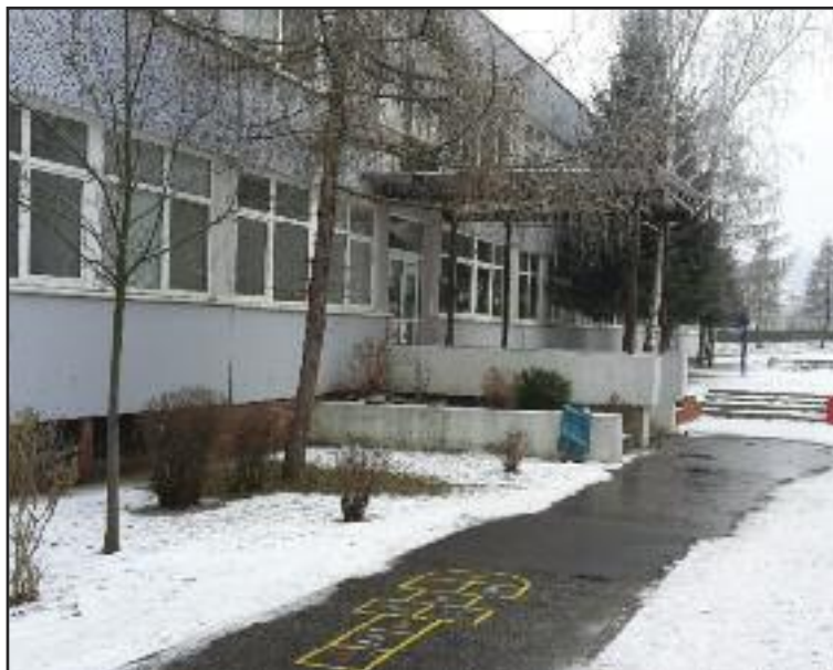
Základná škola Pri kríži sa kedysi volala Krajňákova.

„Školu navštevujú aj žiaci so zdravotným znevýhodnením - s vývinovými poruchami učenia, poruchami aktivity a pozornosti, narušenou komunikačnou schopnosťou, pervazívnymi vývinovými poruchami i žiaci so všeobecným intelektovým nadaním. Títo žiaci majú upravené formy a metódy práce a vypracovaný individuálny vzdelávací program. Školu navštevujú aj deti cudzincov, ktorým škola zabezpečuje v adaptačnom procese jazykový kurz na osvojenie si slovenského jazyka,“ približuje riaditeľka. „Povinnú školskú dochádzku si tu plnia aj žiaci študujúci v zahraničí, ktorí pravidelne absolvujú komisionálne skúšky. Pedagogický zbor tvorí stabilizovaný kolektív kvalifikovaných pedagogických a odborných zamestnancov. Škola má vypracovaný ročný plán kontinuálneho vzdelávania pedagogických zamestnancov, ktorý je každoročne aktualizovaný podľa potrieb školy. Škola poskytuje žiakom a rodičom služby školskej psychologičky a špeciálnej pedagogičky.“