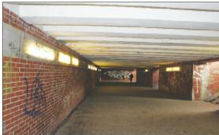
Zničený a pochmúry podchod pri OC Saratov by sa mal dočkať zmeny.

Súčasťou rozpočtu sú aj dlhoročné trápenia Dúbravčanov - rozšírenie Harmincovej ulice, kde momentálne v spolupráci s developerom, ktorý tu stavia bytový projekt Čerešne, prebieha výkup nevysporiadaných pozemkov či riešenie zničených podchodov v mestskej