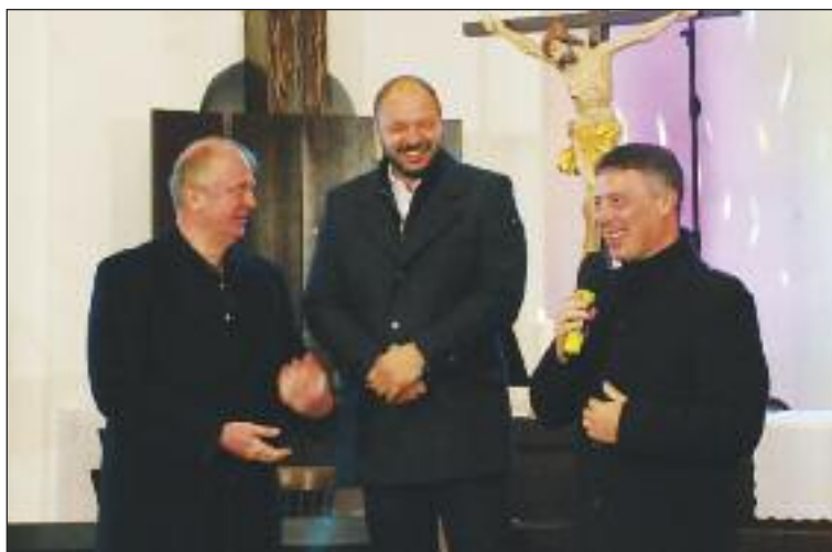
Koncert spojil Dúbravčanov aj cirkvi. Prihovoril sa katolícky aj evanjelický farár.