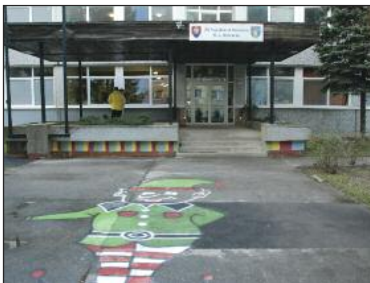
Základná škola Nejedlého so symbolom Nejedlíkom pred bránami.

„Sme držiteľmi certifikátu Zelená škola. Okrem toho máme rozší-