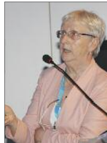
Už dlhší čas je významná vedkyňa obyvateľkou Dúbravky.

Je obecné známe, že na Slovensku vede ruže nekvitnú z viacerých dôvodov. Jedným z nich je objem financií, ktoré sa do nej vkladajú, chýbajú objek-