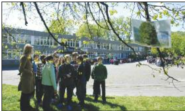
Na Deň Zeme otvárala škola Beňovského náučný chodník v parku Družba.

„Zavádzame nové metódy a formy vyučovania – implementujeme digitálne technológie do vyučovacieho procesu, využívame zážitkové učenie, projektové vyučovanie, výskumnú prácu v teréne a ďalšie moderné metódy. Venujeme sa aj environmentálnej, mediálnej, multikultúrnej výchove.“ V škole pôsobí školský špeciálny pedagóg, ktorý sa venuje nadaným žiakom s talentom a žiakom so špeciálnymi výchovno-vzdelávacími potrebami.