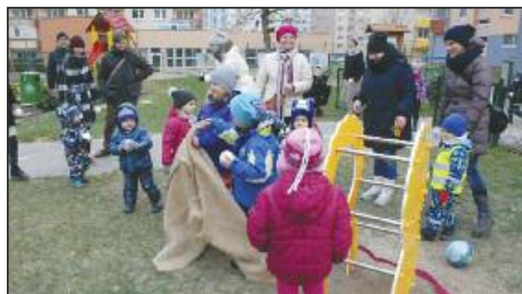
Loptoš má tvar leva. Do papule mu deti hádžu gule.

„Bol to projekt v rámci nášho školského predmetu tímové projektovanie,“ približuje Eva Hudáková,