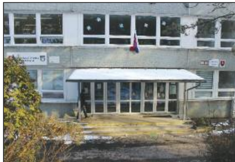
Druhá najstaršia základná škola v Dúbravke bola v minulosti známa výberovými triedami.