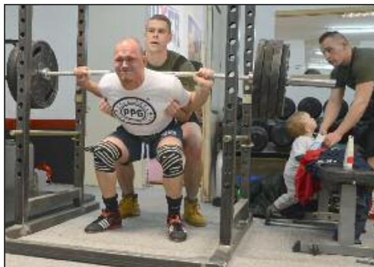
Jednou z disciplín silového trojboja je drep s činkou.

Ako som spomínal, tým, že sú tu tri federácie, do roka sa nazbiera aj osem, deväť súťaží. To sa ale z regeneračného hľadiska nedá utiahnuť, respektíve dalo by sa, ale bolo by to na margo zdravia, výkonu. Nedá sa dlhodobo ísť na vrchole síl. Osobne odporúčam dve súťaže ročne, jednu jarnú a jesennú. Za rok