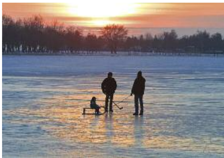
Korčuľovanie na "Neusiedleri" má atmosféru i kus romantiky.

www.neusiedlersee.com/de/aktivitaeten/sport-bewegung/wintersport.html