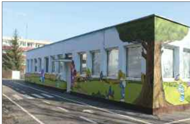
Materská škola Bazovského je typická svojimi maľbami na fasáde.

„Naším cieľom je komplexný rozvoj dieťaťa, ktorý zabezpečujeme ak-