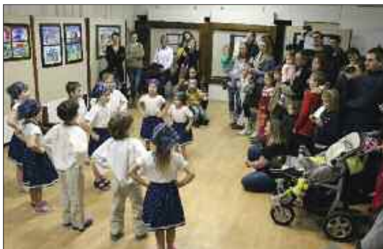
Výstavu diel a návrhov otvoril na vernisáži v Dome kultúry Dúbravka program detí z Materskej školy Cabanova.