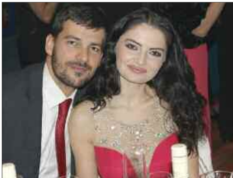
K plesu patria aj krásne dámy v elegantných šatách.