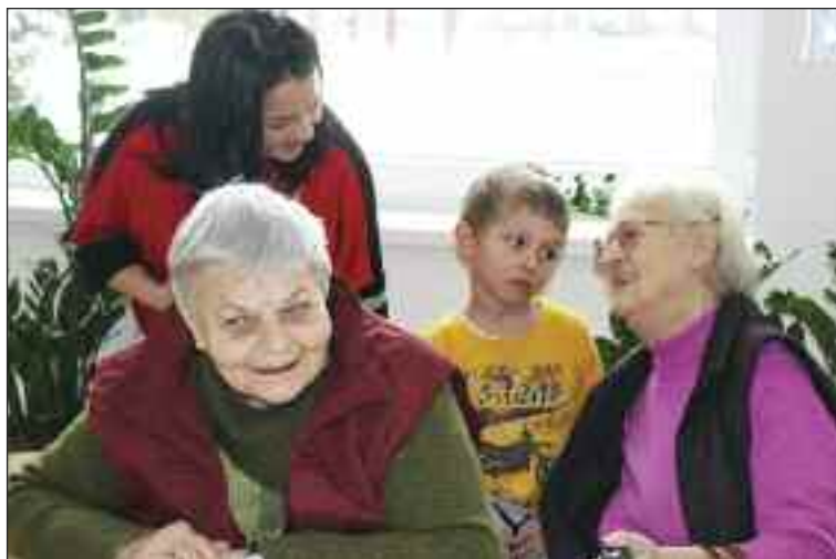
Tvorenie spojilo seniorov a juniorov.