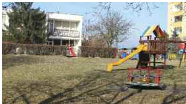
Materská škola Galbavého sa venuje životnému prostrediu.