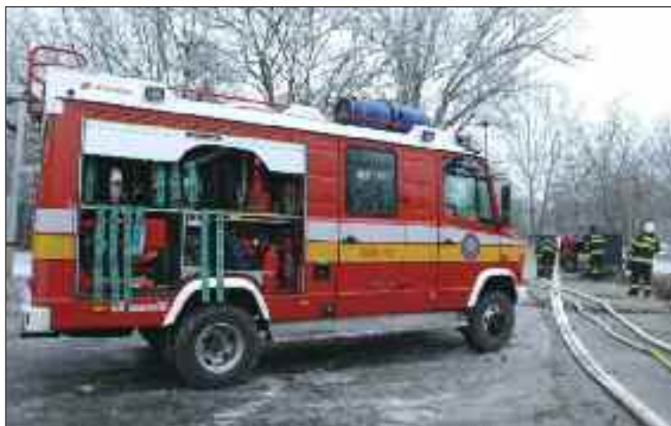
Pri odsávaní vody z komunikácii pomáhali na Bilíkovej aj hasiči.