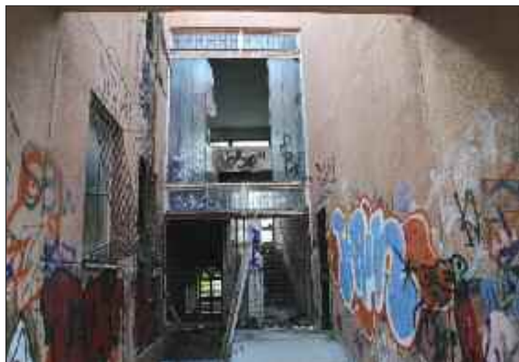
Keď idete okolo začnete pochybovať či ste uprostred sídliska. Je zničená, vypálená. Budova na Ulici kpt. Rašu.