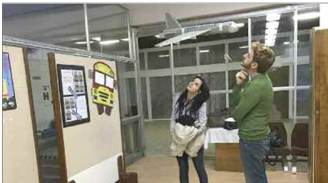
Letisko Dúbravka síce ešte nemá, ale deti už vyrobili model dúbravského lietadla.