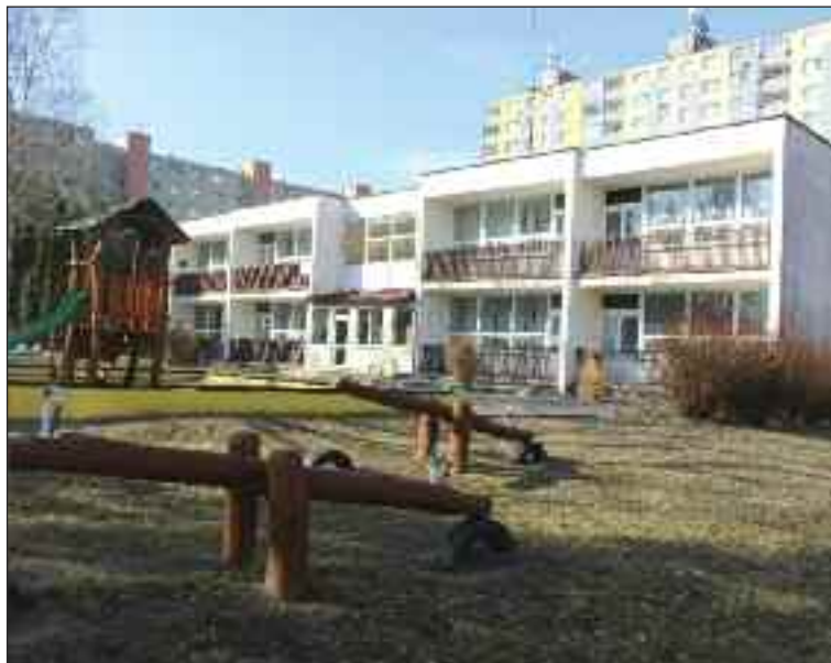
Materská škola na Ušiakovej so svojim ihriskom.