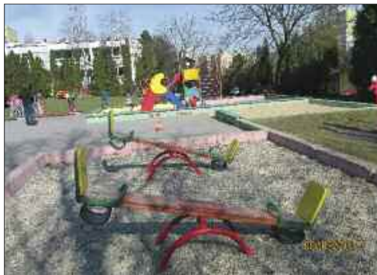
Materská škola Pri kríži s bohatým školským dvorom a ihriskom.

Kurzy s externým lektorom – korčuľovanie, plavecký.