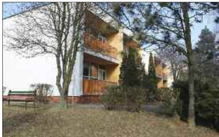
Budova materskej školy je mimo hlavných ciest a má najbližšie k lesu.