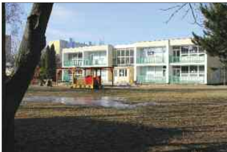
Materská škola Sekurisova leží neďaleko knižnice v pokojnom prostredí mimo hlavných ciest.