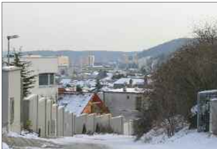
Nová povinnosť sa týka rodinných domov.

Prihlásiť sa do systému možno na magistráte na Oddelení miestnych daní a poplatkov na Blagoevovej ulici, P. O. BOX 76, 850 05 Bratislava 55 alebo v podateľni