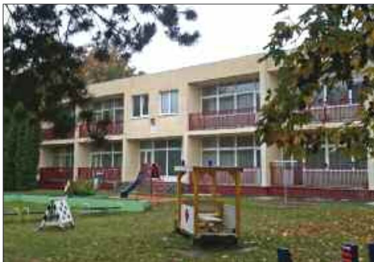
Materská škola Švantnerova blízko ZŠ Sokolíkova.