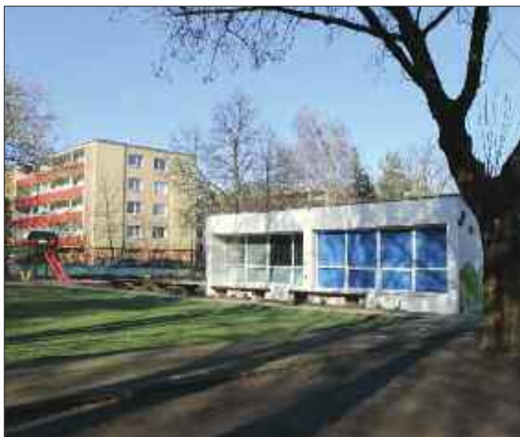
Materská škola Damborského neďaleko Žihadielka.