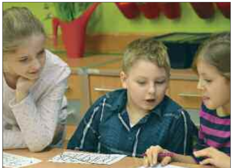
Žiaci si precvičili tímovú prácu.