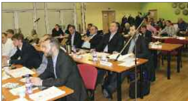
Miestni poslanci budú rokovať najbližšie 25. apríla v KC Fontána.

Príjem z poplatku môžu samosprávy použiť na úhradu kapitálových výdavkov, napríklad investíciou do materských škôl, sociálnych zariadení, miestnych komunikácií či zelene. Peniaze sa môžu použiť aj v súvislosti s výstavbou zariadení sociál-