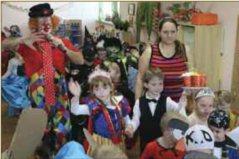
Fašiangové zvyky si dnes pripomínajú aj deti z dúbravských základných a materských škôl. Vo štvrtok 16. februára bola škôlka na Cabanovej plná ry-tierov, princezien, batmanov, zvieratiek, víl, policajtov, kominárov, čašníkov, hasičov, čertov a anjelov. A prišiel aj šašo Maroš.