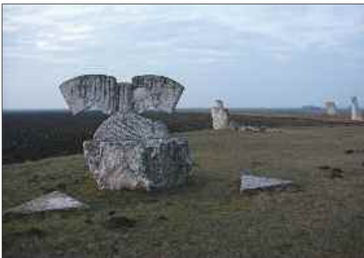
Kamenné diela v prostredí dotvárajú atmosféru.