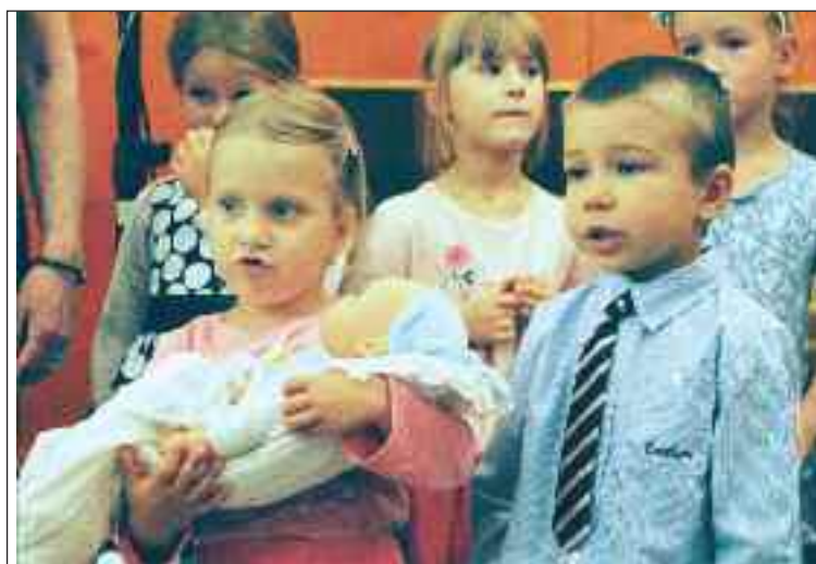
Vítanie detí sa koná v dome kultúry a sprevádza ho program.

vítanie detí prihlásiť, aký je postup, čo má človek urobiť. Udalosť Uvítanie detí do života je pre deti do jedného roku s trvalým pobytom v Dúbravke. Mestská časť však deti a rodičov nepozýva na túto slávnosť, ktorá pravidelne prebieha v Dome kultúry Dúbravka, automaticky, volá len takých, ktorí majú záujem. Treba prísť v úradných hodinách na Oddelenie sociálnych vecí a