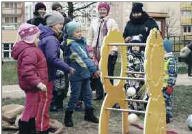
Zo zimného krstu prvého Loptoša na ihrisku Homolova.

Jeden hrací prvok si nájde svoje miesto na základe odpovede na výzvu Občianskeho združenia. Napíšte nám motivačné odôvodnenie, prečo by práve vaše ihrisko malo