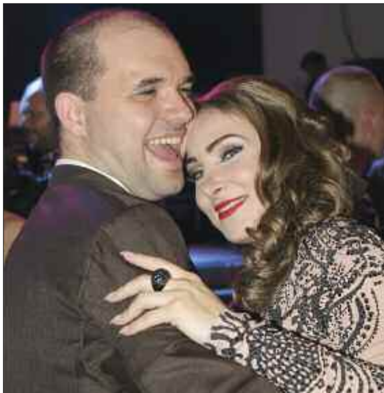
Párik na parkete dokazoval, že tanec je aj na plese je poriadna zábava.