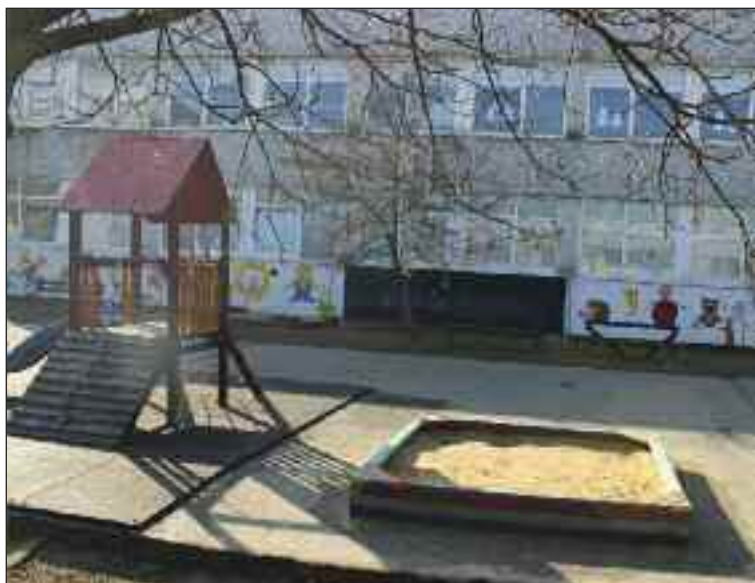
Materská škola Nejedlého je v budove Základnej školy na Nejedlého.