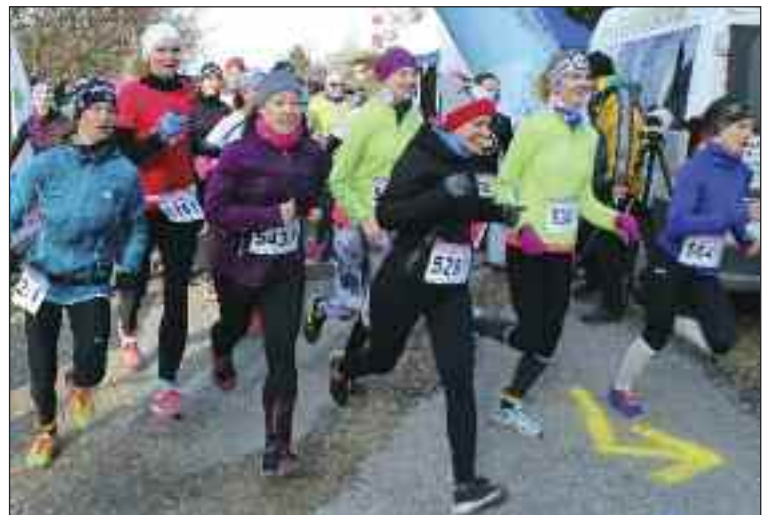
Na štartovú listinu druhého ročníka behu zamilovaných v Dúbravke sa zapísalo spolu sedemdesiat partnerských dvojíc.

zóna, kde sa čas nemeral, aby v zhone a panike pri rýchlych hľadaní bežeckého partnera nedošlo k úrazu. Štartovné bolo dobrovoľné. Celá suma, ktorá sa vyzbierala, sa použije na vybudovanie označenia 5-km bežeckej trasy v Dúbravke. Víťazná dvojica získala relaxačnú hodinovú masáž, fyzioterapeutickú diagnostiku a procedúru podľa vlastného výberu. Najlepšie tri dvojice dostali hodnotný bežecký tovar od Ready2Run, nákupnú poukážku od Decathlon Bory a darčekový balíček od Zdravotnej poisťovne Dôvera. Za MČ Dúbravka odovzdával ceny pre najlepších predseda