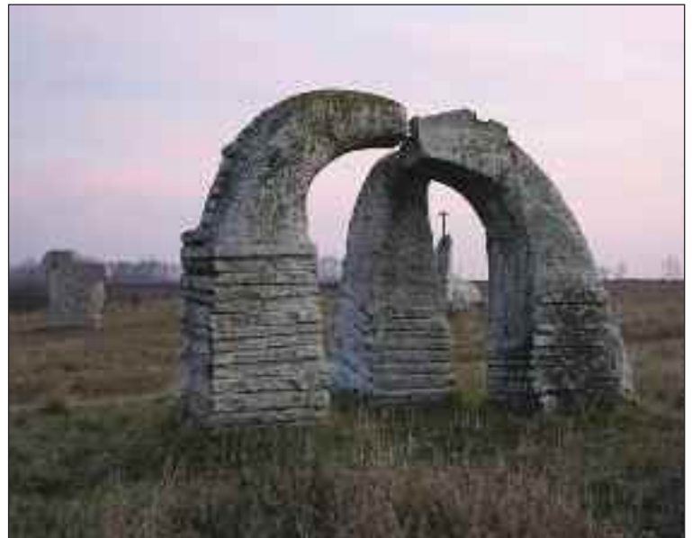
Pri hraničnom trojmedzí je aj niekoľko kamenných sôch od rôznych umelcov.

Keď idete autom, je možné si cestu podstatne skrátiť. Pôjdete smerom na Rajku a za odbočkou na Gabčíkovo, asi po 300 metroch odbočíte vpravo cez železničné priecestie, za ktorým sa dá zaparkovať. Odtiaľto je to ponad nadjazd do cieľa asi 45 minút pohodovej chôdze po červenej značke.