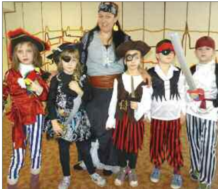
Pirátska zostava na Základnej škole Sokolíkova.