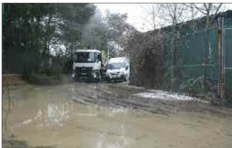
Zatopená a zničená Dražická ulica v deň havárie.