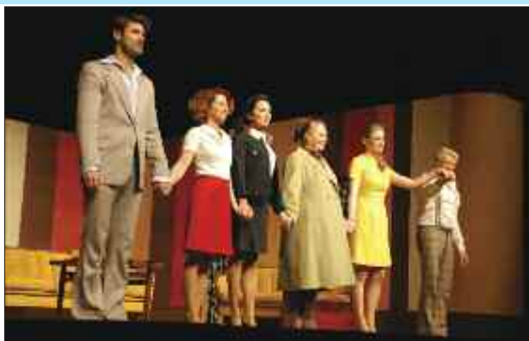
Tri letušky rozosmiali obecenstvo oddychovou veselohrou.