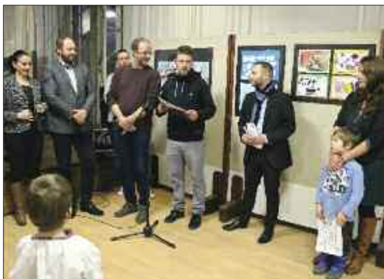
Omaľovanka sa krstila symbolicky a ekologicky, vodou.