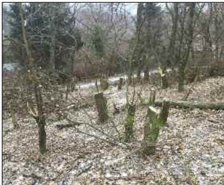
Zničený lesný porast v lokalite Polianky.