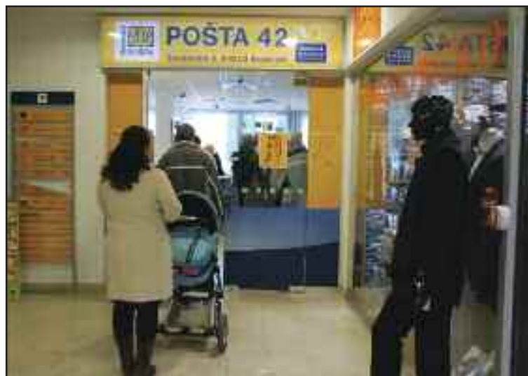
Na pošte v Obchodnom centre Saratov sú rady ťahajúce sa až mimo priestorov pošty časté.

V prípade stabilného doručovateľa áno, je to poštár, alebo poštárka, ktorý pozná svoj rájón a aj značnú časť takzvaných svojich klientov. Priemerne na jedného doručovateľa je to okolo 1200 adresných miest. Keď sa vrátim k spomínaným Dúbravským novinám, na jedného doručovateľa teda pripadlo preniesť a vhoďiť do schránok 1200 výtlačkov novín, ktoré mimochodom majú nejakú hmotnosť. Bežne sa stáva, že vo vyťaženejších dňoch majú poštárske tašky aj viac ako 40 kil.