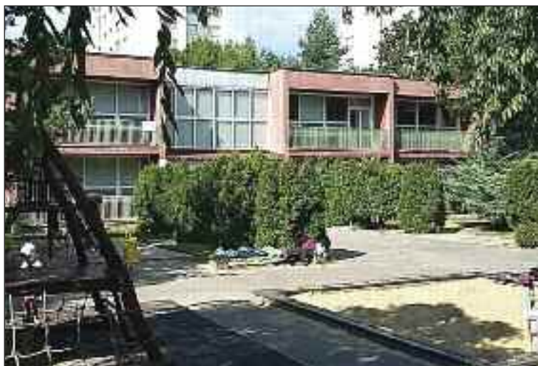
Materská škola Ožvoldíkova leží neďaleko Kultúrneho centra Fontána.