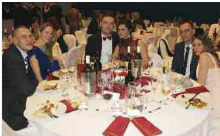
K plesu patriť aj dobré jedlo.