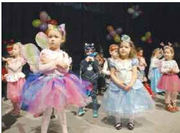
Na karnevale v kultúrnom dome sa masky predviedli aj na pódiu.