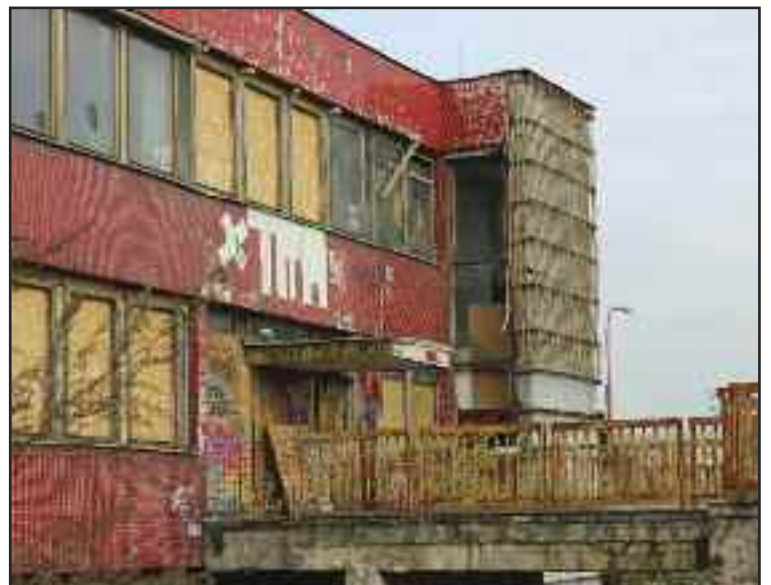
Viac na 2, 3 strane

K strašiakom v centre mestskej časti patrí stará pošta. Jej stav zatiaľ nemá riešenie.