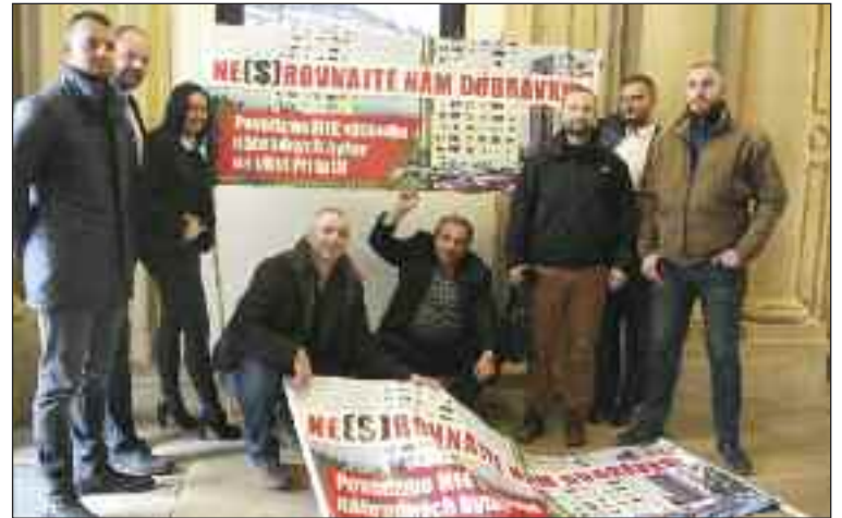
Transparent do rokovacej sály nemohol. Musel ostať pred vchodom.

Zverené pozemky nesmie Mestská časť Bratislava-Dúbravka podľa uznesenia previesť na tretie subjekty a ani