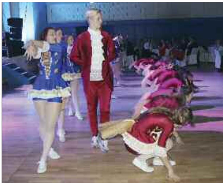
Tanečníci zo skupiny District dance predviedli energické vystúpenie.