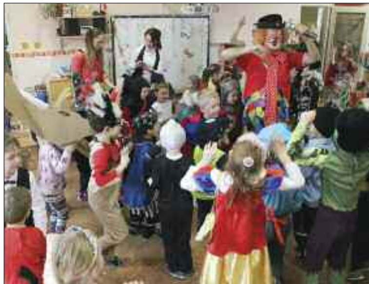
Detské masky počas karnevalu v Materskej škole Cabanova.