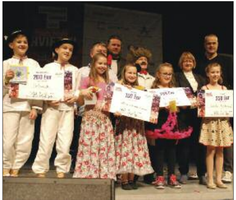
Mladé víťazné talenty s porotou a organizátormi.