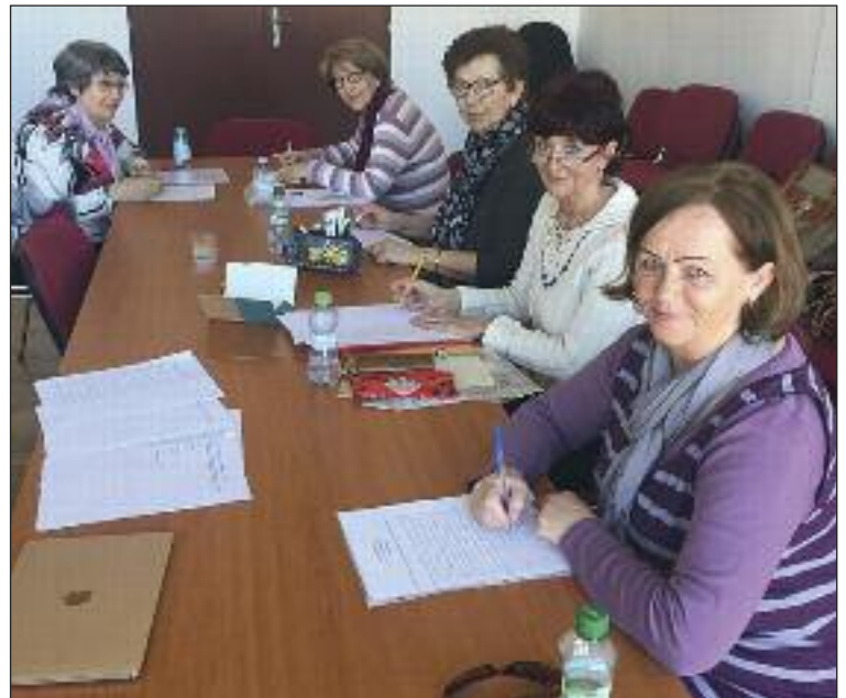
Tréning pamäti prebieha na Žatevnej 4 v budove miestneho úradu.

Nášmu mozgu pomáha, keď ho zaktivizujem ďalšou informáciou. Nielen to, že si v duchu poviem, že som si zapamätala, ale som si to aj nahlas povedala. Môžem urobiť aj ne-