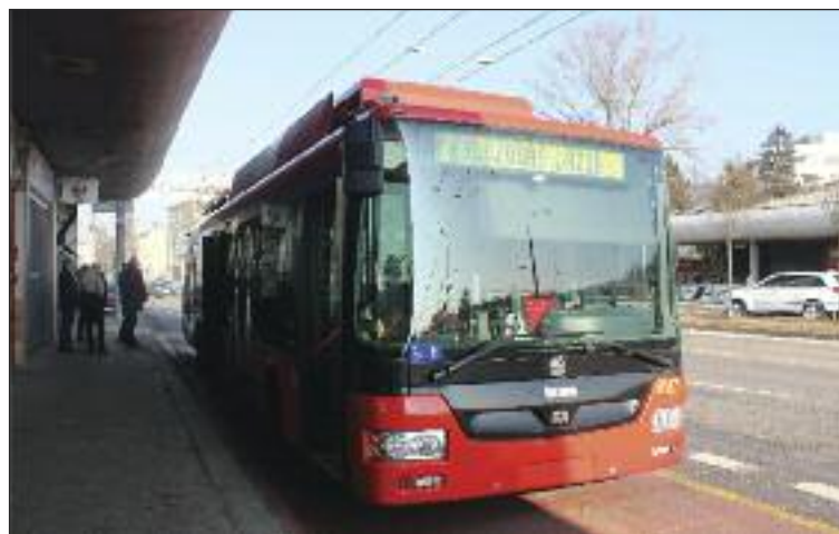
Vozidlo na pomocný dieselelektrický pohon nasadilo troleje na Patrónke.

„Mestské zastupiteľstvo uložilo primátorovi, a ten uložil dopravnému podniku začať proces obstarávania,“ hovorí Weigl. Dodal, že dopravný podnik by ich chcel tento rok obstarat' a v budú-