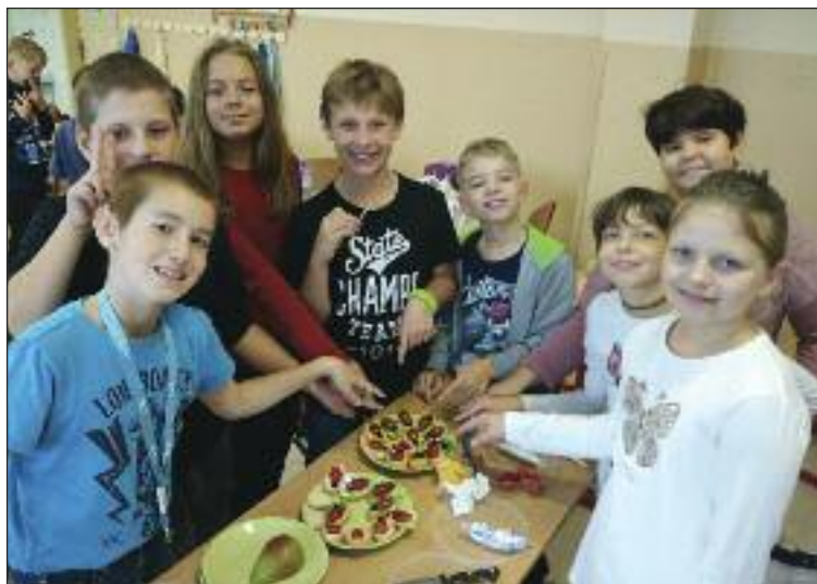
Projekt Jedlá zmena je aj tvorivý aj chutný.

A keďže za jeden deň nie je možné dokončiť všetko, základná škola bude pokračovať aj po akčnom dni. Súčasťou akčného dňa má byť aj bufet s rôz-