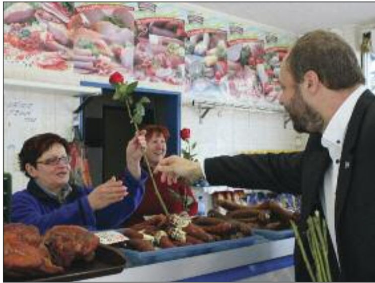
Ruže putovali do mäsiarstva aj na poštu či ihrisko.