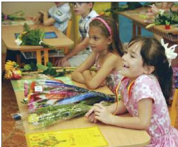
Zápisy budúcich prváčikov budú prebiehať dva dni 19. a 20. apríla.

Zapísať môže rodič dieťa len do jednej školy, rodičia si teda budú musieť vybrať.