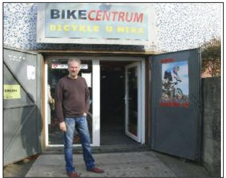
Predajňa Bicykle u Mira sídli v suteréne Základnej školy Pri kríži.

Je to štandard európskej únie, bicykle sú dodávané s kolieskami.