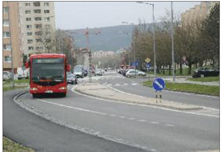
Autobusy 83 a 84, ktoré spájajú Dúbravku a centrum mesta, jazdia takmer po rovnakej trase.

Spojenie na Kramáre je podľa komisie v súčasnosti lepšie, ako keď v minulosti jazdil autobus 22. Pri prestupe na Patrónke ľudia nemusia toľko čakať na trolejbus 212 či 207. „Ku každému autobusu z Dúbravky je prípoj na Kramáre,“ hovorí Vašek. Dôležité je podľa dopravného analytika pri cestovaní MHD jazdiť plynulo, radšej prestúpiť a nečakať, ako čakať na jeden spoj s dlhými intervalmi. Upozornil tiež na zámer novej nemocnice, i plánoch nemocnice na Boroch, smerom ku ktorým by sa mala podľa neho zlepšiť doprava i spojenie MHD.