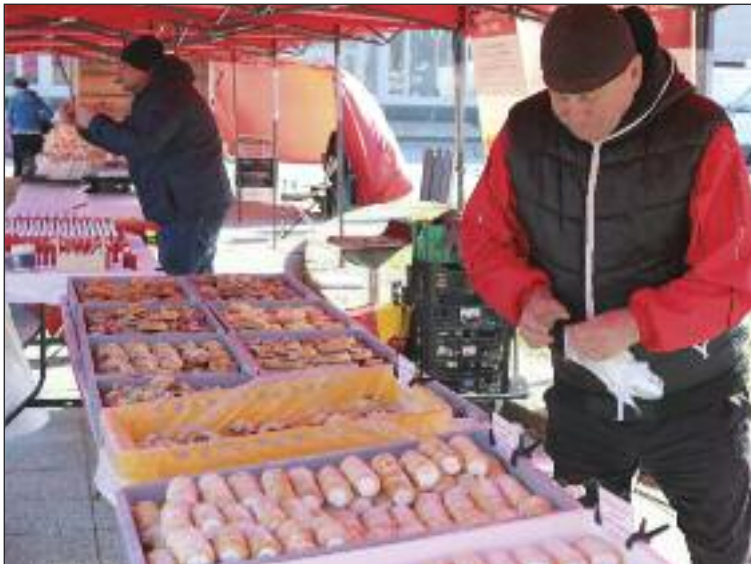
Na trhoch ponúkali rôzne koláče, chleby, zelenina a ovocie snád pribudnú s jarnými a letnými mesiacmi.

Dúbravka počas marca odskúšala Farmárske trhy, pred domom kultúry budú stánky predajcov každý druhý štvrtok.