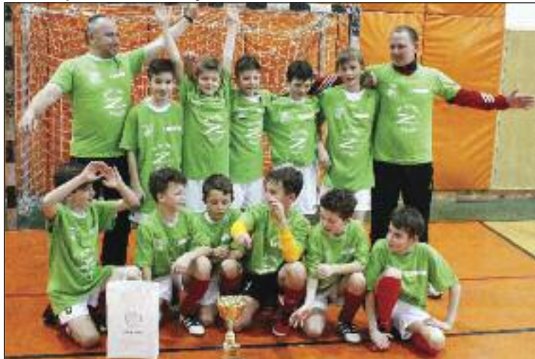
Družstvo MFK Záhorská Bystrica na fotografii pre víťaza.

Občianske združenie AC Zelenka zorganizovalo druhý ročník turnaja mladších žiakov (U13) v halovom futbale DÚBRÁVKA CUP. Tentoraz sa turnaj uskutočnil v športovej hale v Mlynskej doline. Podujatie malo vlastne už šieste pokračovanie, lebo prvé štyri ročníky sa hrali pod názvom O pohár Dúbravskej televízie.