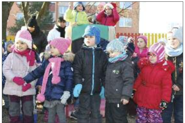
Dúbravka je zriaďovateľom desiatich materských škôl, od septembra pribudne ďalšia na Fedákovej.

rostlivosť a malo by mať samoobslužné návyky. Dieťa teda musí byť bez plienky a cumlíka. Musí vedieť ísť na toaletu, obliecť sa, umyť si ruky a jesť s lyžicou.