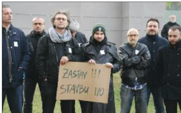
Stavba a udalosti dokázali spojiť poslancov.