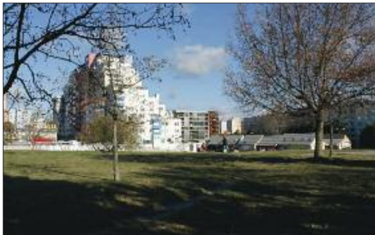
Prioritou je podľa komisie zamerať sa na regulovanie centra Dúbravky.