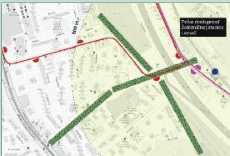
Prístup k ŽST Lamač je pre chodcov plný bariér.