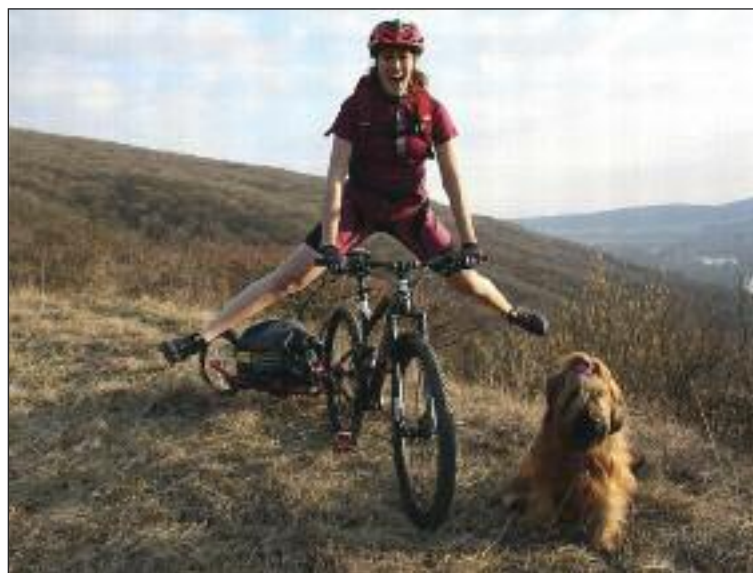
Cyklovýlet z Dúbravky na Dúbravskú hlavicu.

Vidím nárast práve v elektrobicykloch, tam je obrovská rezerva. Do-