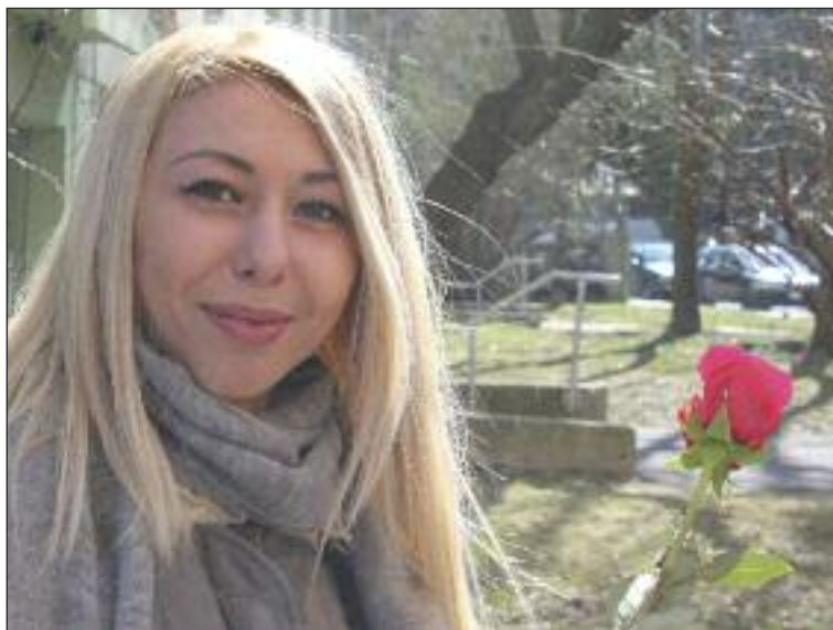
Kvety priamo v uliciach prekvapili a potešili.