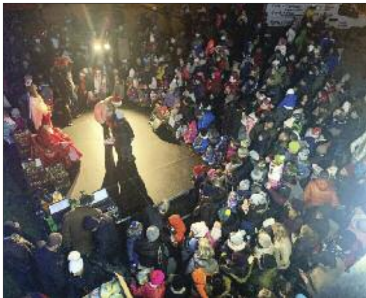
Najviac detí prišlo za Mikulášom k domu kultúry.

Na záver „šichty“ zašiel Mikuláš aj do dúbavskej cukrárne. Náhodným okoloidúcim zazvonil na pozdrav... Vo vzduchu tak bolo cítiť, že Vianoce sa už blížia. (lum)