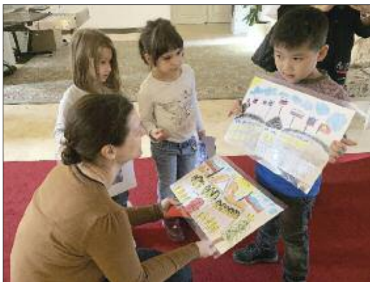
Deti prezidentovi nakreslili aj obrázky.