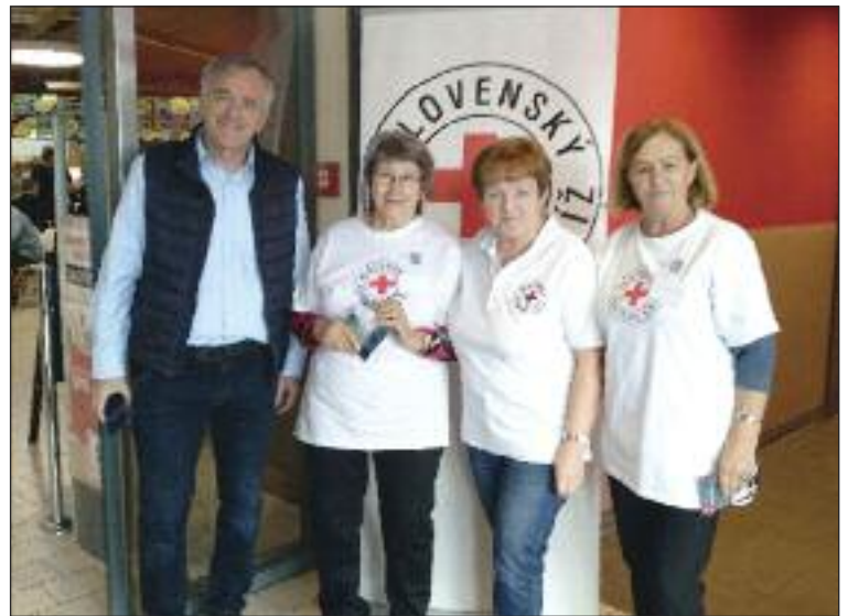
Z potravinovej zbierky Miestneho spolku SČK Dúbravka.

Niektorí prispeli pri skromnom osobnom nákupe aspoň čajom, soľou, iní pridali aj múku, detskú výživu, dokonca prišli aj takí, čo nakúpili iba pre naše vozíky. Prišli, aby pomohli. Taký bol aj manželský pár so svojimi vyše 160 krížikmi života na pleciah,