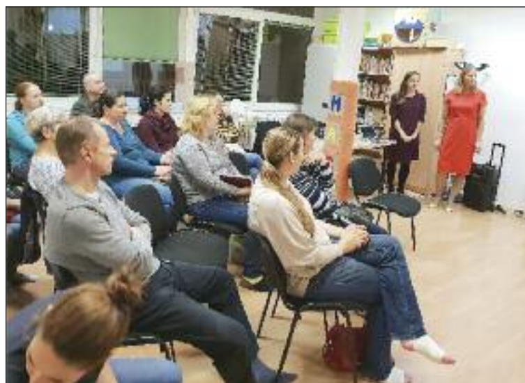
Prednáška a cenné rady nielen o reči zneli v Rodinnom centre Macko.