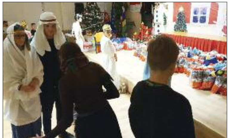
V pozadí balíčky vytvorené z hračiek zo zbierky, vpredu biblický príbeh v podaní ZŠ Beňovského.