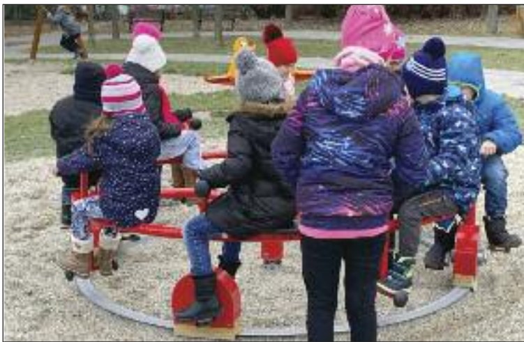
Osemmiestny šliapací kolotoč.