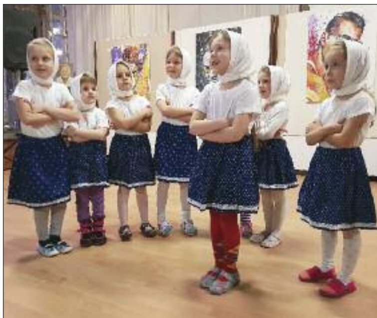
Na vernisáži vystúpili deti z MŠ Cabanova.