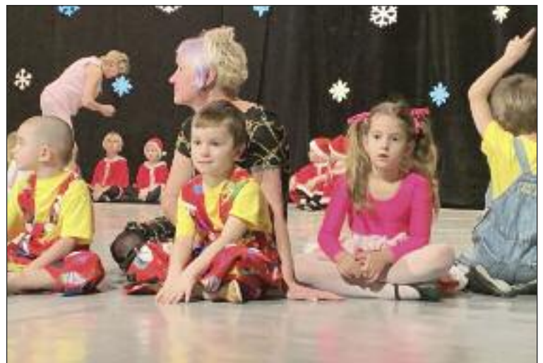
Farebné tančeky, spev od detí z MŠ Ušiakova