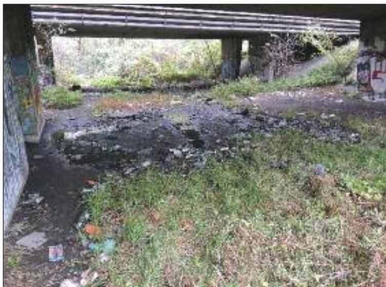
Dnešná podoba pozemku.