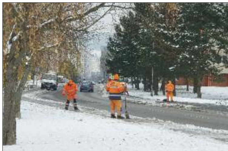
Dúbravka má približne 48-tisíc metrov štvorcových chodníkov.

Začali sa preto hromadiť otázky nielen starostov mestských častí, ale aj obyvateľov, čo bude, kto bude chodníky pri domoch v Dúbravke od-