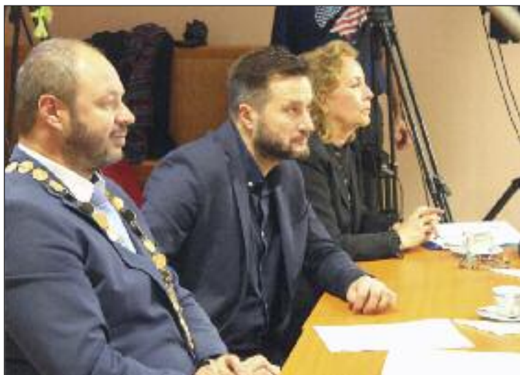
Na ustanovujúce zastupiteľstvo prišiel aj nový primátor Matúš Vallo.