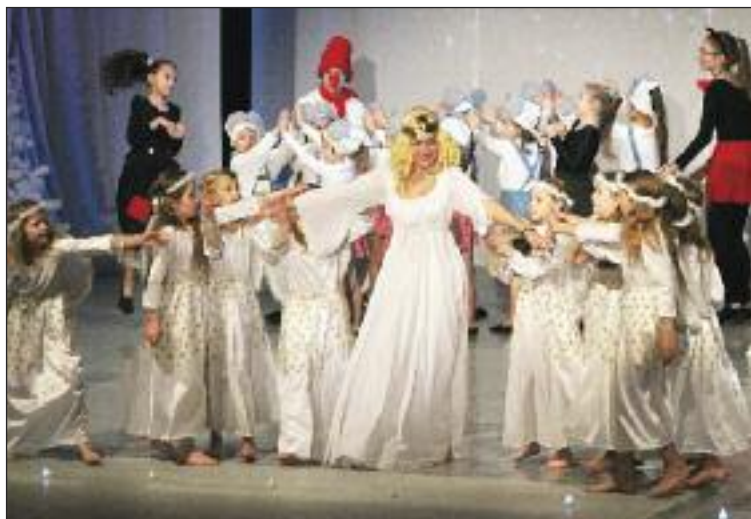
Princezná so zlatou hviezdou na čele pri vystúpení žiakov Alkany pre dúbravské školy.