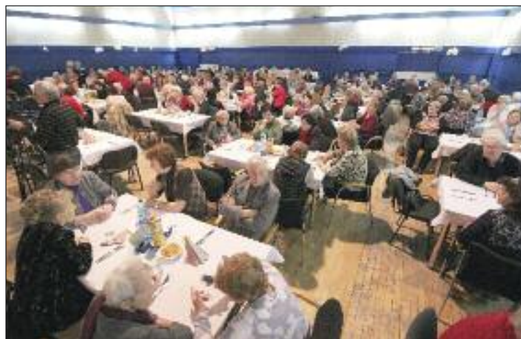
V Dome kultúry Dúbravka zavládla krátko pred Vianocami sviatočná atmosféra. Dobré jedlo, program a spoločne strávené chvíle dúbravských seniorov.