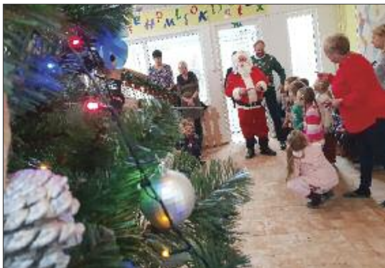
Mikulášovým pomocníkom bol starosta.