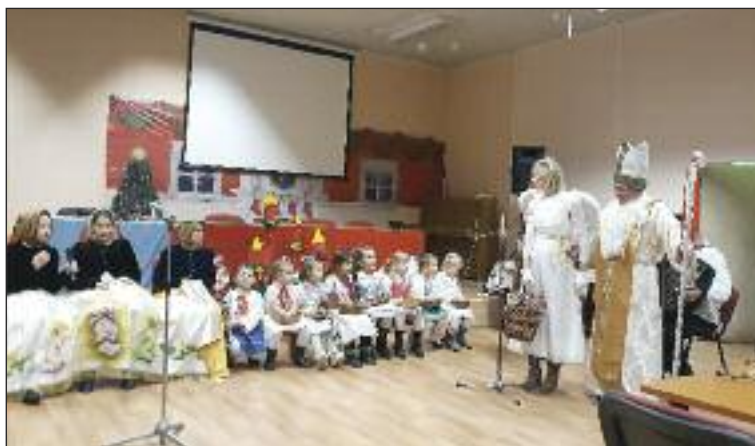
Výročnú schôdzu dopĺňal aj kultúrny program.