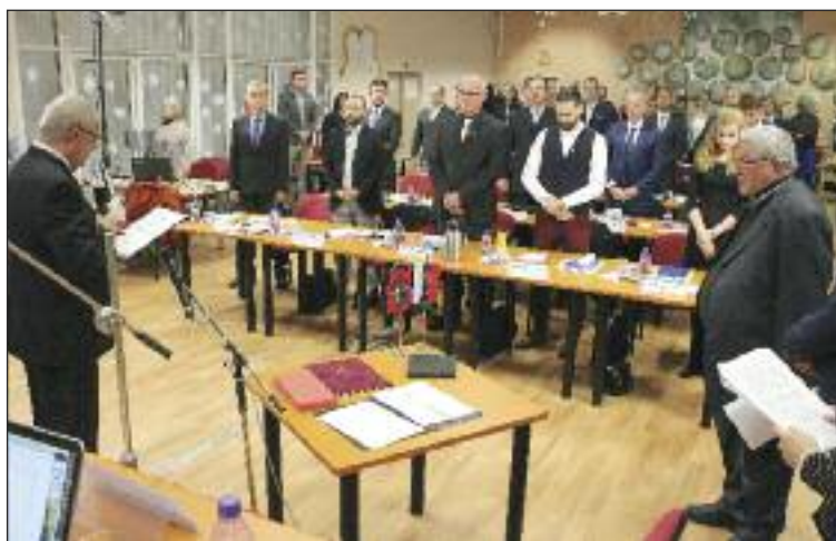
Miestne zastupiteľstvo prebieha v Kultúrnom centre Fontána.