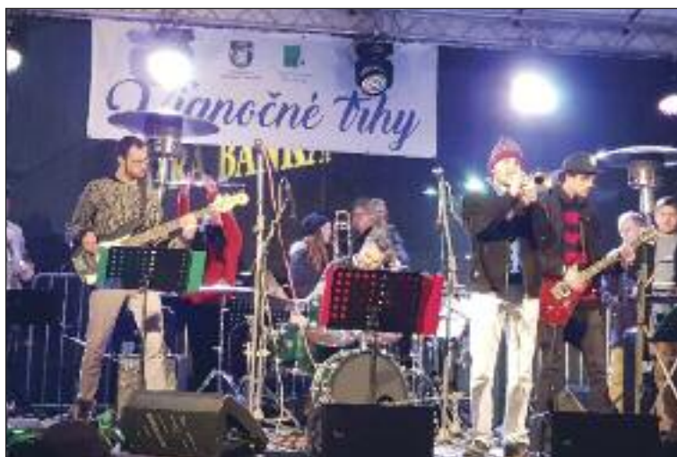
Program otvorili hudobníci Taste of Brass.