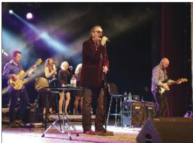
Richard Müller vystúpil v sprievode 11 hudobníkov.

síme ani zhasnúť. Posledný raz. Bude prvý. Milujme sa prosím. Na smrť...”