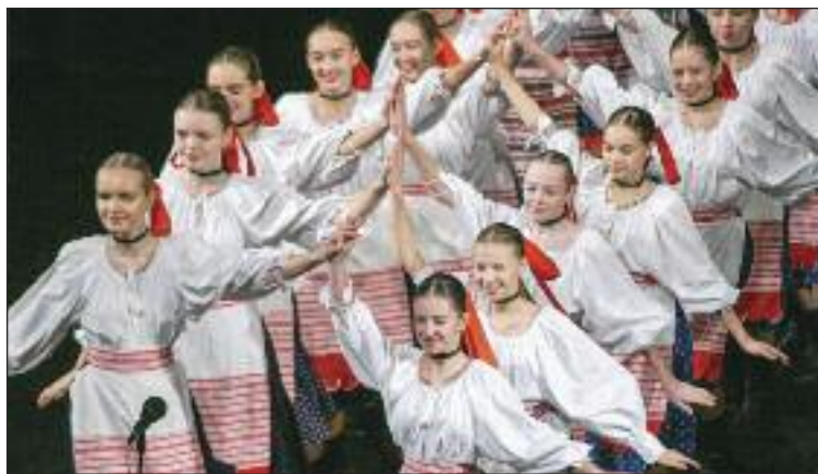
Detský folklórny súbor oslavoval štyridsiatku na pódiu.

Druhú časť galaprogramu otvorili v sprievode hudby a spevu strední a veľkí tanečníci. Opäť pestré kostýmy prevažne v červenej, bielej a modrej farbe. Mládenci v slovenských krojoch svojimi tanečnými kreáciami s cifrovanými prvkami zožali úspech, ale nedali sa zahanbiť ani dievčatá s tancami zo Zemplína, Myjavy a sálou zazneli salvy potlesku a výkriky nadšenia. Jednotlivé choreografie upútať malých i veľkých. Čečinka má vo svojom repertoári pôvodný, ale i štylizovaný folklór takmer z celého regiónu Slovenska.