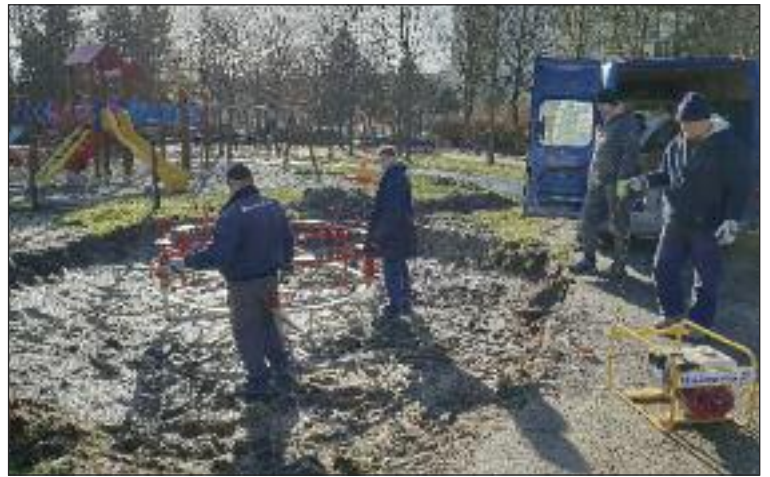
Osádzanie nového šliapacieho kolotoča.

Výraznou zmenou nielen v parku, ale v ponuke športu v Dúbravke je vznikajúce nové multifunkčné ihrisko. Mestská časť ho pripravuje na jednej z asfaltových plôch parku. K jeho vzniku pomohla aj dotácia z Úradu vlády, ktorú sa mestskej časti podarilo získať. Práce prebiehajú, ihrisko by malo byť hotové koncom roka 2018 alebo začiatkom 2019. Nové multifunkčné športové ihrisko bude mať rozmery 33 x 18 metra,