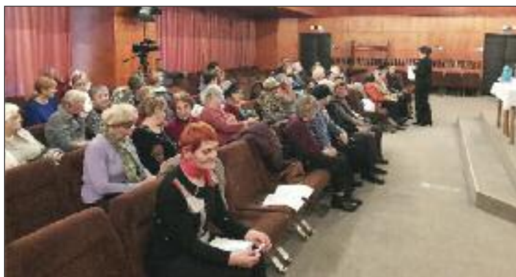
Prednáška hovorila aj o tom, aké je dôležité blízkeho objat' a povedať mu, mám ťa rád.

Každé obdobie života má predsa svoje čaro, seniorský vek nevynímajúc. Sme šťastní, že ako jedna z