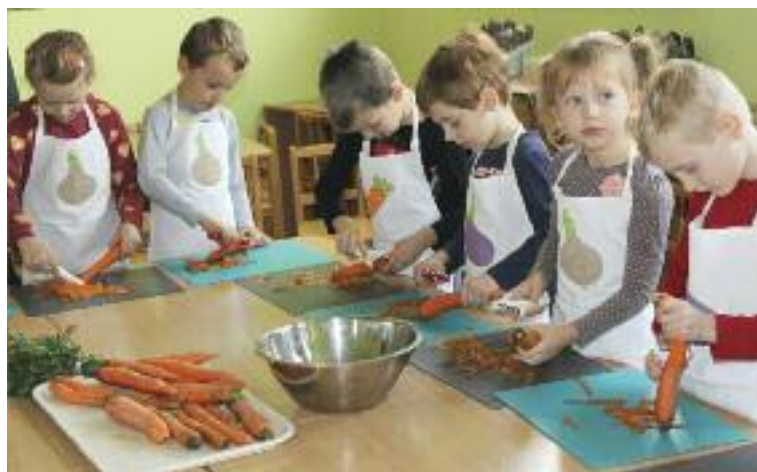
Prvou témou zeleninkovania na Cabanke bola mrkva.