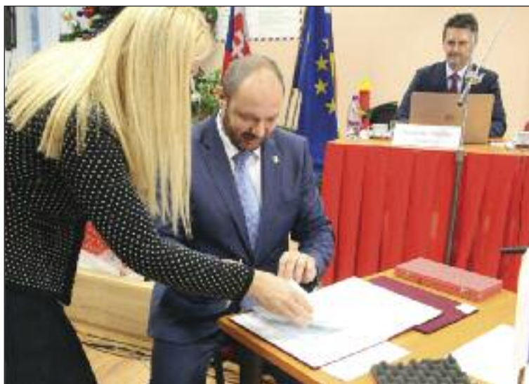
Svoj sľub spečatil starosta aj svojim podpisom.

Poslanci tiež odobrili zriadenie 10 komisií a jej predsedov. Počet komisií a ich zameranie ostávajú rovnaké,