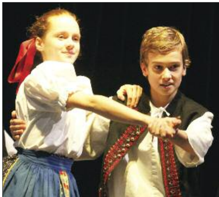
O program sa postaral Detský folklórny súbor Klnka.