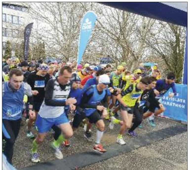
K Rosničke prišlo 673 bežcov, behala sa 5 aj 10 kilometrová trať, 300, 600 a 800-metrová verzia pre deti.

ČSOB Bratislava Marathon sa v roku 2019 uskutoční už po štrnástykrát v tradičnom termíne, prvý aprílový víkend. (lum)