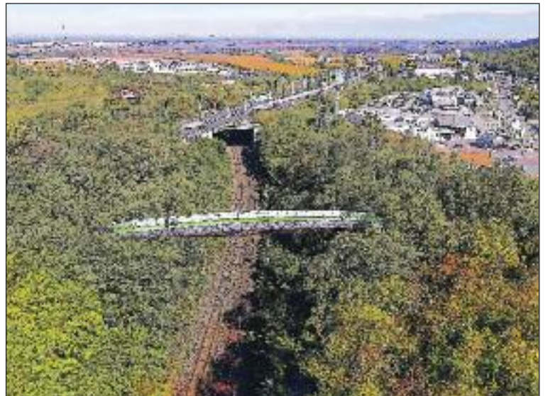
Vizualizácia cyklolávky Dúbravka - Lamač.

„Cyklo doprava je veľmi lacný a oproti autám ekologický spôsob dopravy. Skúsenosti, napríklad zo Škandinávie, ale aj množstvo výskumov ukazujú, že ľudia, ktorí vymenili auto za bicykel