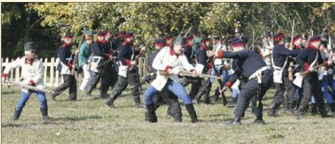
Rekonštrukcia Bitky pri Lamači. Zrážka rakúskej (biele kabátce) a pruskej pechoty na bodáky.