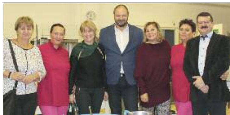
Návšteva v jedálni ZŠ Pri kríži so štátnou tajomníčkou (v strede so zelenou šatkou).