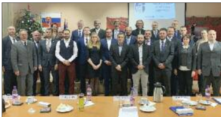
Miestne zastupiteľstvo a mestskí poslanci za Dúbravku na spoločnej fotke.

schválili tiež rady v základných a materských školách a plat starostu mestskej časti.