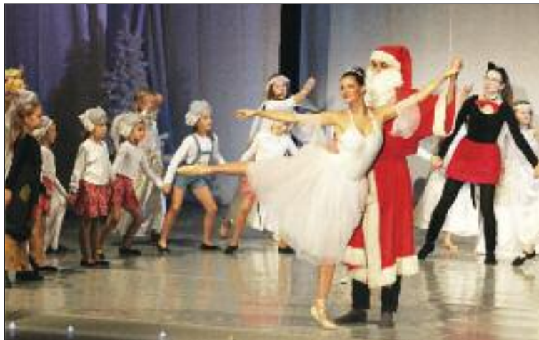
Záverečný tanec Santa Clasa, rusalky, čerti a ostatné rozprávkové bytosti.