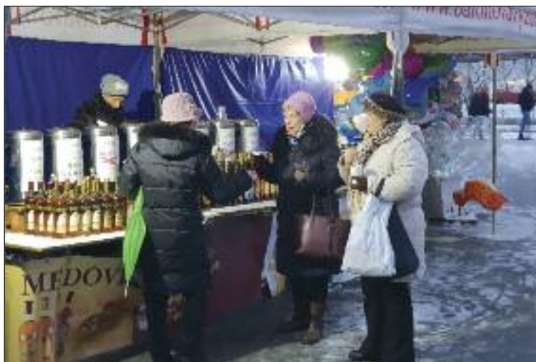
K tradičným stánkom patrilo varené víno aj medovina.