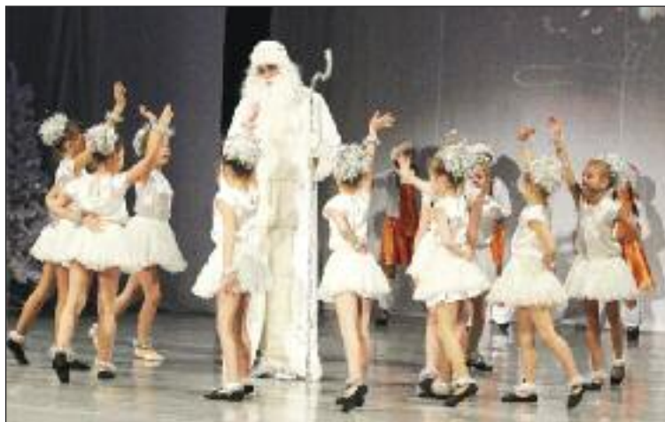
Svätý Mikuláš s vílami v podaní žiakov ZUŠ Alkana a študentov muzikálového konzervatória začiatkom decembra.