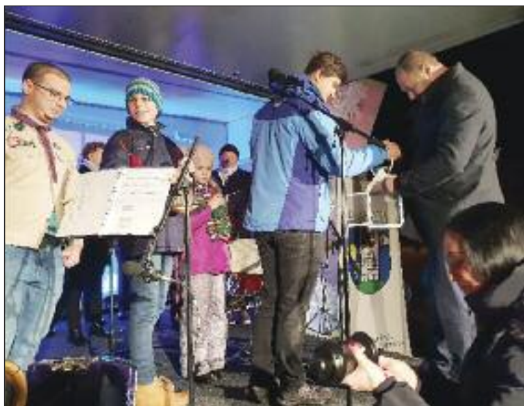
Svetlo na podujatie priniesli dúbravskí skauti Biele Delfíny.