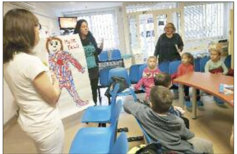
Deti z Materskej školy Galbavého na exkurzii na Kramároch.