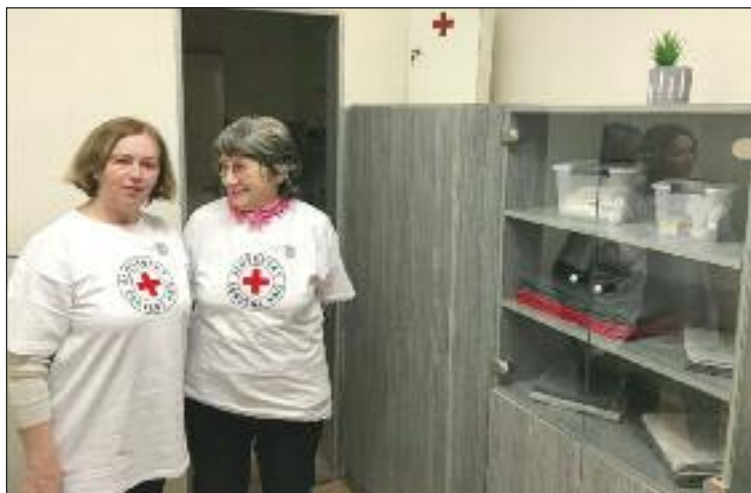
Počas roku 2018 mestská časť úspešne zriadila miestnosť prvej pomoci v dome kultúry.

Do nového roka vykročil Miestny spolok s ďalšími plánmi činnosti. V roku významných červenokrížskych výročí chce pokračovať už v rozbehnutých aktivitách a pridáva si nové. Tie sú zamerané na užšiu spoluprácu s deťmi a mládežou.