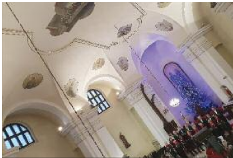
Koncert je aj jedinečnou šancou prezrieť si "starý" dúbravský kostol zasvätený svätým Kozmovi a Damiánovi.