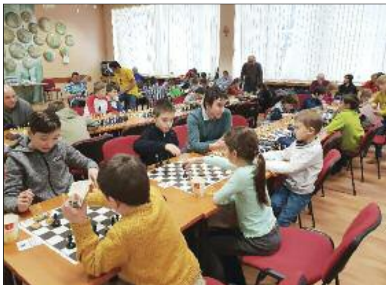
Prvá januárová sobota patrila tradičnému Trojkraľovému open rapid turnaju v šachu.