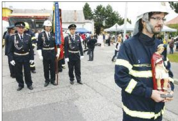
Dúbravskí dobrovoľní hasiči pri oslavách ich patróna sv. Floriána.

Minimálny počet je 1+3, pri požiaroch, kde môže dôjsť aj k nejakému poškodeniu zdravia ľudí sa vysielajú väčší počet ľudí. Máme k dispozícii vlastnú hasičskú sanitku, ktorá je vysielaná skoro na všetky zásahy, pretože často treba poskytnúť ľuďom, prípadne aj