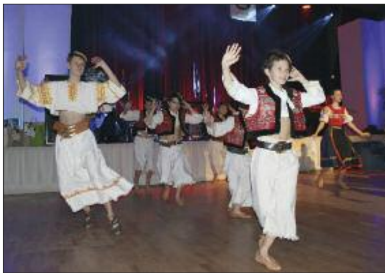
V programe nechýbala energická Klnka.