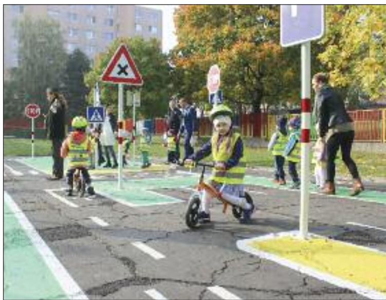
Dopravné ihrisko slúži deťom z MŠ Cabanova a aj verejnosti.

Snáď najvýznamnejšou a určite najkreatívnejšou formou financovania neziskovej organizácie je získavanie prostriedkov z grantových výziev