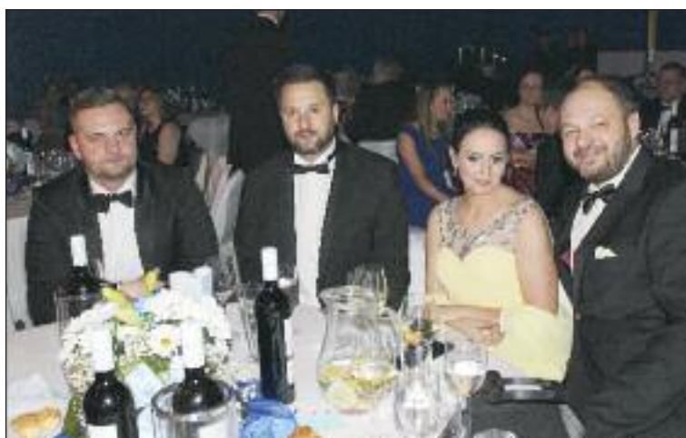
Pozvanie na Dúbravský fašiangový ples prijal aj primátor Matúš Vallo.