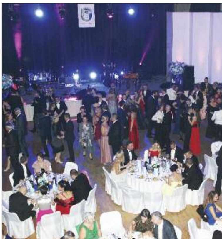
Dom kultúry sa prezliekol do plesového šatu...