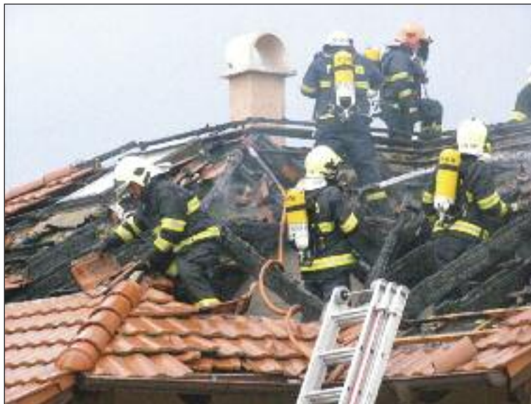
Hasiči pri zásahu na streche domu.

Toto je pomerne komplikovaná situácia, ale stretávame sa s ňou. Dávnejšie sme mali aj v našej mestskej časti na ulici Ľuda Zúbka takýto prípad bytového požiaru, kde dym z požiaru bytu na druhom poschodí stúpala do vrchných častí obytných priestorov. Dym, respektíve spodiny, ktoré vznikajú pri požiare sú toxické, aj teplota býva pomerne veľmi vysoká. Ak v takomto prípade ľudia vstúpia do spoločných priestorov bytového domu s viacerými podlažiami, vzniká tu tzv. komínový efekt. V takýchto situáciách sa odporúča nevychádzať z bytu, utesniť si dvere vlhkou handrou a čakať na príchod hasičskej jednotky. Je to z jednoduchého dôvodu, ak človek vyjde na chodbu, sú tu spodiny horenia, ktoré sú toxické ako napríklad oxid uhoľnatý, ktorý necitíme a nevi-