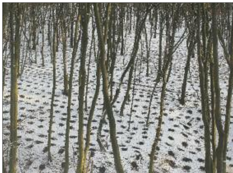
Land Art v dúbravských lesoch vyvolal veľké reakcie,

Napadol sneh, a to ma väčšinou vyprovokuje. Nesmie však napadať veľmi veľa snehu. Tak akurát (smiech).