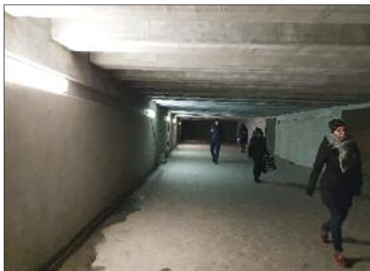
Rekonštrukcia podchodu Saratov sa predlžuje, dodávateľ nevie technicky vyriešiť bezbariérovosť vchodov.

Podľa mňa už samotný názov Centrum voľného času nie je pre mládež lákavým. Centrá voľného času fungujú najmä poobede a s deťmi od asi 7 rokov. Myslím, že keď chceme pracovať s mládežou, chceme robiť niečo v rámci drogovej prevencie, je dôležité pracovať s mládežou staršou než 12 rokov. To by som chcel s riaditeľkami centier voľného času prejsť a hľadať možnosti, ako by sme vedeli dať priestor mládeži. Ten dopyt som cítil už počas kampane, deti, ktoré nie sú organizované v športových kluboch, majú málo možností ísť napríklad do klubovne a robiť si, čo ich baví. Mal som tiež predstavu, aby centrá voľného času fungovali aj doobeda, napríklad pre rodičov s malými deťmi, alebo pre deti, ktoré sa nedostali do materských škôl, čo teda nie je prípad Dúbravky. No ešte sa v činnostiach centier musím zorientovať, spoznať, akí ľudia, deti ich navštevujú. Centrá fungujú podľa zákona o centrách voľného času, zákon presne diktuje, čo môžu a čo nemôžu, mesto však dostáva peniaze na mládež a tie rozde-