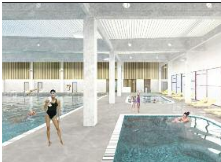
Plánovaná Plaváreň Bory.

Plaváreň Bory má byť súčasťou fitness klubu. Pre vstup sa bude musieť človek zaregistrovať, potom