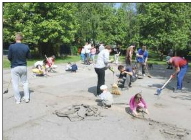
Príkladom spojenia združenia rodičov, mestskej časti a grantu je dopravné ihrisko pod Materskou školou Cabanova. Stav počas brigády.