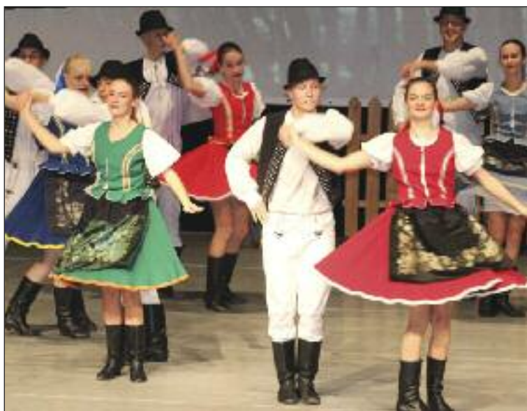
Klnka oslavovala, ako inak, tancom.