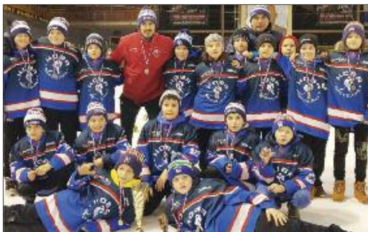
V tejto zostave obsadili piataci HOBY na hokejovom turnaji v Trenčíne druhé miesto.