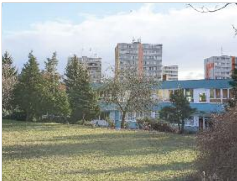
Základná umelecká škola v Dúbravke funguje v škole na Batkovej.