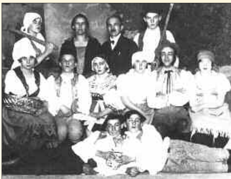
Dobrovoľný požiarň zbor rozvíjal aj ochotnícku divadelnú činnosť. V dvadsiatych rokoch minulého storočia bol obľúbenou hrou aj Kamenný chodník.

rozvíjala kultúrna činnosť. Usporiadávali zábavy na Silvestra a na Trojicu, keď obcou prechádzala procesia Božieho tela. Na procesii išli hasiči v unifórmach v štvorstupoch, neskôršie v trojstupoch. Tieto zábavy boli obľúbené nielen u Dúbravčanov, ale chodila na ne aj mládež z okolitých dedín. Okrem toho hasiči ochotnícky nacvičili vyše dvadsať divadelných hier, ktorých zoznam sa zachoval v Pamätnej knihe.