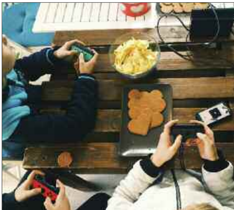
Klub pre mladých je k dispozícii každý pondelok od druhej do piatej.