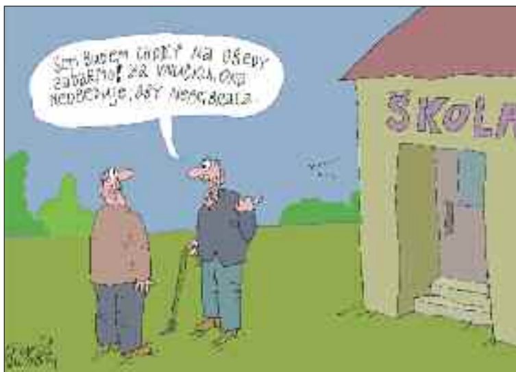
Karikatúra: Mikuláš Sliacky