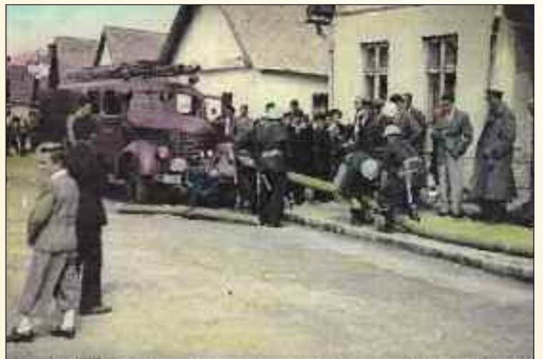
Cvičenie hasičských družstiev: príprava nasávacieho vedenia na Jadranskej ulici v starej Dúbravke v päťdesiatych rokoch minulého storočia. V tom čase dúbravskí hasiči používali hasičskú Pragu RN (Rýchly Nákladný), stredný nákladný automobil vyrábaný automobilkou Praga od roku 1933.