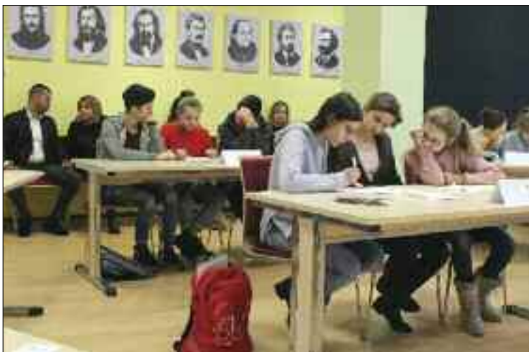
Súčasťou súťaže Test národa bolo aj určenie mien štúrovcov podľa predložených portrétov.

Päť trojčlenných súťažných družstiev z dúbravských škôl sa stretlo na škole Pri kríži na tradičnom podujatí Test národa. Osem kôl otázok malo preveriť vedomosti a pripravenosť žiakov siedmich a ôsmich ročníkov v oblasti dejín Slovenska od najstarších čias po dnešok.