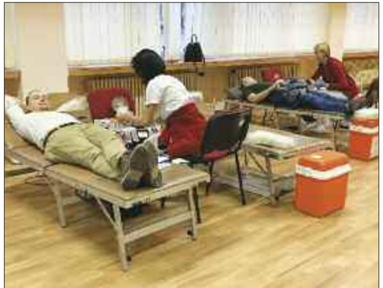
Mestská časť organizuje hromadné odbery krvi už piaty rok. Vo februári prebehol odber pri príležitosti Valentína.

Stalo sa, že ste spätne kontaktovali darcu krvi, pretože sa mu našiel v krvi vírus? Stalo sa. Mali sme jeden prípad, kde sme zachytili darcu, ktorý bol HIV pozitívny. Krv sa nepodala. Darca bol navždy vyradený z registra darcov. Darca sme museli zahľásiť na Regionálny ústav verejného zdravotníctva, na hygienu, na infektologické pracovisko a v sprievode mladého lekára išiel do ambulancie, kde mu všetko vysvetlili a poučili ho. Treba apelovať však aj na darcov, ak o sebe vedú, že