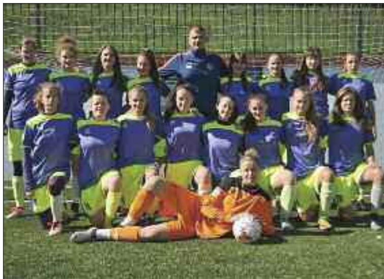
Naše dievčatá vyhrali všetkých jedenásť stretnutí, strelili v nich 62 gólov a inkasovali iba dva.