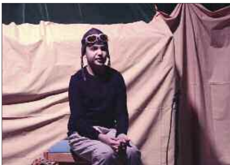
Z muzikálového predstavenia Malý princ pre dospelých, ktorí nikdy neprestali byť deťmi.

Ruže i had, knihovník i letec, a hlavne Malý princ. Prišli nám porozprávať svoj príbeh. Príbeh o priateľstve i hľadaní, príbeh o dospelých a deťoch, príbeh o všetkých tých veciach, ktoré naše oči nevidia, ale uvidíme ich srdcom.