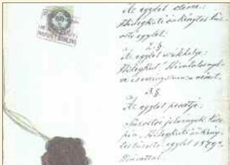
Rukopisná verzia stanov s pečiatkou uhorského ministerstva vnútra dokazuje, že Dúbravský dobrovoľný hasičský zbor vznikol v roku 1879. Dokument je uložený v budapešťianskom ústrednom archíve.

Zachované zápisy svedčia o pestrej činnosti hasičského zboru. Okrem pomoci pri kalamičných situáciách sa