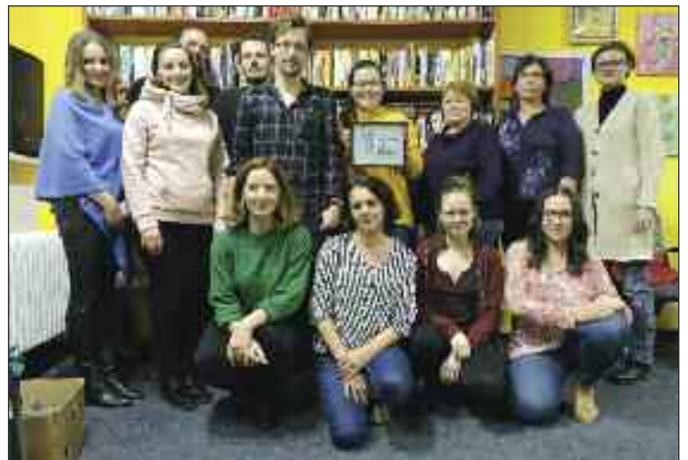
Dúbravskí „knihomoli“ na stretnutí v Centre rodiny

Knihy nevyberáme žiadnym špeciálnym kľúčom, vždy sa ale snažíme venovať literatúre kvalitnej, alebo aspoň takej, ktorá vzbudí živú a zaujímavú diskusiu.