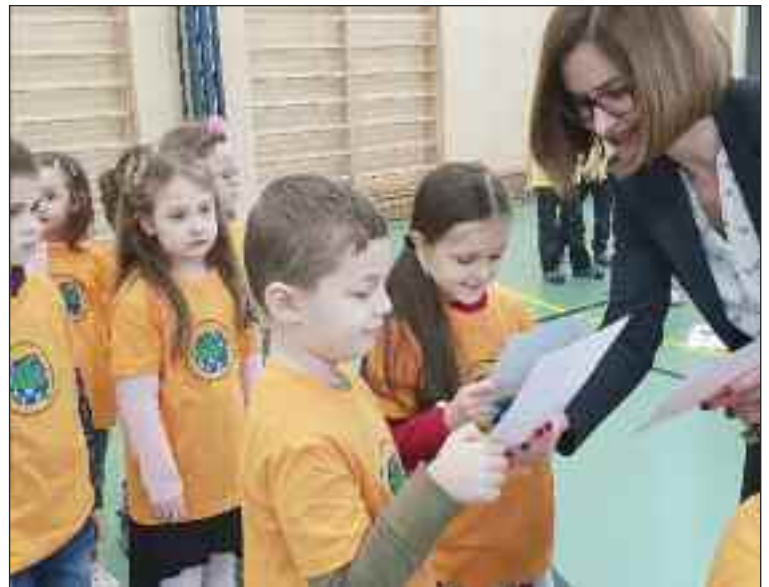
Slávnostná imatrikulácia spojila tri triedy aj tričká troch farieb.

Dúbravka má štyri základné školy, ktoré zriaďuje mestská časť a tri, ktoré patria iným zriaďovateľom – špeciálna, súkromná a britská. Základná škola Pri kríži je škola s najväčším počtom žiakov, zápisy budúcich prváčikov budú 16. a 17. apríla. (lum)