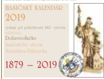
Titulná strana kalendára, ktorý v spolupráci s Dúbravským múzeom vydal Dobrovoľný hasičský zbor v Dúbravke k výročiu svojho vzniku.