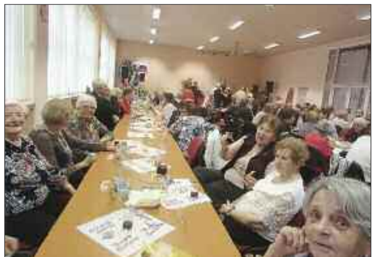
Fašiangové posedenie Denného centra 3.

Potom nasleduje 40 dňový pôst až do Veľkého piatku. (bž, red)