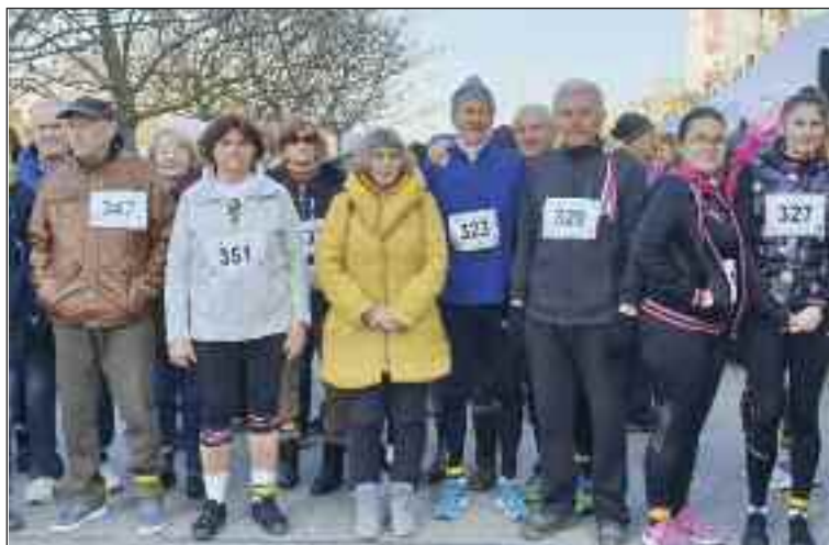
Novinkou v tomto roku bola chôdza a detský beh.