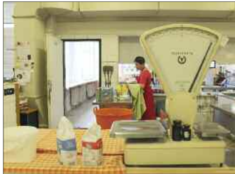
Kuchyňa Základnej školy Pri kríži.