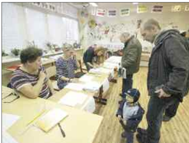
Naposledy sa volebné miestnosti zaplnili počas novembrových komunálnych volieb.

Batkova, Landauova, Bazovského, Červeňáková, Bagarova, Beňovského, Bošániho, Damborského, Nemčíkova, Bullova, Lipského, Polianky, Harmincova, Húščavova, L. Zúbka