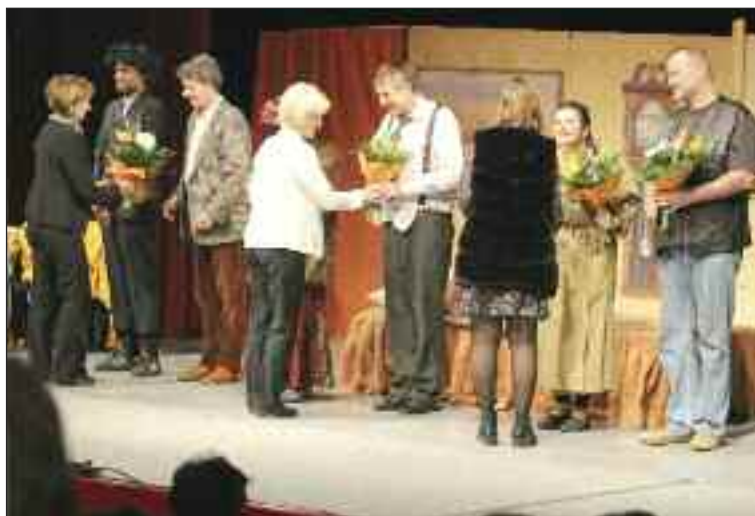
Pod'akovanie za skvelý herecký výkon.