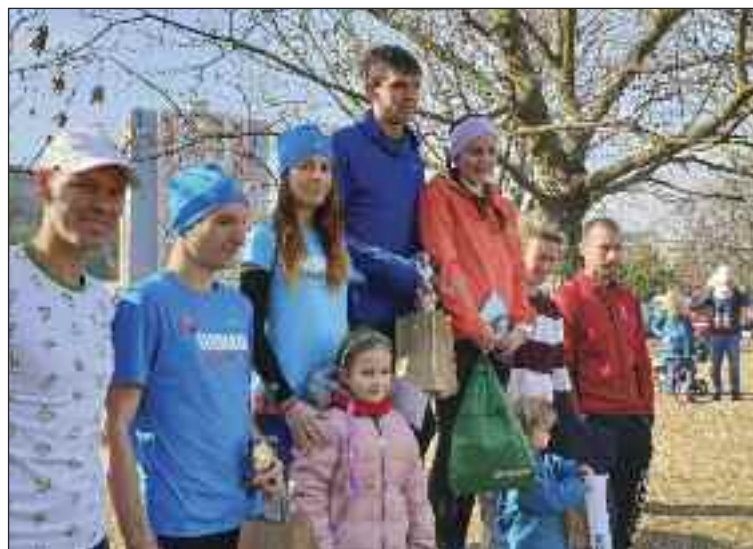
Víťazi trasy 5 + 5 kilometrov s olympionikom Matejom Tóthom.

Matej Tóth prišiel so svojim povestným úsmevom, šiltovkou na hlave a ochotou odpovedať na otázky. Prezradil nám, že jeho bežný deň je „tréningový“, v ktorom tréningy a pohyb strieda s regeneráciou. „Pohyb je moja profesia, ak je taký celý deň, je to ideálne,“ povedal olympionik.