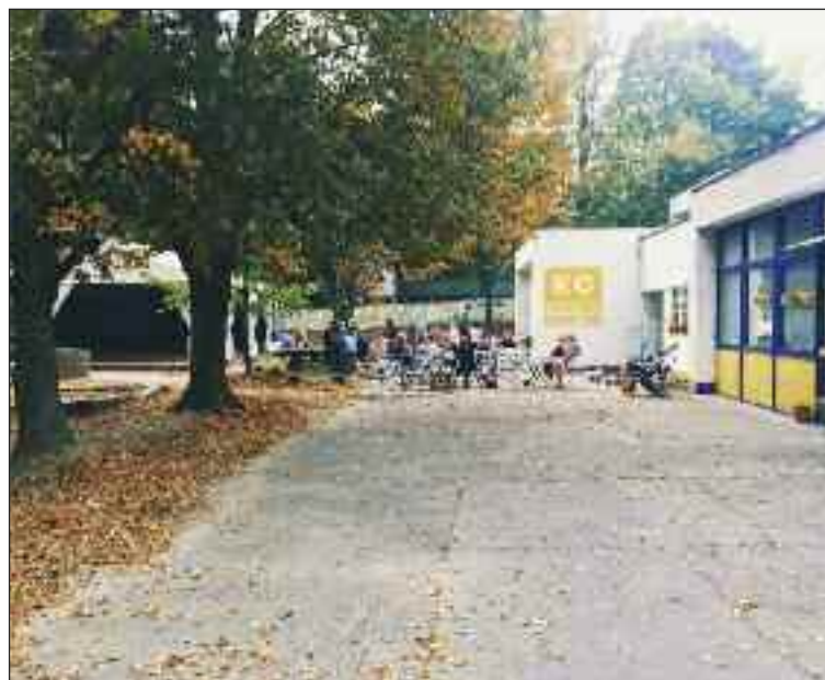
Káčečko alebo Klub pre mladých funguje v priestoroch na Bagarovej 20.

Klub je určený mladým ľuďom od 11 do 15 rokov a má im naozaj čo ponúknuť. Možností je viac podľa predstáv a záujmov. Dá sa tu len stretnúť a pokecať s kamarátmi, čo ich trápí, alebo si zahrať počítačovú či spoločenskú hru, fotiť s digitálnym fotoaparátom alebo pozerieť dobrý film. Mobily a sociálne siete sú pre mladú generáciu samozrejmosťou. Na