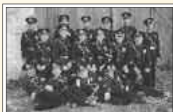
Dúbravskí hasiči čítajú štáty a anglické učebnice v 19. storočí

Dúbravský protipožiarň zbor bol založený v roku 1879. V tom čase mali hasiči jednu ručnú striekačku ťahanú koňmi a jeden veľký sud na vodu, ktorý bol z bezpečnostných dôvodov stále naplnený, pretože vody bolo málo. V obci boli dve obecné studne, jedna pod kostolom sv. Kozmu a Da-