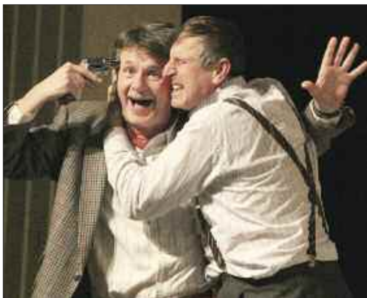
Marc a Luc sa počas celej hry striedavo pokúšajú spáchať samovraždu.