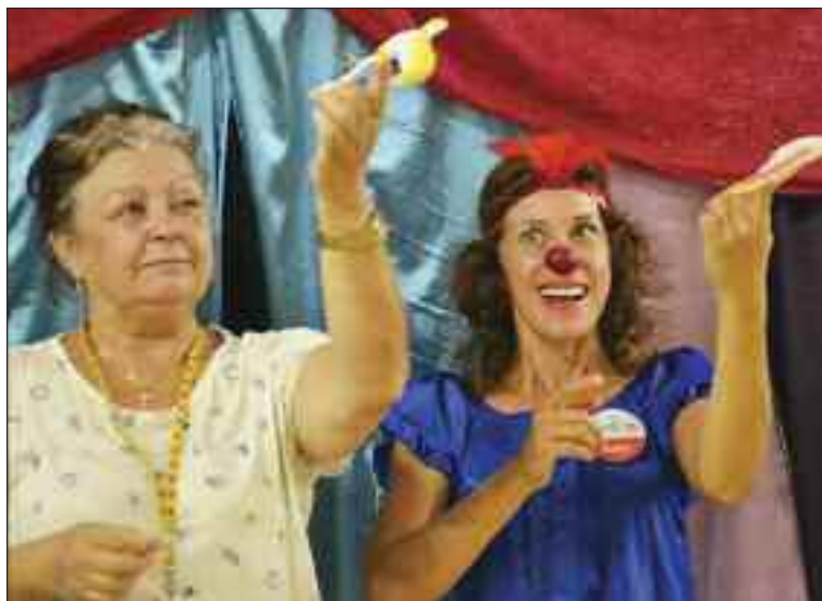
Varieté so seniormi v domove na Hanulovej ulici.

„Zmyslom tohto projektu je dať seniorom priestor a možnosť zažiť, ukázať, čo dokážu, užiť si svoj potlesk a