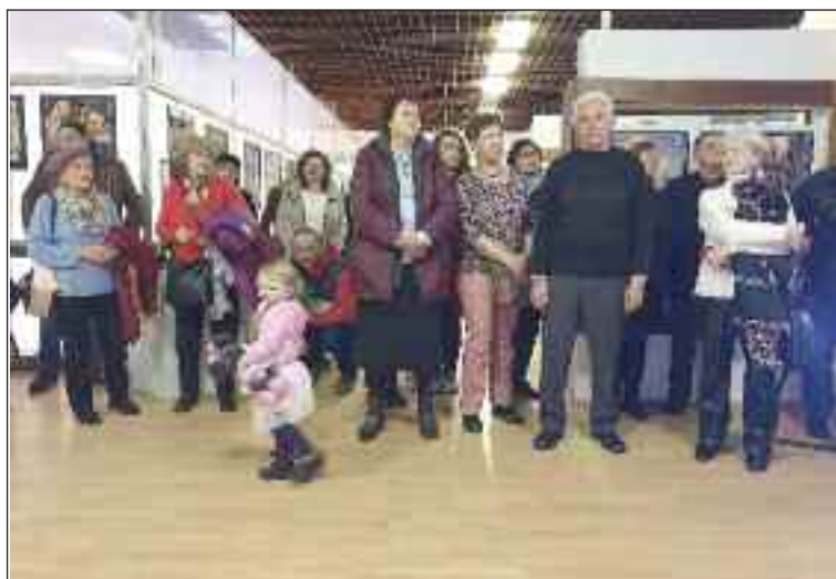
Výstavu fotografií si možno pozrieť v Galérii Domu kultúry Dúbravka do polovice apríla.

Všetci autori fotografií si odniesli nové knižky o Dúbravke a najúspešnejší aj drobné „dúbravské“ darčeky v podobe knižky.