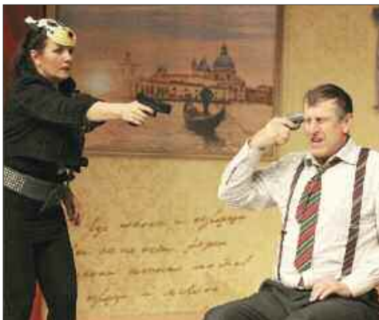
Samovrahov prepadla trojica lupičov, ktorým na úteku "skapalo" auto.