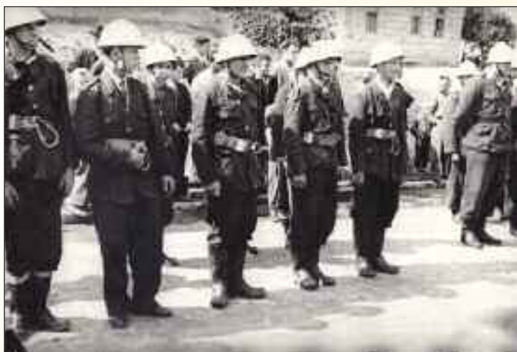
Dúbravskí hasiči v sedemdesiatych rokoch minulého storočia pri cvičení na Jadranskej ulici.

na území Slovenska. Vznikla tiež Dobrovoľná požiarňa ochrana Slovenskej republiky zastrešujúca dobrovoľné, mestské a obecné hasičské zbory. Okrem toho boli v mnohých firmách a dopravných spoločnostiach zriadené závodné hasičské zbory a jednotky.