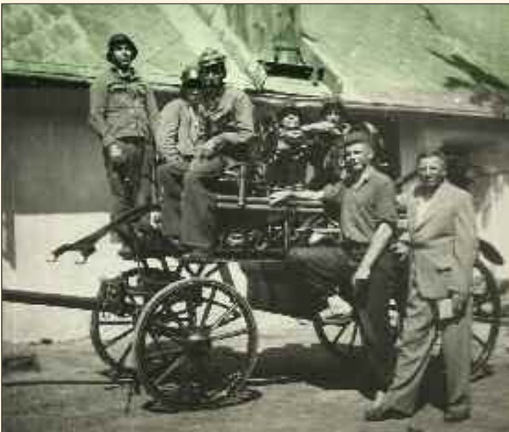
V roku 1930 bola pre dúbravských hasičov z obecných peňazí za 15-tisíc korún zakúpená koňmi ťahaná hasičská strikačka s vahadlom na ručný pohon.

Po vzniku Československej republiky v roku 1918 bol založený Zväz dobrovoľného hasičstva Československa. Dobrovoľné hasičské zbory na území Slovenska zastrešovala Slovenská zemská hasičská jednotka, založená roku 1922 v Trenčíne. Tá združovala roku 1939 až 3 221 dobrovoľných hasičských zborov s 65 471 členmi. Profesionálne zbory boli vo vtedajších časoch zriedkavé (len v niektorých veľkých mestách), najčastejšie boli