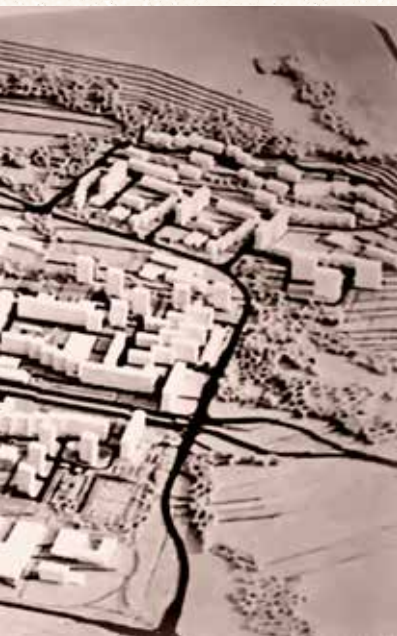
...ho či dom kultúry je prázdne, riešilo sa dodatočne.