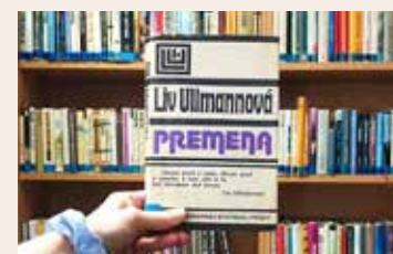
PREMENA - Liv Ullmannová

V prípade, že chcete knihy podarovať, napíšte email, my sa na tituly pozrieme, bohužiaľ, máme obmedzené skladovacie kapacity a nemôžeme poskytnúť domov všetkým knižkám. Ďakujeme.