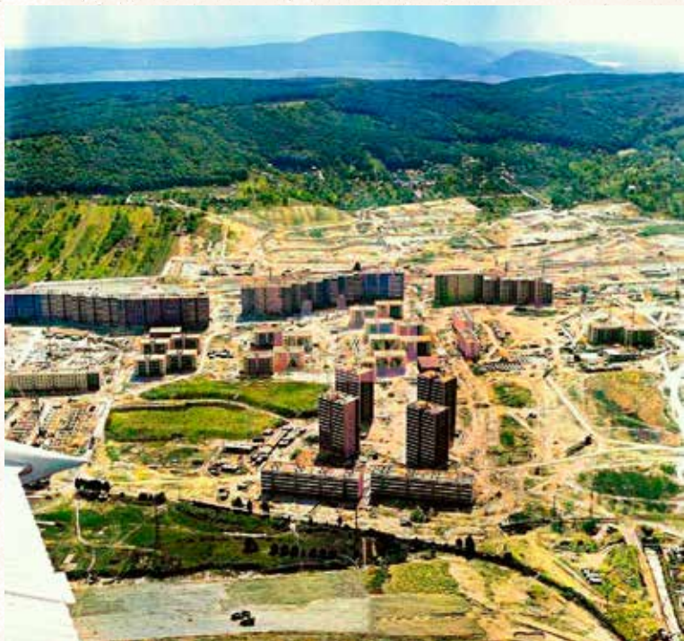
Dodatočne kolorovaná mimoriadne vzácna letecká snímka Karola Belického z roku 1970 zachytáva prvú fázu výstavby, teda sídlisko Záluhy I, konkrétne ulice (zľava) Beňovského a Bagarovu a budúci Park Družby. V strede vodorovne „čínsky múr“ na Bošaniho a Luda Zúbka. Za hlavnou osou (budúca Sch. Trnavského) vidieť splanirované stavenisko pripravené pre Záluhy II.

Nasmerovanie hromadnej bytovej výstavby na západ pre konfiguráciu terénu a zaujímavé prírodné prostredie (vzduch, lesy, Devínska Kobyla, Záhorská nížina) umožnilo dosiahnuť lepšie architektonické i urbanistické výsledky ako napríklad v Ružinove.