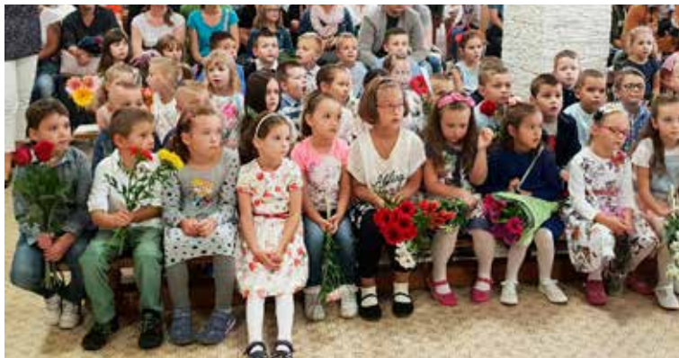
Prváci na ZŠ Pri kríži.

Dúbravka má štyri základné školy, ktoré zriaďuje mestská časť a tri, ktoré