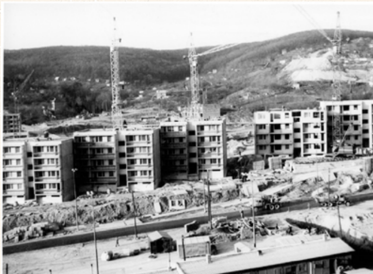
Pohľad z okna bytu na dnešnej Landauovej ulici na výstavbu bytových domov na Galbavého ul. (Záluhy 2).

Urbanisticky bola osnova sídliska určená osami dvoch súbežných komunikácií – mestskou komunikáciou M. Schneidra Trnavského a diaľnicou D1. Rovnobežne s mestskou dopravnou tep-