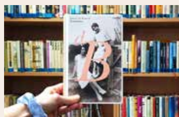
NEROZLUČNÉ - Simone de Beauvoir

Kontakt: Miestna knižnica Dúbravka Sekurisova 12 | 841 02 Bratislava kniznica@dubravka.sk | kultura@dubravka.sk