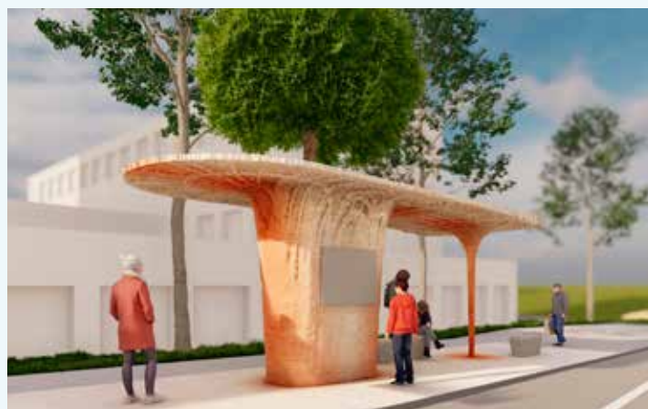
Plánovaná umelecká zastávka.

Od výtvarného umenia prešiel okolo roku 2000 k architektúre a vo firme So Concrete čerpá zo svojich predchádzajúcich skúseností z robotickje 3D tlače z betónu. Projekt zastávky bude tak unikátnou príležitosťou aplikovať toto pomerne nové technologické riešenie. Jednotlivé fragmenty zastávky sa vytlačia v Prahe a následne prevezú a spoja v jeden celok na Slovensku. (lum)