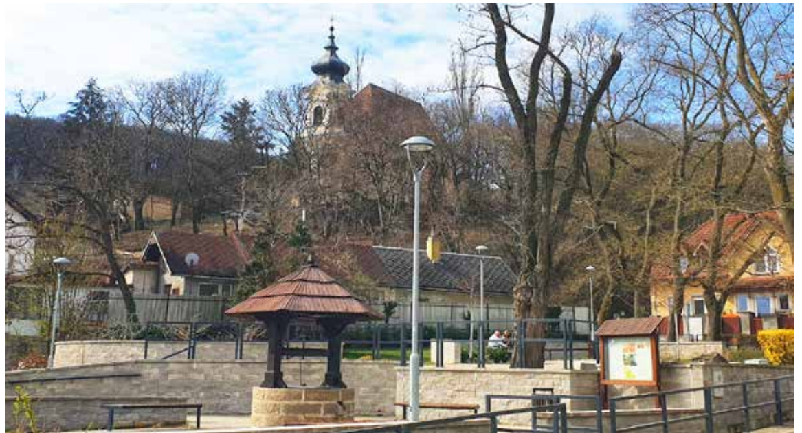
Druhá tabuľa náučného chodníka pri Horánskej studni.

Ďalej cesta smeruje cez Dúbravku do lesa. Oficiálny chodník vedie po vybetónovanej ceste, avšak nejaký miestny dobrodinec na zmätanie nepriateľa farbou vlastnoručne prikreslil znaky žltej trasy cez úzky chodník v lese, paralelný s cestou. Je možné, že niekomu vadili. Nápad ísť viac v prírode po paralelnej ceste by síce nebol zlý, ale cesta vedie okolo miestneho smetiska. Amatérske značky je pomerne ľahké rozpoznať, keďže nespĺňajú parametre turistických značiek a roztekajú sa.