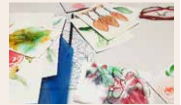
Výtvarný workshop o akvarelovej technike.

Tvorenie sa spája aj s ďalšou výtvarnou aktivitou, ktorej výsledky sa ukážu v apríli na výstavke Miestnej knižnice na Sekurisovej. Knižnica spolu s Dúbravskými novinami vyhlásili výtvarnú súťaž pre deti zo základných škôl pod názvom Vytvor komiks. Diela zbierala redakcia novín do konca marca. (lum)