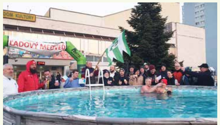
Bazén stál pred Domom kultúry Dúbravka.

Atmosféra napriek chladnému vetru a vode nebola mrazivá, ale priateľská, športová... (lum)