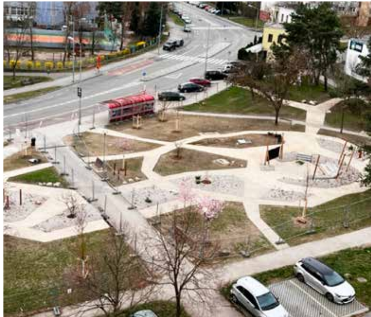
Pohľad na lúku zhora.

Projekt Metropolitného inštitútu je súčasťou Programu obnovy verejných priestorov Bratislavy. Priestor za zastávkou Homolova si mesto podľa Schmuckovej vybralo pre jeho veľký potenciál, s cieľom zatriktívniť zelenú plochu a poskytnúť pobytovú funkciu