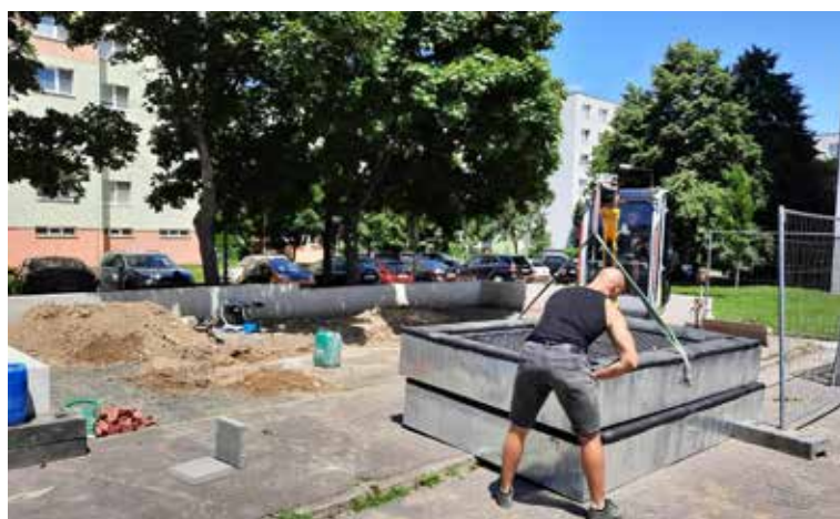
Osádzanie nových trampolínek na ihrisku Bublinka na Ožvoldíkovej.

Veľkou zmenou prechádza areál pri Strednej priemyselnej škole Karola Adlera. Bratislavský samosprávny kraj tu buduje moderné športovis-