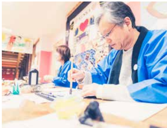
Tvorivé dielne na Festivale sakúr a umenia.