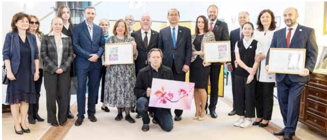
Slávnostný program na pôde Japonského veľvyslanectva spojený s odovzdávaním cien.

F estival sakúr a umenia priniesol viaceré projekty a samostatné podujatia, vychádzky po stopách sakúr v Bratislave, maľovanie stromov žiakmi základnej umeleckej školy i verejnosťou, fotosúťaž a festivalový celodenný program, naplnený umením a remeslami. Spoznať sa dala výroba papiera, kreslenie i maľovanie sakúr, kaligrafia, strihanie bonsajov, tanec, hudba, bojové umenia a aj výučba japonských tradičných stolových hier. A hoci sa festival a jeho sprievodné podujatia skončili, niečo ostalo. A nie je to len mapa krásnych, japonských stromov po Bratislave.