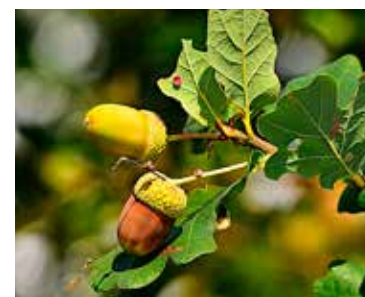
Dub mohutný a silný.

Dub sa spája s obdobím 10. jún – 7. júl, kľúčové slová sú nadšenie, optimizmus, rozhodnosť a dôstojnosť. Dub je známy svojou odolnosťou a dlhovekosťou, je oddávna spájaný so silou a stálosťou.