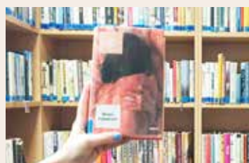
MIEKO KAVAKAMI Letný príbeh

Leto, dovolenka. To je aj čas pre seba, čas na knihu. Čítanie na pláži, záhrade, balkóne či v električke však ani počas leta nemusí byť len oddychové. Na Oddelení pre dospelých v miestnej knižnici sme pre vás vybrali tri knižné tipy na prázdninové čítanie, ktoré sú „horúce“ svojimi témami či spracovaním.