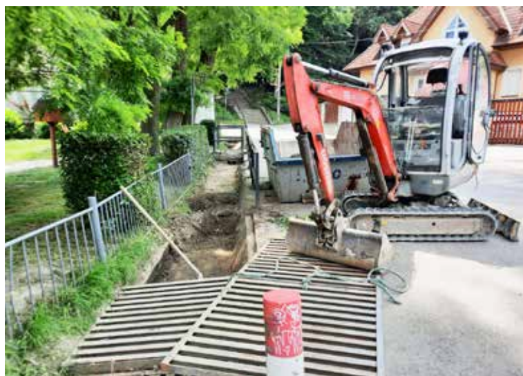
Čistenie rigolov a zdrží pri Horanskej studni.

Mestská časť v dome kultúry tiež vymieňala svetlá. Medzi najbližšími