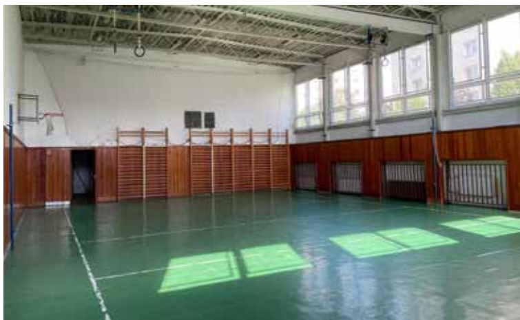
Malú telocvičňu na Základnej škole Nejedlého čaká veľká rekonštrukcia.

Dúbavčania sa tak dostanú rýchlo a jednoducho k informáciám a navyše kedykoľvek potrebujú. Rady tu nájdu aj návštevníci mestskej časti, turisti. Tabuľu v testovacej prevádzke už môžu obyvatelia vyskúšať.