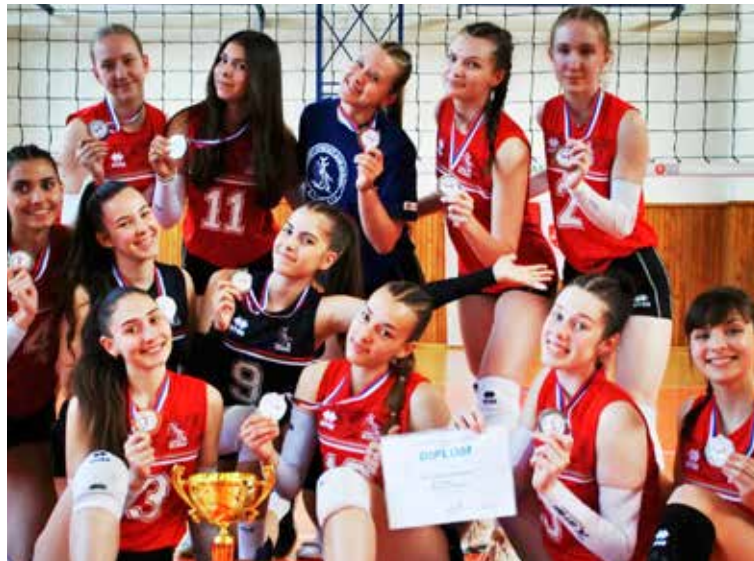
ŠŠK Bilíkova strieborná vicemajsterka Slovenska.

STARŠIE ŽIAČKY: Po minuloročnom piatom mieste skončili staršie žiačky ŠŠK Bilíkova tentoraz na bronzovej priečke. Základnú časť v skupine Bratislava vyhrali suverénne, keď v 36 stretnutiach ani raz nenašli premo-