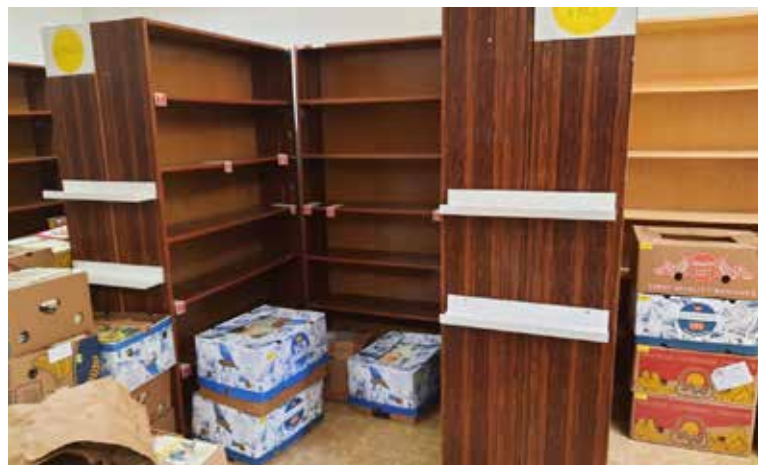
Príprava na rekonštrukciu detského oddelenia v miestnej knižnici.