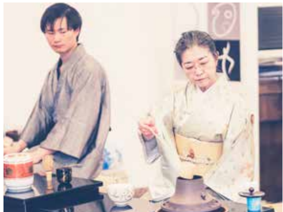
Tradičný čajový obrad počas festivalu.