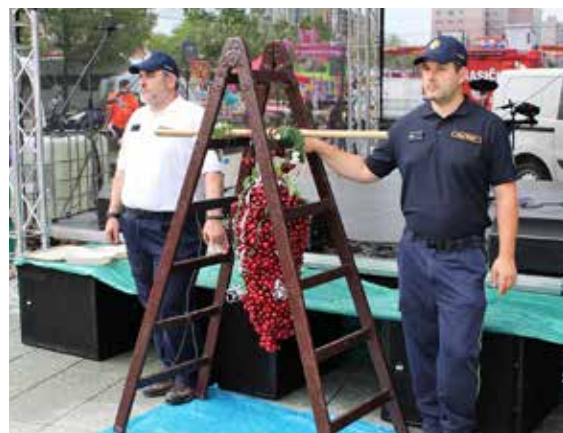
K juniálesu a tradíciám patril aj čerešňový stravec.