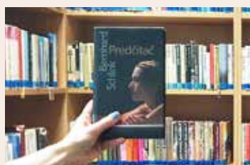
BERNARD SCHLINK Predčítač

Knižka síce opisuje horúce letné dni v Tokiu, no zďaleka nie je ležérnym prázdninovým príbehom. Hlavnou hrdinkou je tridsaťročná Nacuko, ktorá otvára viaceré aktuálne témy. Umelé oplodnenie či darcovstvo spermii od anonymného darcu. Kniha získala mnohé ocenenia, New York Times ju označil za jednu z 10 najlepších kníh roku 2020. Chválami nešetril ani známy Haruki Murakami: „Letný príbeh mi vyrazil dych!“