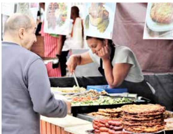
Festival sprevádzalo aj dobré jedlo a zábava.

Podvečer na pódiu pred domom kultúry patril hudbe, dvojici J&G Brothers a neskôr slovenskej rockovej