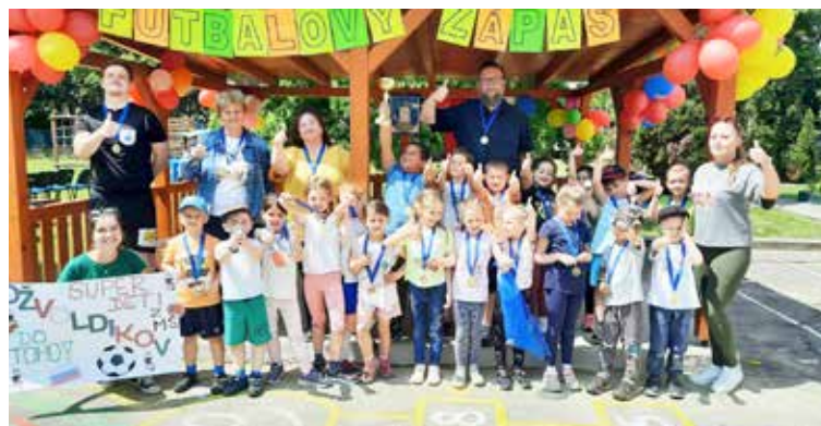
Víťazili napokon deti MŠ Ožvoldíkova.

Diváci odchádzali bohatší o zaujímavé informácie a žiaci sa počas priprav projektov naučili, ako získavať informácie, triediť ich, selektovať, vytvoriť plán prezentácie alebo riešiť problémy. (lum)