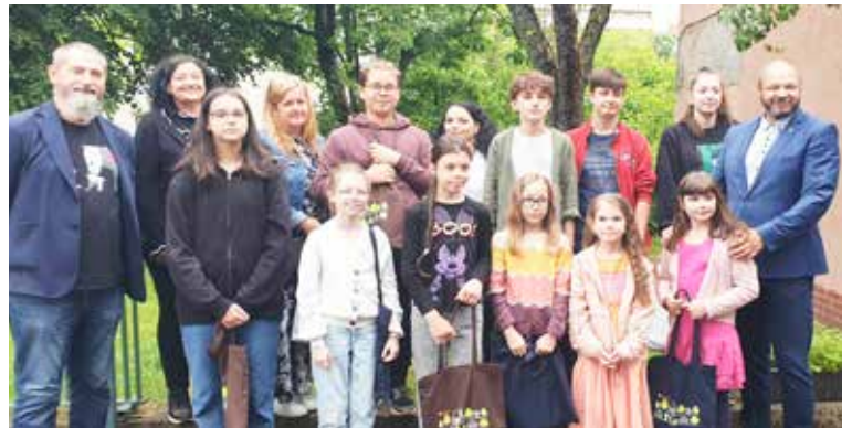
Ocenení tvorcovia komiksov pred miestnou knižnicou.

počas návštevy Miestnej knižnice na Sekurisovej v minigalérii na schodoch a budú sa dať pohodlne pozrieť aj po rekonštrukcii detského oddelenia knižnice, ktoré sa začalo. Oddelenie je