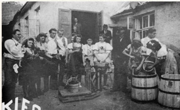
Váženie čerešní na dvore krčmy U Zajička, teda U Bary, teda U Husáka. Zber čerešní v Dúbravke. Štylizovaná fotografia pre bratislavskú reklamnú agentúru KIFO rok 1946.