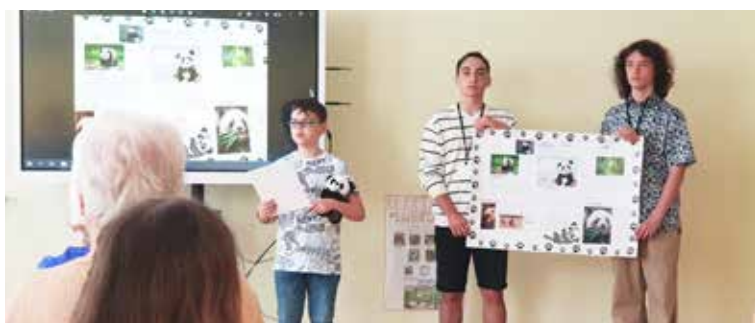
Projekty mali rôzne témy aj formy prezentácie

Do konca mája tradičná konferencia žiackych projektov. Opäť umožnila žiakom spoznať a prezentovať samého seba, svoje schopnosti a výsledky vlastného výskumu.