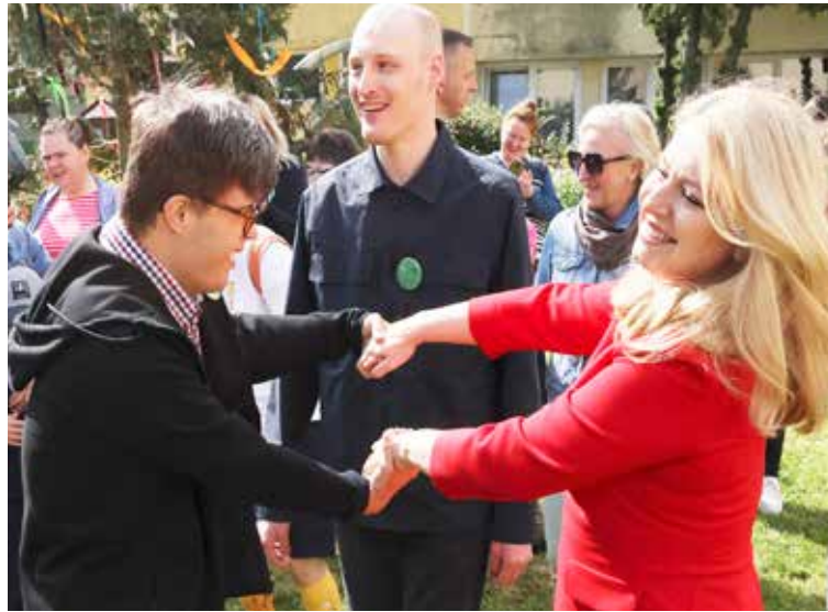
Zuzana Čaputová na návšteve u Matulaya.

Návšteva prezidentky v Dúbravke sa začala predstavovaním zariadenia na Lipského. Zuzana Čaputová prešla dielňami centra – drevárskou, textil-