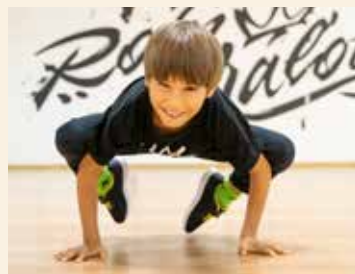
Počas leta bude aj tanečný workshop so Školou Breaku.