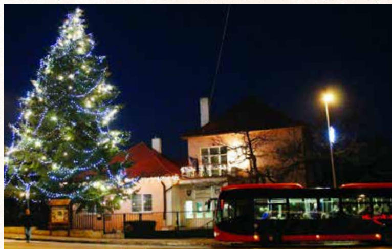
Vyzdobený stromček pred Miestnym úradom.

Seno potom položil pod stôl. Po večernom zvonení zapálili v izbe sviečku a rodina zasadla k večeri. Spoločne sa pomodlili, gazda požehnal jedlo, nalial všetkým dospelým a starším deťom víno a predniesol prípitok.