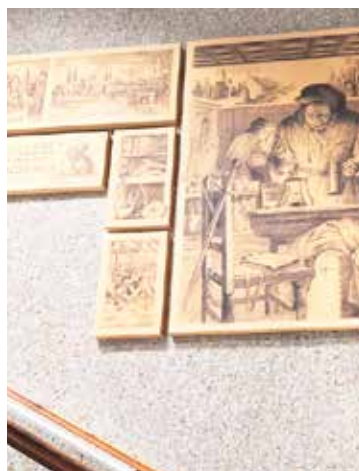
Diela na chodbách Zdravotného strediska Paracelsus.

Každá ambulancia má individuálny prístup k manažovaniu pacientov. Niektoré ambulancie nemajú žiadny systém, iné využívajú portály návšteva lekára, respektíve topdoktor. Zásadne to zlepšuje organizáciu pacientov a