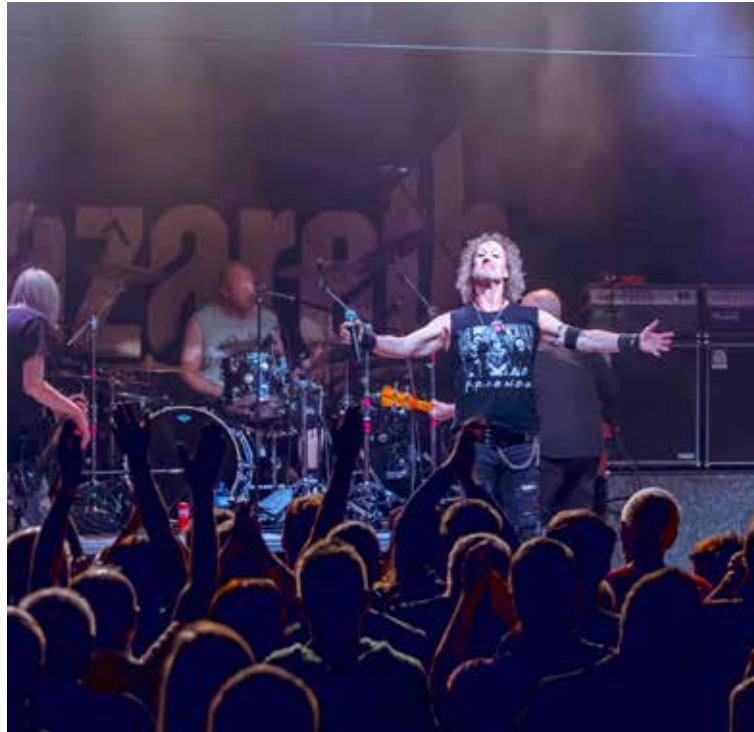
Legendárna rocková skupina v dome kultúry.

Okrem Dúbravky sa ikona škótskej rockovej hudby predviedla na dvoj-