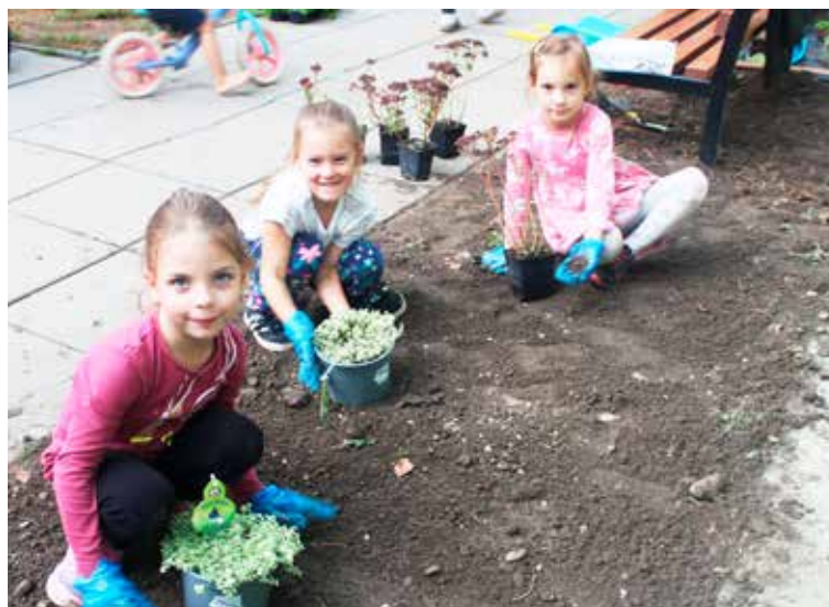
Skrášľovanie areálu materskej školy.