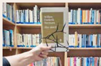
WILLEM FREDERIK HERMANS Slzy akácií

Jeseň nemusí byť len sivá, depresívna. S novými knihami sú aj dlhé tmavé večery „svetlejšie“. Vďaka grantom a dotáciám pribudli v Miestnej knižnici na Sekurisovej viaceré novinky, ktoré po evidencii nájdete na poličkách. Aktuálne sme vybrali tri nové knižky z oddelenia pre dospelých.