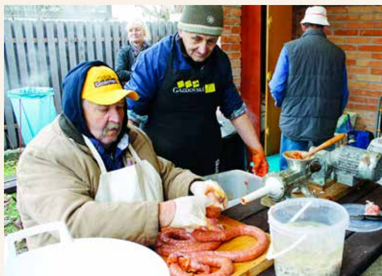
K zimnému obdobiu neodmysliteľne patrili aj zabíjačky. V Dúbravke sa už dve desaťročia koná Dúbavský klobásový festival.