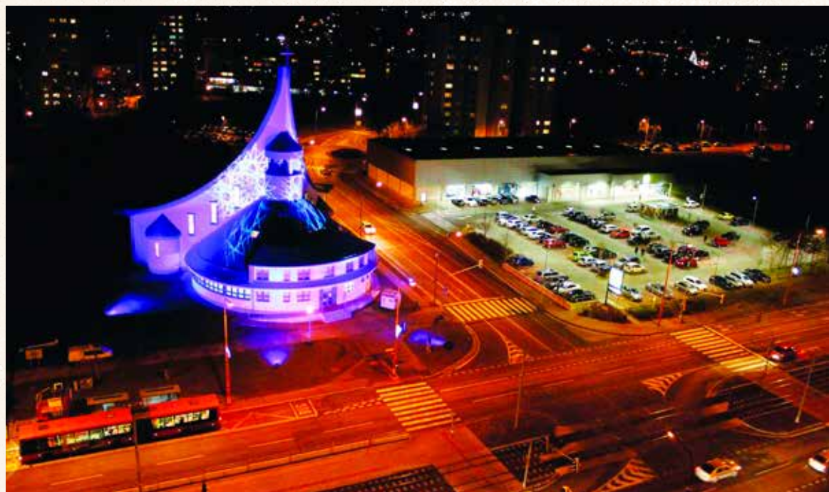
Slávnostne nasvietený kostol Ducha Svätého v decembri roku 2016.

Johann Wolfgang Goethe opisuje stromček u strýka v roku 1765. V roku 1815 sa spomína prvý stromček v Gdaňsku, v roku 1817 vo Viedni, v roku