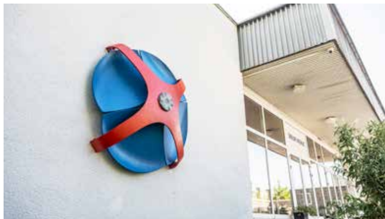
Zrekonštruovaný reliéf na fasáde internátu na Saratovskej ulici.