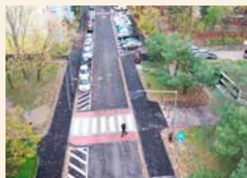
Pohľad na zrekonštruovanú Nejedlého ulicu zhora.

To všetko priniesla rekonštrukcia Nejedlého ulice. Trvala približne štyri mesiace a išlo o najväčšiu investíciu mestskej časti do dopravnej infra-