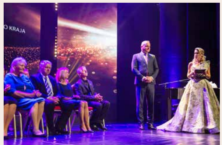
Oceňovanie býva každoročne slávnostnou udalosťou s programom.