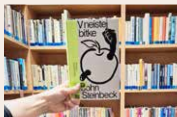
JOHN STEINBECK V neistej bitke

Neistota, podvody, nedorozumenia. Komu veriť? Možno vôbec svojej rodine, blízkym? Aj to prežíva citlivý študent Arthur, ktorý sa snaží pochopiť, čo sa okolo neho deje v knihe významného holandského povojnového spisovateľa. Román nezobrazuje vojnové hrôzy priamo, je skôr o ťažkej, skľučujúcej atmosfére a sondovaní do jednotlivých duší.