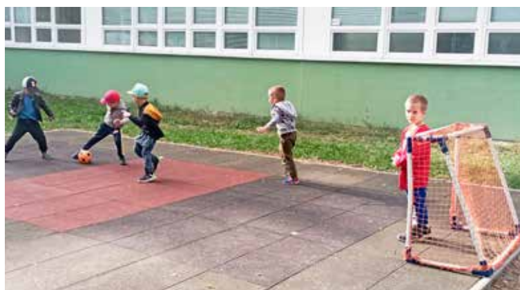
Malí futbalisti s novými bránkami.