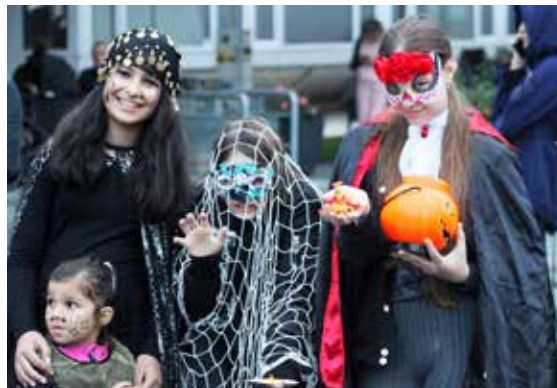
Pred domom kultúry ste mohli stretnúť aj rôzne krásne strašidlá.

Od 16-tej popoludní čakali na malé strašidlá v Dome kultúry Dúbravka tvorivé dielne. Kto mal náhodou pochybnosti, či je jeho maska dostatočne strašidelná, alebo nebudaj prišiel bez masky, mohol využiť maľovanie na