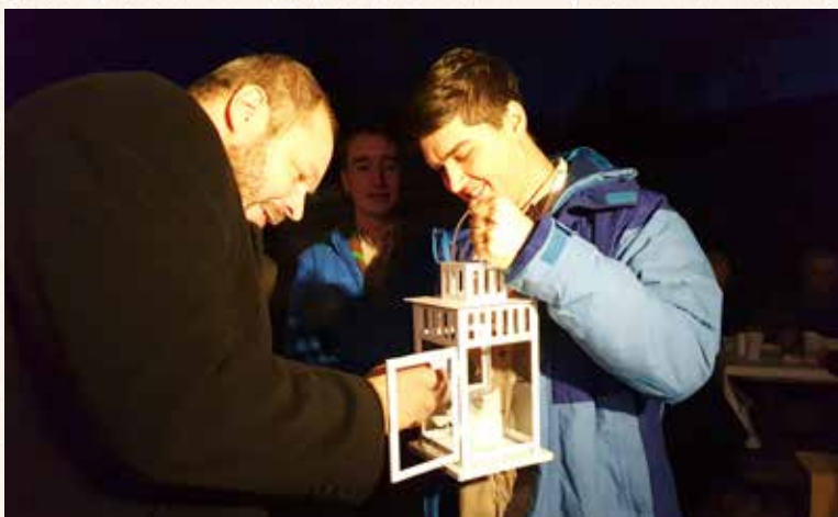
Súčasťou predvianočného očakávania je aj odovzdávanie betlehemského svetla, ktoré do Dúbravky už tradične prinášajú skauti 11. zboru Biele delfíny.

Rodiny zabíjali zväčša po dohovore s príbuznými a známymi, aby si výslužkami zabezpečili prísun čerstvého mäsa a zabíjačkových špecialít aj v čase, keď sa vlastné zásoby už minuli. Veľká výslužka pre najbližšiu rodinu a dobrých známych sa skladala spravidla z dvoch kúskov mäsa, štyroch jelítok a kanvice kapusty či ovaru, malá výslužka znamenala kus mäsa, dve jelitka a ovar.