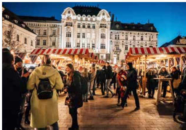
Bratislavské trhy na Hlavnom námestí.