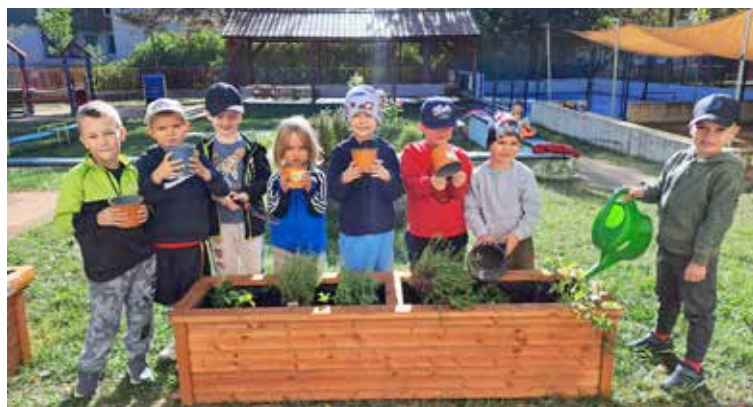
Záhradkári zo Švantnerky.

Edukačné aktivity s deťmi boli zamerané na pozorovanie pod mikroskopom, vyhľadávanie a porovnávanie bylín v knihách s realiami. Deti s radosťou priniesli knihy, ktoré majú v domácich knižniciach.