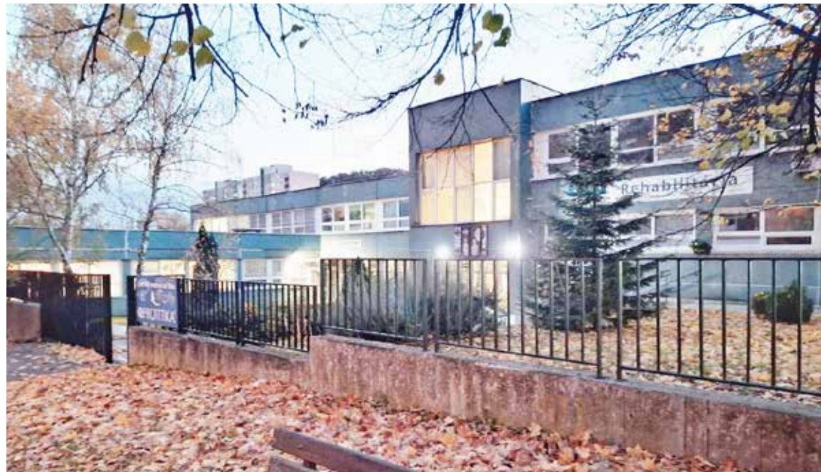
Exteriér Zdravotného strediska Paracelsus.