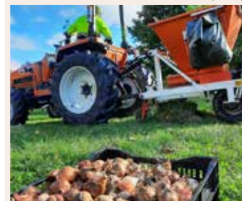
Sadenie cibulových zmesí.