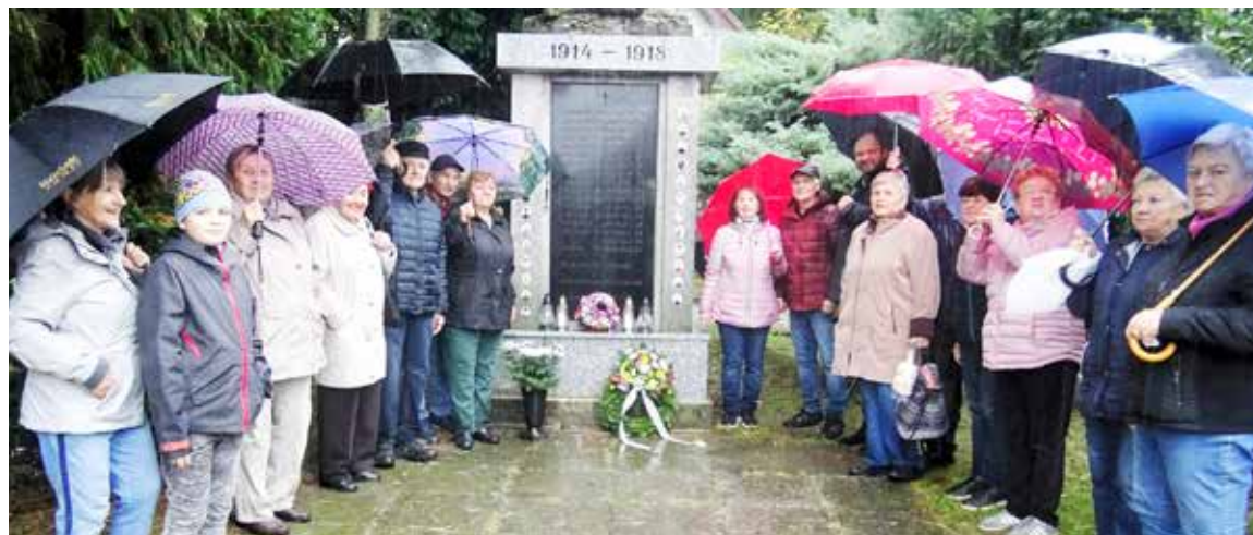
Stretnutie pri pamätníku na Jadranskej.