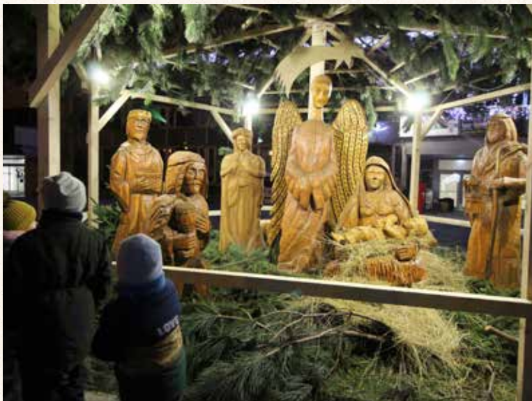
Tradičiou sa stal už aj drevený betlehem, ktorý pre Dúbravku vyrezávalo osem slovenských rezbárov a dokončený bol v roku 2018.

V Jarovciach popoludní pred Štedrým večerom gazda porozkladal v izbe na podlahe slamu, na ktorej potom rodina tri noci spávala. Táto obyčaj bola spojená s poverou, aby sliepky dobre znášali. Skôr ako gazdina prikryla stôl obrusom, nasypala naň obilie rôzneho druhu v tvare kríža. Navrch položila potom „božitnjak“, štedrovečerný pletený koláč, ozdobený figúrkami vtákov. Naprostred stola položili malý vianočný stromček "božitno drivo". Malý stromček odniesli aj na hroby. Nezabudli ani na tanier s vyklíčenou pšenicou zasiatu na deň sv. Barbory.