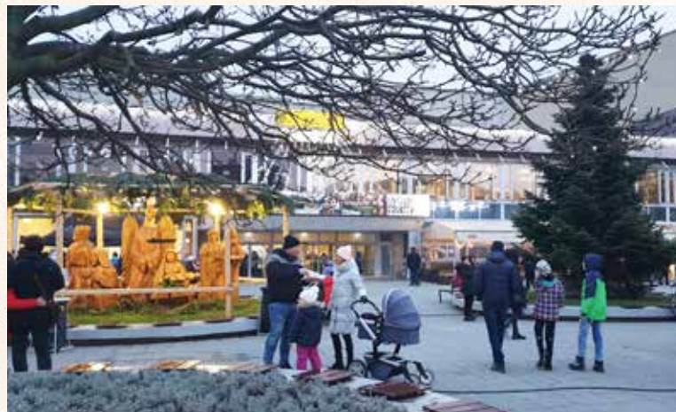
Vianočné trhy v meste i v Dúbravke sa stali neodmysliteľnou súčasťou adventného obdobia.

V Dúbravke sa zabíjačky konali hlavne od Kataríny do Vianoc, ale aj počas fašiangov pred Veľkou nocou. Bolo to obdobie, keď bývalo relatívne hojnejšie. V Dúbravke musela svinka