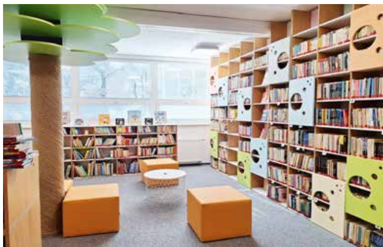
Zrekonštruované oddelenie pre deti a mládež.

Miestna knižnica prechádza postupnou modernizáciou. Vedenie mestskej časti začalo s rekonštrukciou v lete 2016. Staré okná vymenilo za plastové, podobne aj sklenené výplne v budove, takzvané kopily. Nasledovala rekonštrukcia oddelenia pre dospelých a debarierizácia.