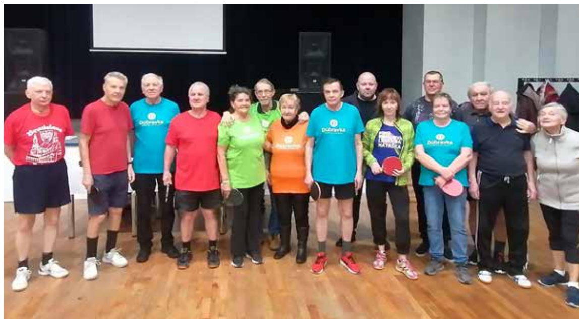
Účastníci majstrovstiev Dúbravky seniorov v stolnom tenise.