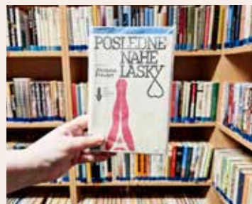
JACQUES PRÉVERT POSLEDNÉ NAHÉ LÁSKY