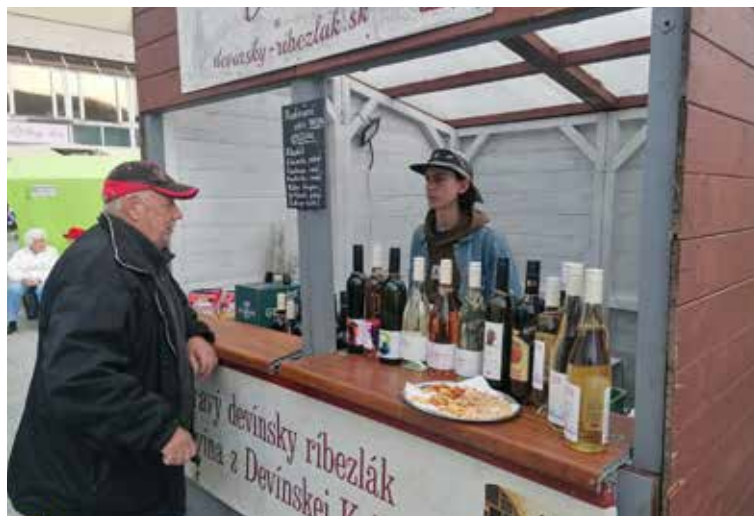
Stánky núkali výrobky, aj niečo pod zub.

Vo vnútri kultúrneho domu predávali patchworkové a háčkové výrobky alebo drôtené šperky. A že šlo o ručnú prácu mohli návštevníci poznať tak, že v stánku sedeli priamo autori a tvorili ďalšie kúsky. Nechýbal ani stánok so vzácnymi kameňmi. Okrem