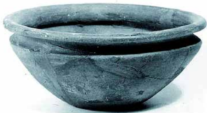
Laténska miska z 2. stor. pred Kr. bola nájdená v dvojkoľovej polozemnici spolu s úlomkami sklenených náramkov a sponami.

V spodných častiach pecí sa nachádzal odpad po tavbe – železité struskové zliatky a popol premiešaný s uhlíkmi. Podľa pokusných tavičiek z Čiech a Poľska sa v podobných peciach mohlo počas jednej tavby získať 3-5 kg kujného železa. Pece boli jednorazové, po úspešnej tavbe bola šachta rozobratá a vytavené železo následne spracované v kováčskej dielni. Uhlíky