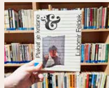
ĽUBOMÍR FELDEK PLAKAŤ JE KRÁSNĚ

O samelý bežec, čiže člen básnickej skupiny pod týmto názvom. Básnik, prozaik, autor textov na viaceré albumy Deža Ursinyho, Dúbravčan. Do literatúry vstúpil zbierkou Krátke detstvo kopijníkov. Zbierka Pred premenou je v poradí jeho štvrtá, napísal ich však takmer dvadsať. Nech siahnete po akejkolvek, zárukou je originalita i poetické prežívanie.