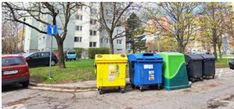
Stojisko chýba napríklad na Ožvoldíkovej. Kontajnery stoja na ceste.

Zriadiť a postaviť si kontajnerové stojisko je úlohou obyvateľov bytového domu spolu so svojím správcom. Zámer správca predkladá a schvaľuje na domových schôdzach.