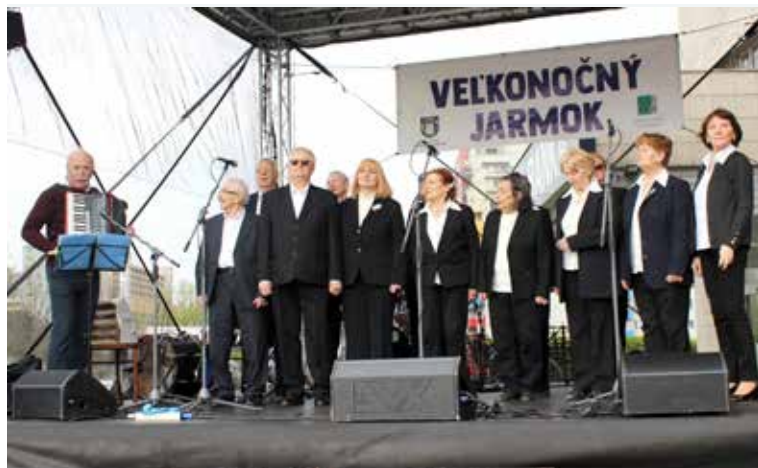
Súbor Dúbravanka sa predviedol aj na nedávnom Velkonočnom jarmoku.