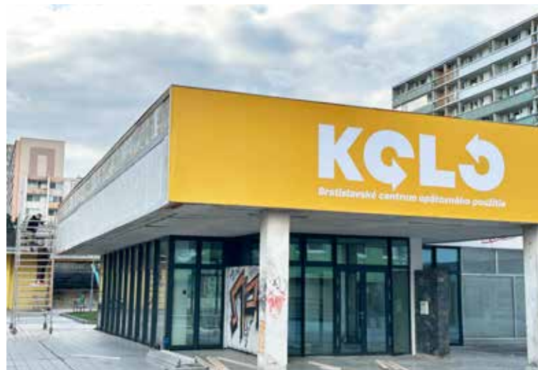
KOLO funguje už aj v priestoroch na Jurigovom námestí v Karlovej Vsi.

Návštevníčky a návštevníci môžu do oboch prevádzok priniesť veci,