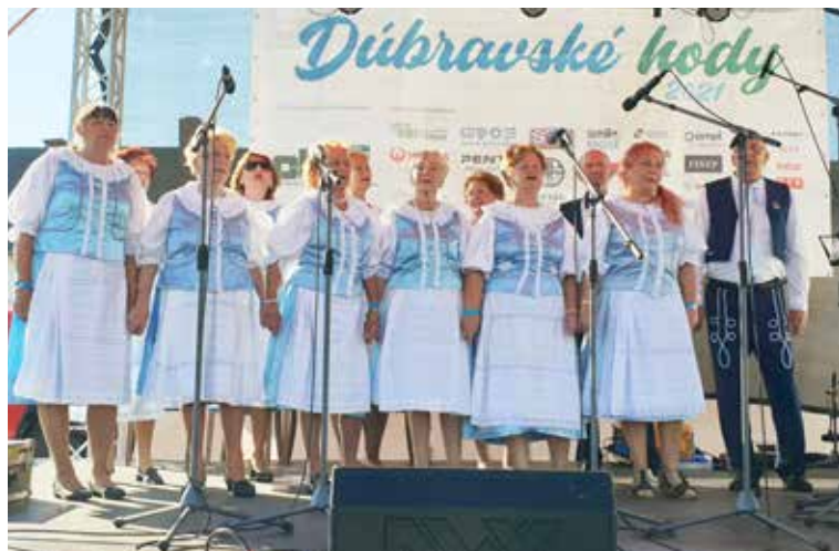
Dúbravanka patrí už tradične k Dúbravským hodom.