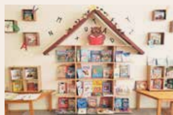
Knižnica v materskej škole.