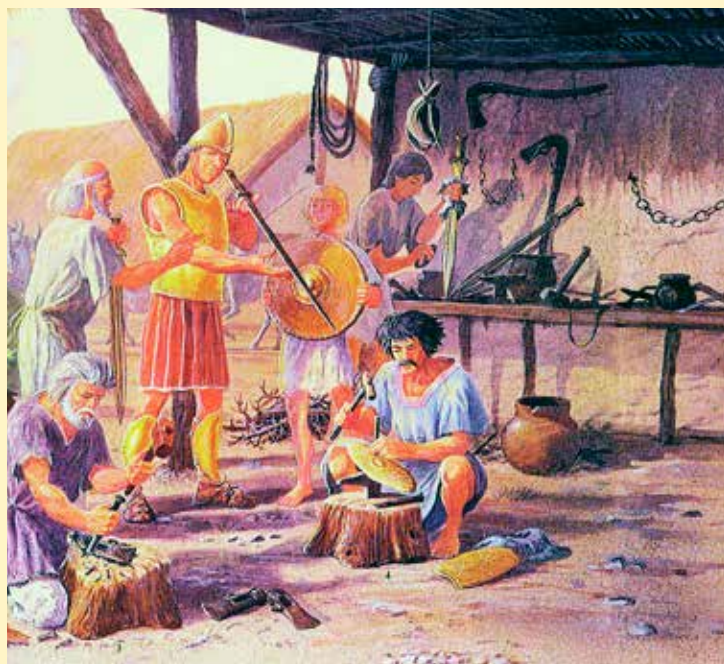
Po Keltoch zostali na území veľkej Bratislavy zachované viaceré sídliská. Jedno z nich sa nachádzalo aj v Dúbravke na Veľkej Lúke.