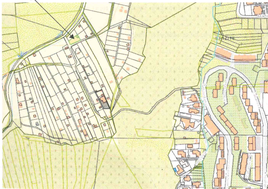
Dúbravka v záhradnej oblasti pri Veľkolúckom potoku.

c) Analýza prípadných rizík spojených s využívaním nehnuteľností, najmä závady viaznuce na nehnuteľnosti a práva spojené s nehnuteľnosťou: Vo výpise z LV č. 847 nie sú k ohodnocovanému pozemkom zapísané záložné práva ani vecné bremená. Iné riziká v čase obhliadky neboli známe.