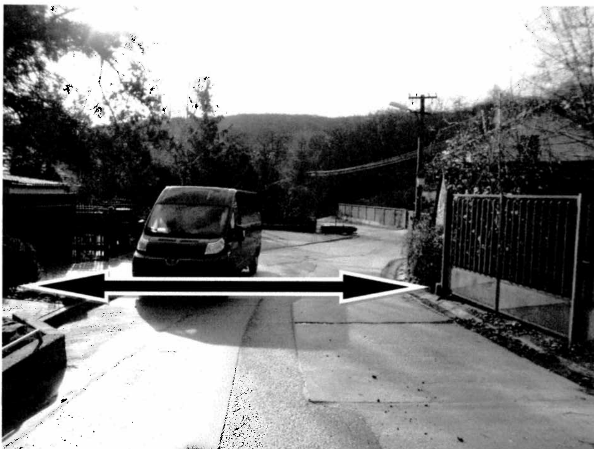
Pohľad na cestu, ktorá zostáva zachovaná v šírke minimálne 8,5 m.