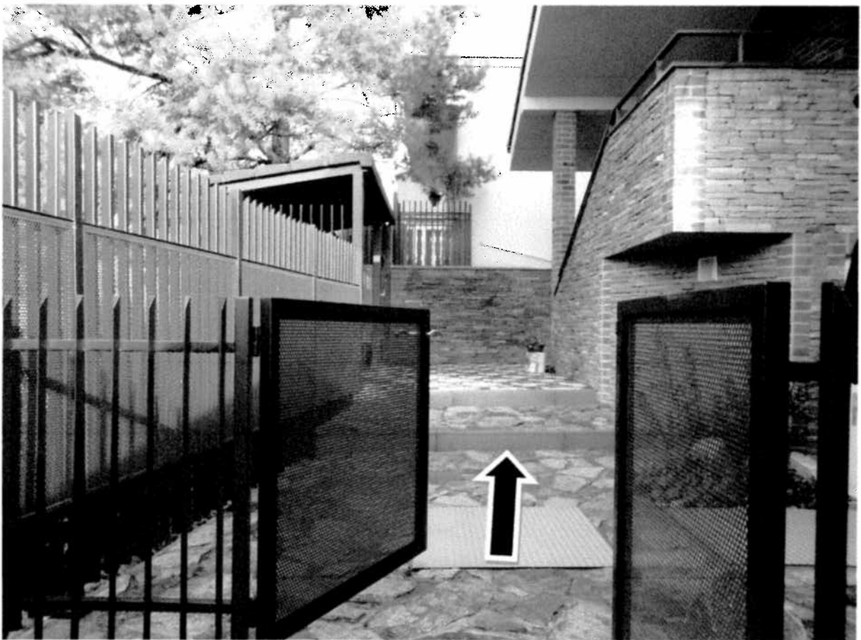
Pohľad na odpredávanú časť pozemku za plotením