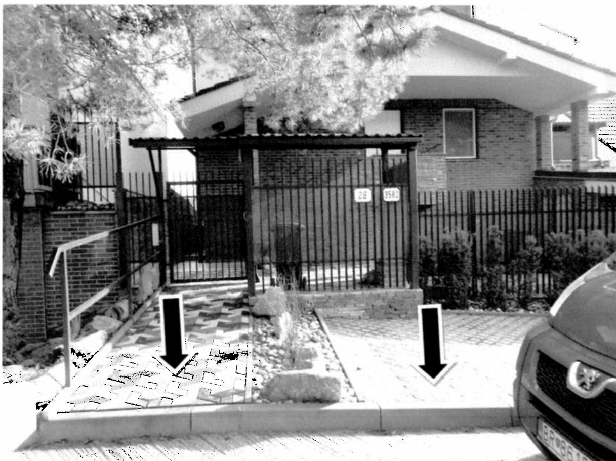
Priestor pred oplotením zostáva verejným priestranstvom