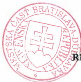
RNDr. Martin Zaťovič starosta

Proti tomuto rozhodnutiu možno podať odvolanie do 15 dní odo dňa jeho oznámenia na mestskú časť Bratislava-Dúbravka, Žatevná 2, 844 02 Bratislava 42, pričom odvolacím orgánom je Okresný úrad Bratislava, odbor výstavby a bytovej politiky (podľa § 54 správneho poriadku). Toto rozhodnutie je preskúmateľné súdom až po vyčerpaní riadnych opravných prostriedkov.